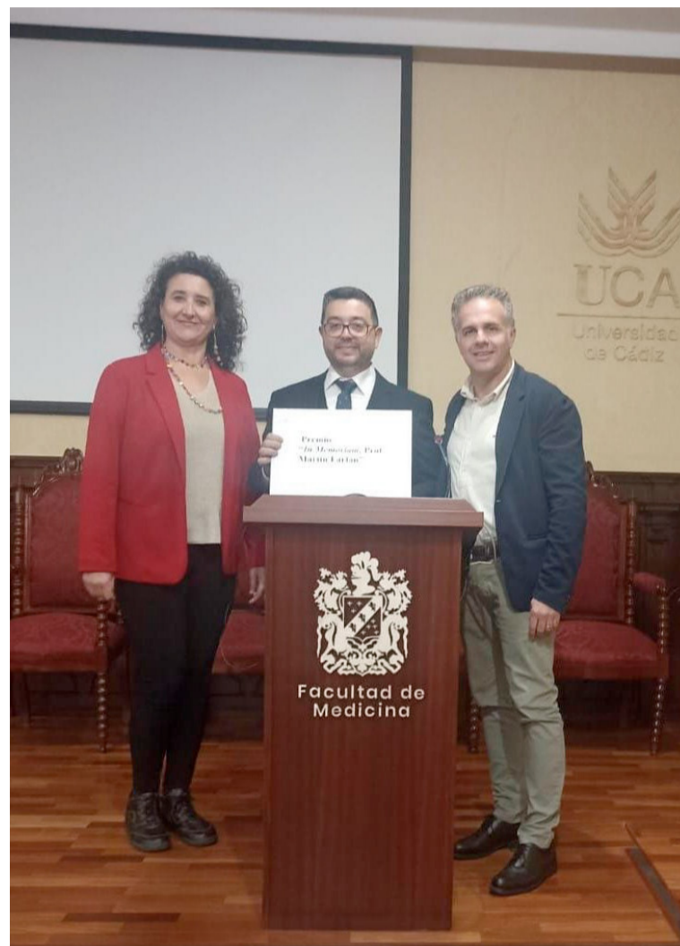
Los doctores en Enfermería premiados por su trabajo de investigación

PROTECCIÓN DE DATOS | A efectos del Reglamento Europeo de Protección de Datos, le informamos de que SATSE, en su condición de editor de medios impresos y electrónicos, así como las empresas que colaboran en las labores de edición, publicación y distribución, tratan datos personales con la finalidad de divulgar información de interés para la profesión enfermera y sus afiliados/as. MUNDO SANITARIO y los boletines digitales se editan, publican y distribuyen en el ámbito de las actividades legítimas de SATSE. Los titulares de datos personales pueden ejercer los derechos de acceso, rectificación, supresión, revocación del consentimiento, así como el resto de derechos en la siguiente dirección electrónica: equipo-dpd@satse.es Alternativamente, puede dirigirse al delegado de protección de datos de SATSE a través de privacidad-dpd@satse.es Más información sobre nuestra política de protección de datos en www.satse.es/aviso/politica-de-proteccion-de-datos-de-satse .