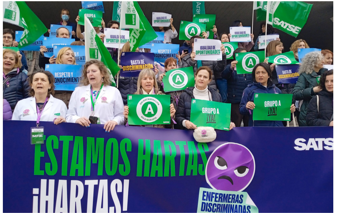
Concentración de enfermeras en Zaragoza

Una clasificación profesional que no es acorde con la ordenación actual de los títulos universitarios y el desarrollo competencial experimentado por la