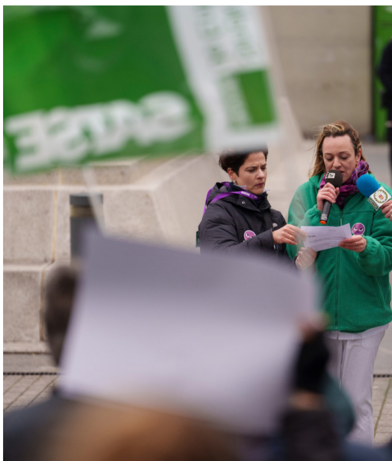
Lectura del manifiesto de SATSE por el 8M

Para ello, no descarta desarrollar ninguna acción reivindicativa con el objetivo prioritario de acabar con la discriminación hacia su profesión y lograr una clasificación profesional justa. ■