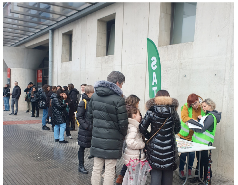
SATSE informando en el reciente examen de la OPE de Enfermería

De la misma forma, la organización sindical entiende que la inexplicable abstención, y por tanto, indiferencia, de los sindicatos de clase ELA, LAB, AFAPNA y UGT, "da alas" al positivismo que está empezando a imperar en la administración autonómica.■