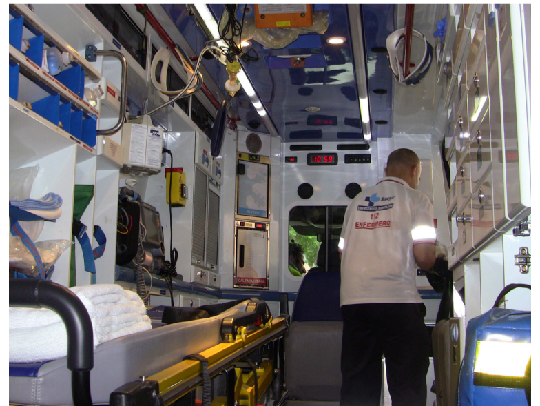
El acuerdo beneficiará a las enfermeras que trabajan en Emergencias Sanitarias

Recuerda que eran los únicos trabajadores de la Junta de Castilla y León que trabajando en estas jornadas no percibían retribución alguna por ello. ■