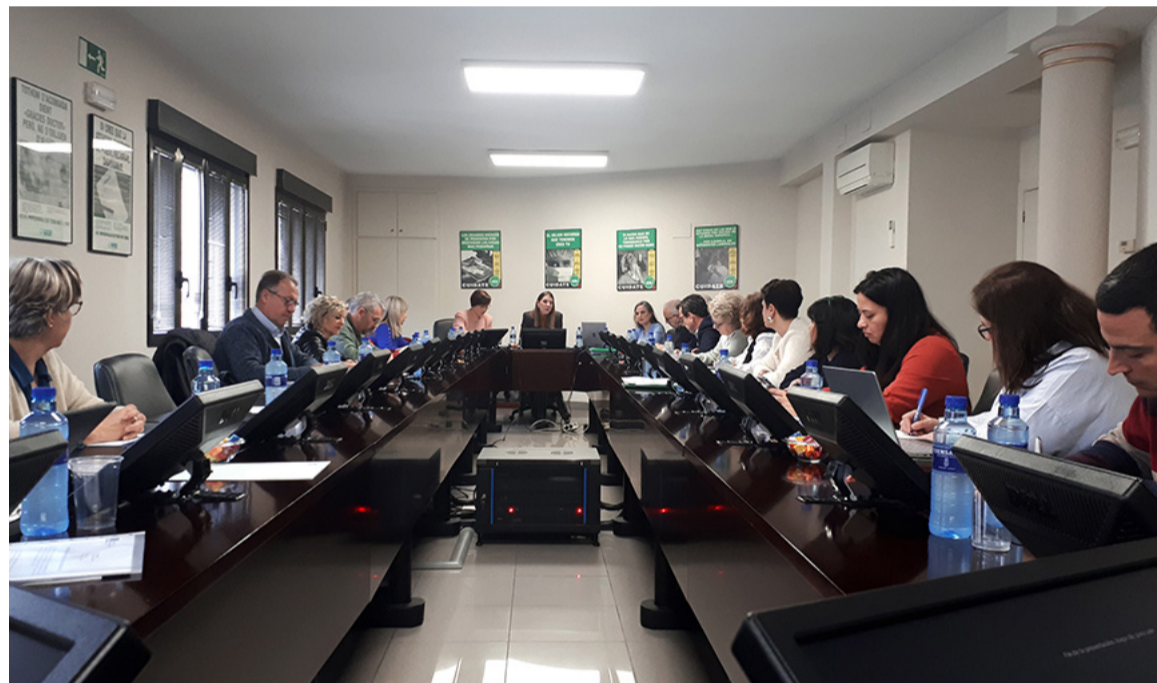
Reunión del último Comité Ejecutivo Estatal (CEE) de SATSE

El Sindicato recuerda que, tras la implantación del Espacio Europeo de Educación Superior,