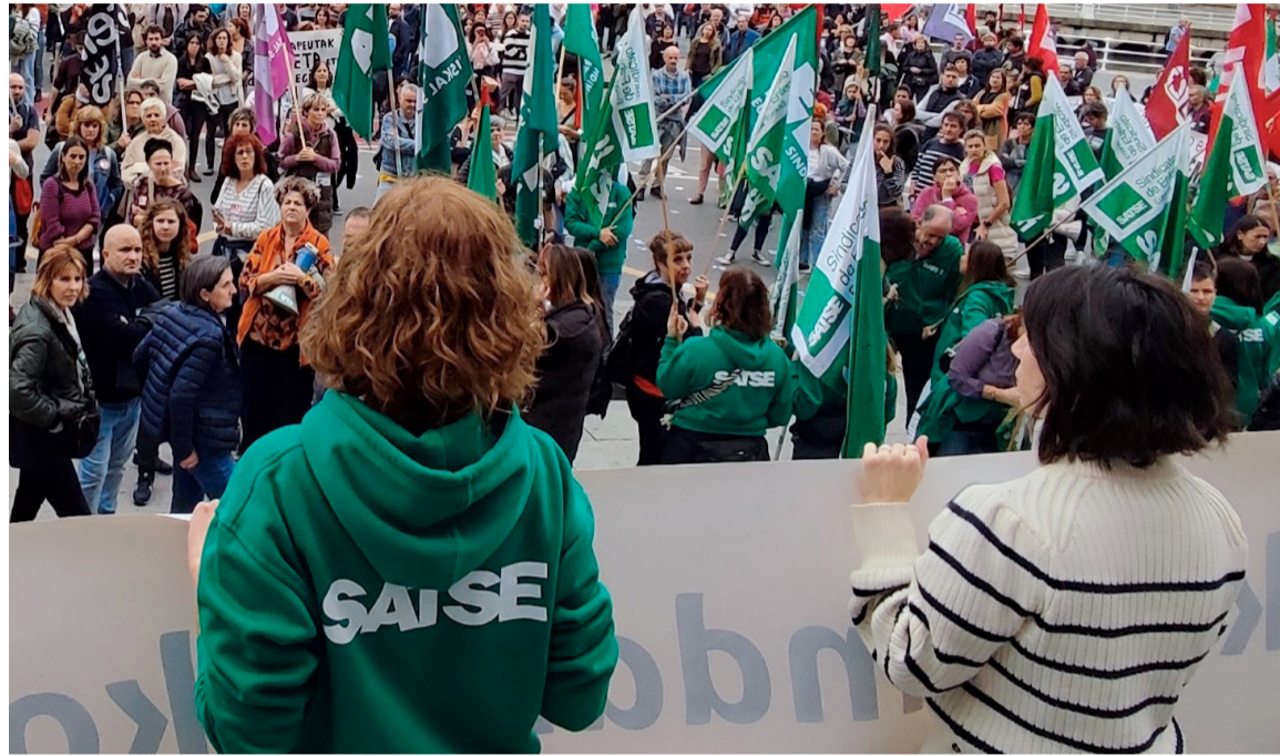
Concentración reciente con la participación del Sindicato de Enfermería

Además de recoger firmas, la organización está repartiendo pegatinas entre los profesionales para que las peguen en sus uniformes y muestren públicamente cuál de los procesos les impide avanzar.