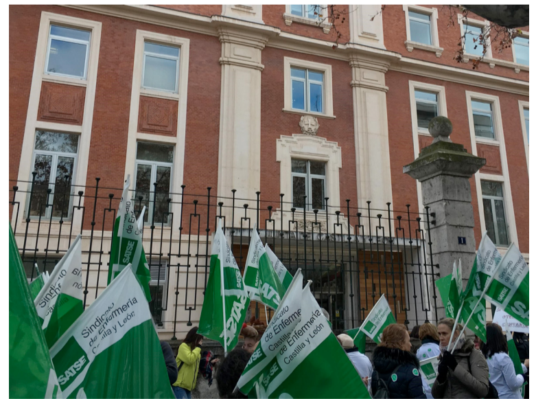
Protesta reciente de SATSE ante la Consejería de Sanidad

SATSE ha sido la voz y la representación de los profesionales desde la negociación sindical, pero también organizando movilizaciones a favor de mejoras laborales y profesionales, lo que le ha permitido lograr importantes acuerdos para la profesión.