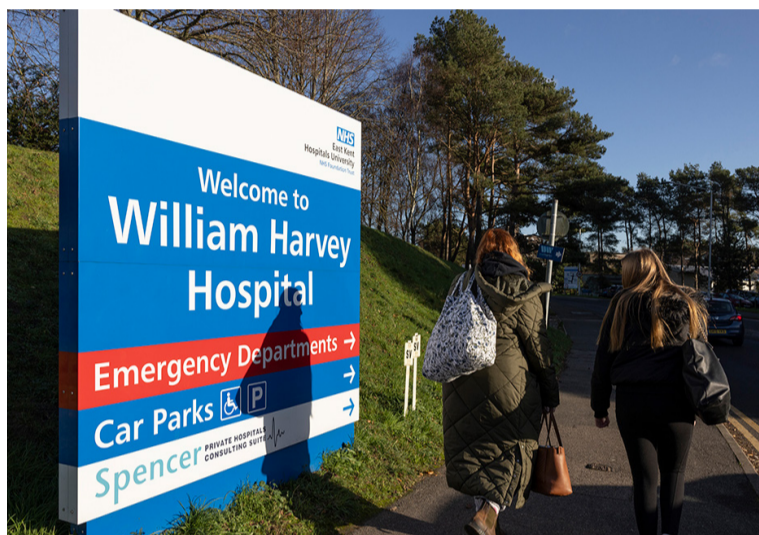
Miles de enfermeras han emigrado a otros países en los últimos años

La realidad es que en España se está haciendo una inversión muy importante para formar y