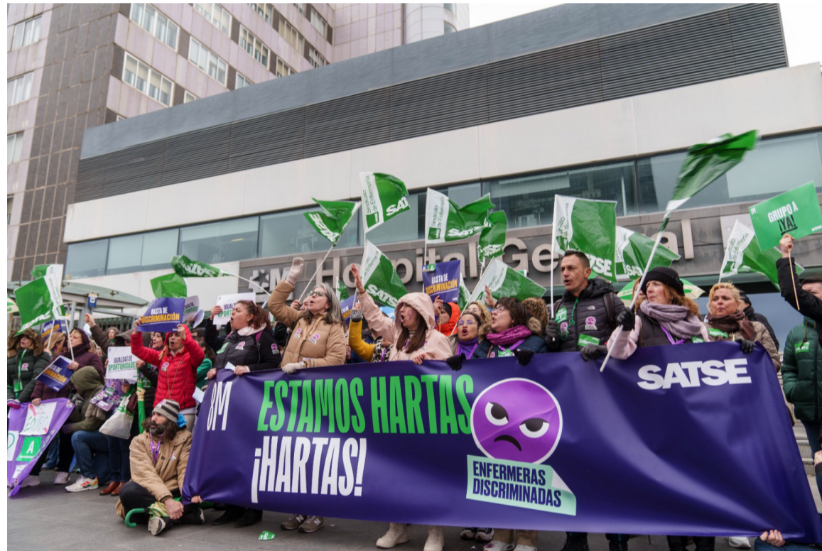
Las enfermeras se manifestaron en todo el país en contra de la discriminación y la brecha de género laboral

Una clasificación profesional que no es acorde con la ordenación actual de los títulos universitarios y el desarrollo competencial experimentado por la profesión en los últimos años y