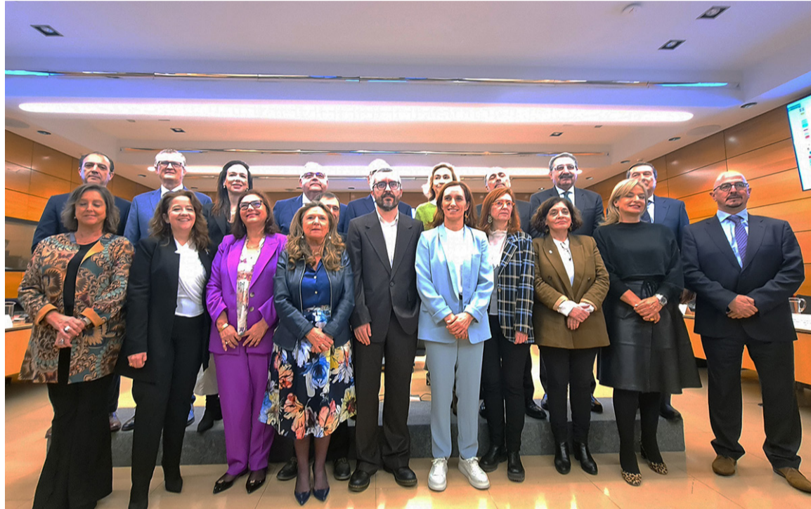
La ministra de Sanidad, Mónica García, junto a las/os consejeras/os de Sanidad

Asimismo, pide la presencia de estas profesiones en la Comisión Permanente de Atención