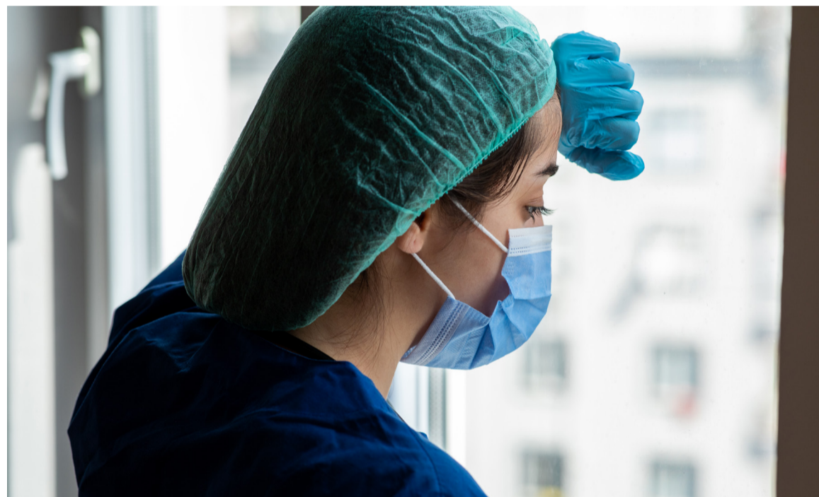
Los profesionales necesitan medidas reales que cuiden y protejan su salud mental

El Sindicato apunta que, en el caso de las y los profesionales de Enfermería, los riesgos psicosociales (estrés, burn out, depresión, ansiedad...) son mayores por su contacto cercano y permanente con el dolor y el sufrimiento ajeno.