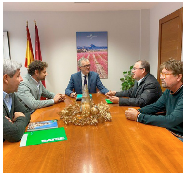
Reunión reciente del consejero de Sanidad con el Sindicato de Enfermería

Con el acuerdo alcanzado se ha conseguido una demanda generalizada e insistentemente solicitada por el colectivo. Era una prioridad en la mejora de las condiciones laborales que, a su vez, incide en la mejora de empleo. "Esperamos que perdure para siempre en nuestro entorno laboral", concluye SATSE. ■