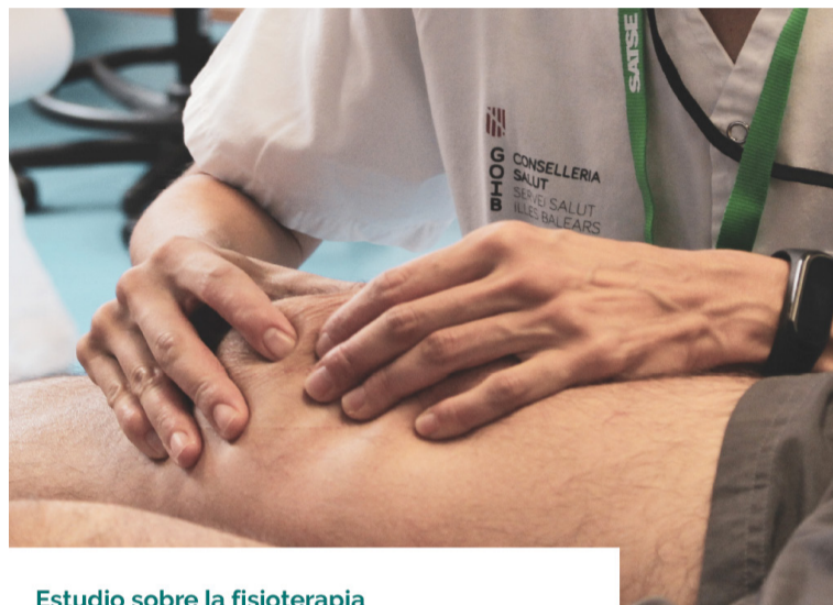
Estudio sobre la fisioterapia en la sanidad pública Balear

El estudio incluye una serie de propuestas tanto generales como específicas para mejorar las cuestiones que se han analizado, con el objetivo de incrementar los profesionales con mayor reconocimiento de competencias y la modernización de las carteras de servicios, disminución del gasto sanitario y mejora de la atención recibida.■