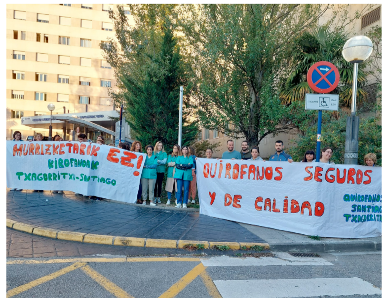
Concentración de los profesionales de la OSI Araba

A esta denuncia, la organización sindical añade las constantes prolongaciones de jornada que deben realizar las enfermeras de los quirófanos, debido a la mala planificación de Osakidetza, y el tener unos vestuarios que incumplen la ley.■