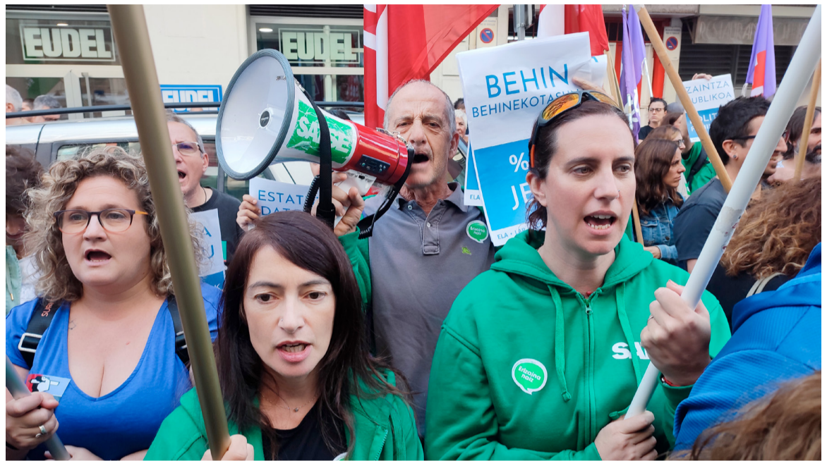
Protesta de SATSE Euskadi para reclamar mejoras laborales de las y los profesionales

Previamente a la primera jornada huelga y en un intento de diálogo, los sindicatos convocaron a las instituciones a una reunión en el Consejo de Relaciones Laborales, ya que de ellas