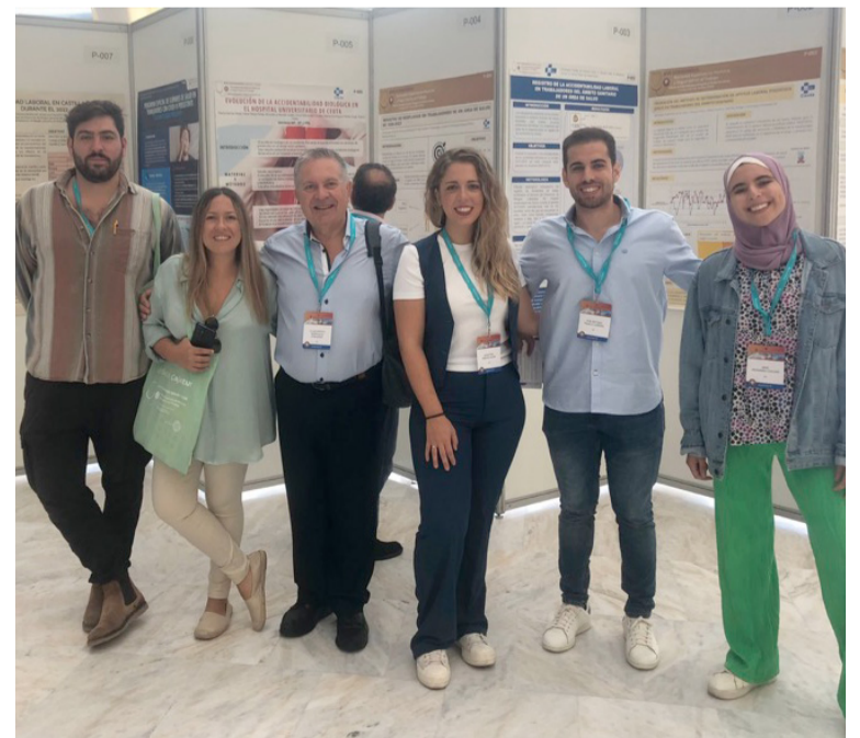
El equipo del Servicio de Prevención de Riesgos Laborales de Ceuta

El enfoque de esta investigación difiere de otros informes nacionales que se basan en formularios. En este caso, se realizó un seguimiento individualizado, lo que arrojó un panorama de sintomatología leve en contraposición a informes nacionales que sugieren que algunas personas continúan experimentando síntomas severos. ■