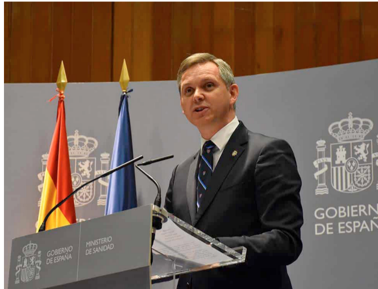
José Manuel Miñones, ministro de Sanidad en funciones

El Sindicato es firme partidario de que el Ministerio de Sanidad desarrolle una labor de supervisión, impulso y mejora de las condiciones de trabajo del personal sanitario.