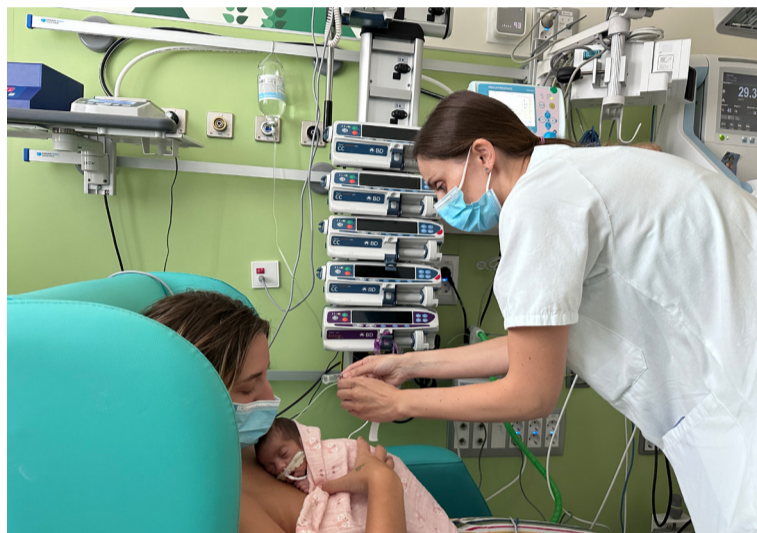
Una de las madres participantes en el modelo asistencial Family Integrated Care

El objetivo de FICare es que los padres lleguen a “convertirse” en enfermeros y, para ello, deben asistir a una serie de sesiones y talleres en los que se imparte formación específica.