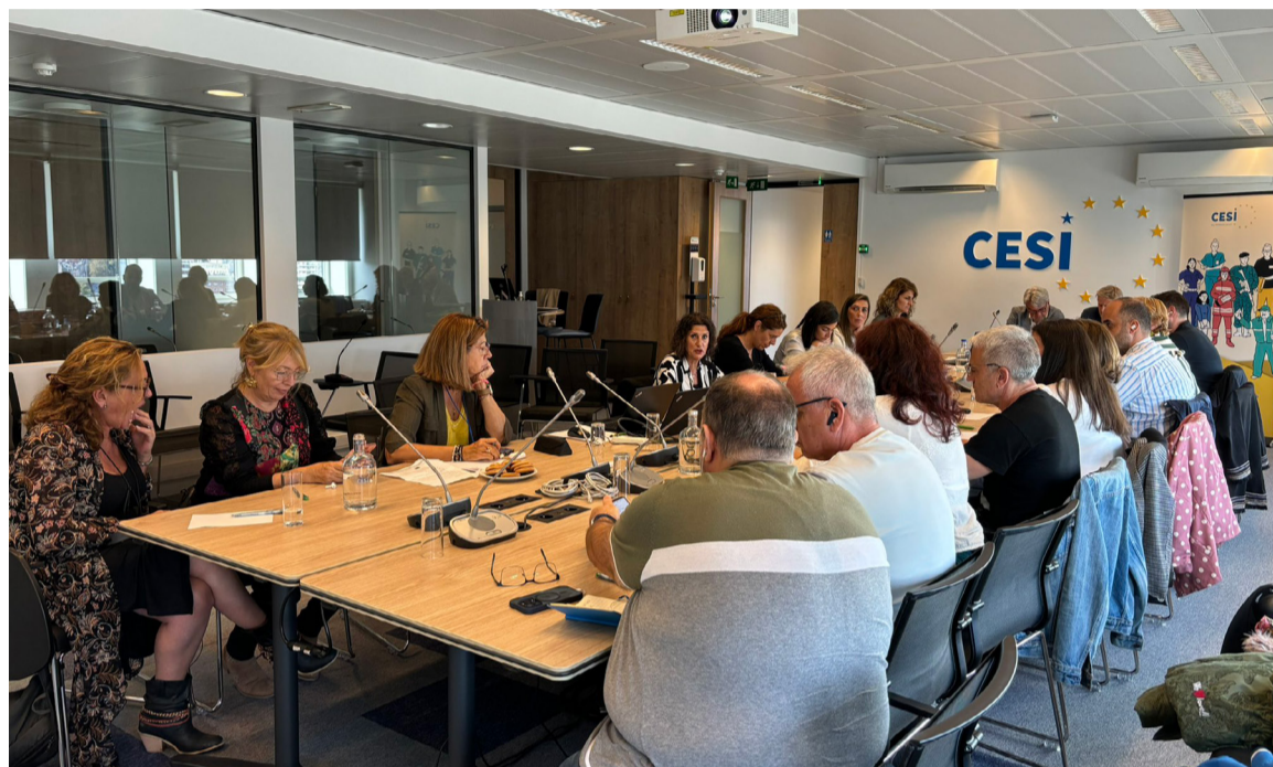
Reunión de la Comisión de Expertos en Servicios de Salud de la Confederación Europea de Sindicatos Independientes (CESI)

SATSE logra que se celebre una Audiencia Pública