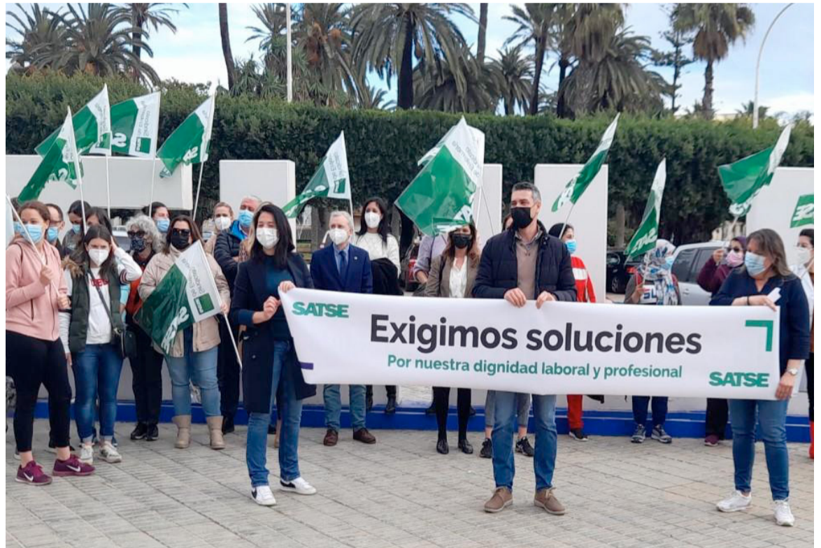
Una de las protestas realizadas en fechas pasadas por SATSE Melilla en defensa de los profesionales

Para resolver esta cuestión, desde SATSE apuestan por incorporar dos días de permiso, de similar naturaleza a los librados