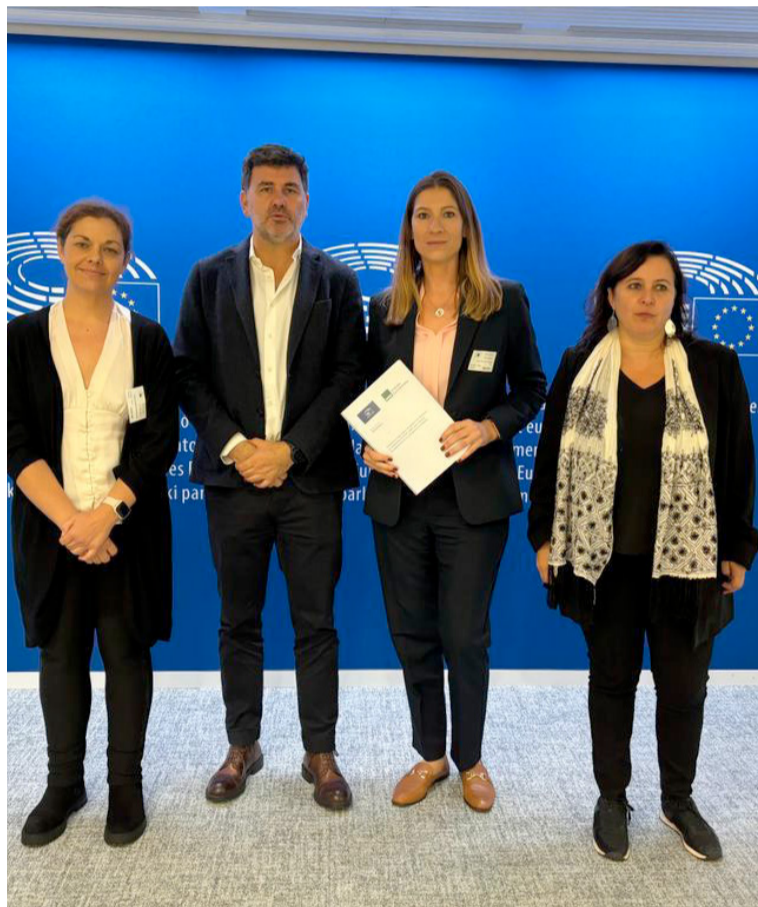
La presidenta de SATSE, Laura Villaseñor, junto a eurodiputados españoles

Tras la intervención del Sindicato en la Comisión, todos los