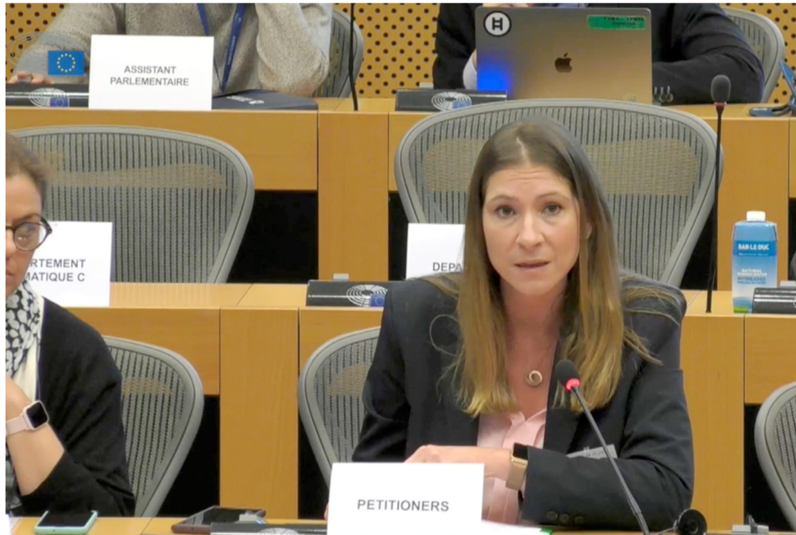
La presidenta de SATSE, Laura Villaseñor, en su intervención en la Comisión de Peticiones del Parlamento Europeo

Tras su intervención, todos los eurodiputados coincidieron en que existe una discriminación laboral y de género que perjudica a las enfermeras y fisioterapeutas, porque impide su desarrollo profesional. Por ello, se concluyó que la queja de SATSE debía permanecer abierta para su análisis.