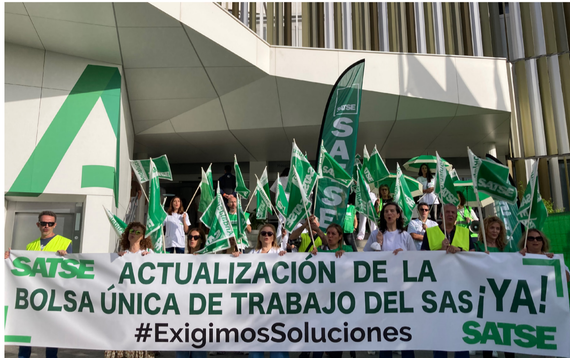
Protesta de SATSE en Sevilla reclamando la actualización de la bolsa única de trabajo del SAS

Las movilizaciones celebradas en toda Andalucía han dado continuidad a las acciones que