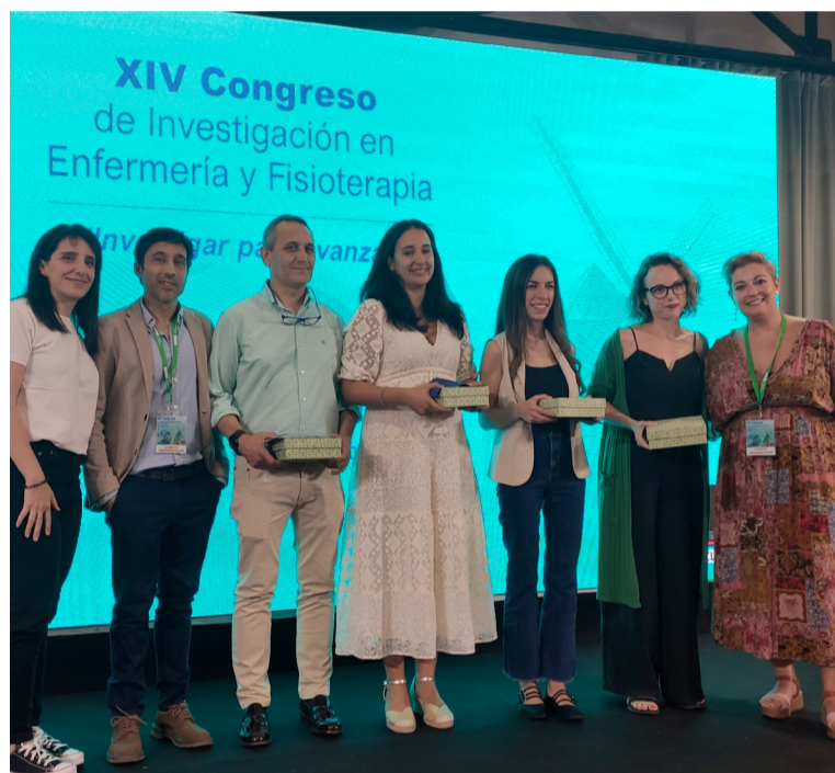
Profesionales premiados en el Congreso de Investigación de SATSE Ciudad Real

Durante la jornada presencial, que sirvió de clausura del congreso y en la que participaron más de 400 asistentes, se entregaron los galardones a los cuatro mejores trabajos elegidos de entre los 300 presentados.