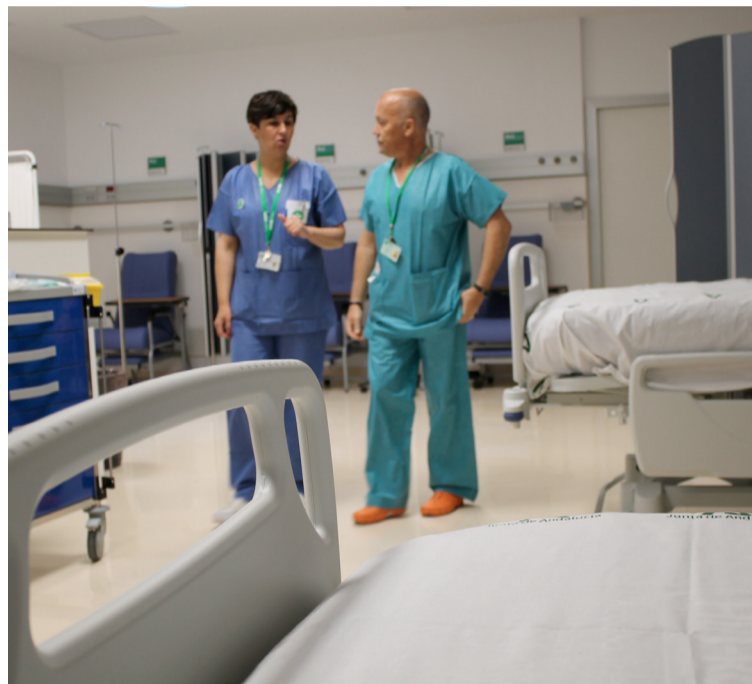
Delegados de SATSE en el Hospital de Malaga

SATSE defiende que se realice una labor de detección de los profesionales que tienen necesidades especiales de cara a una posible adaptación de su puesto de trabajo.