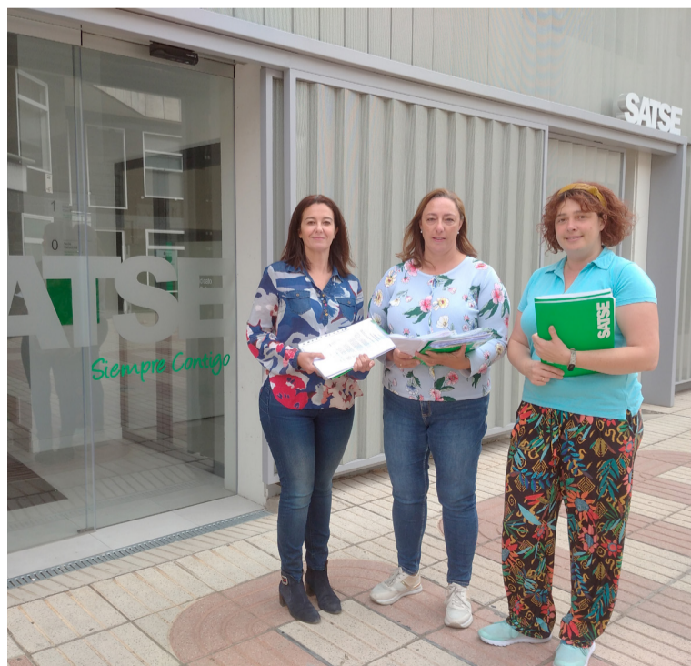
SATSE recogió firmas reclamando el incremento del kilometraje

El Gobierno central aprobó en julio una indemnización por kilometraje a los empleados públicos del Estado de 0,26 euros, 3 céntimos por encima de lo que está percibiendo un empleado público de la Comunidad autónoma (0,23 euros).