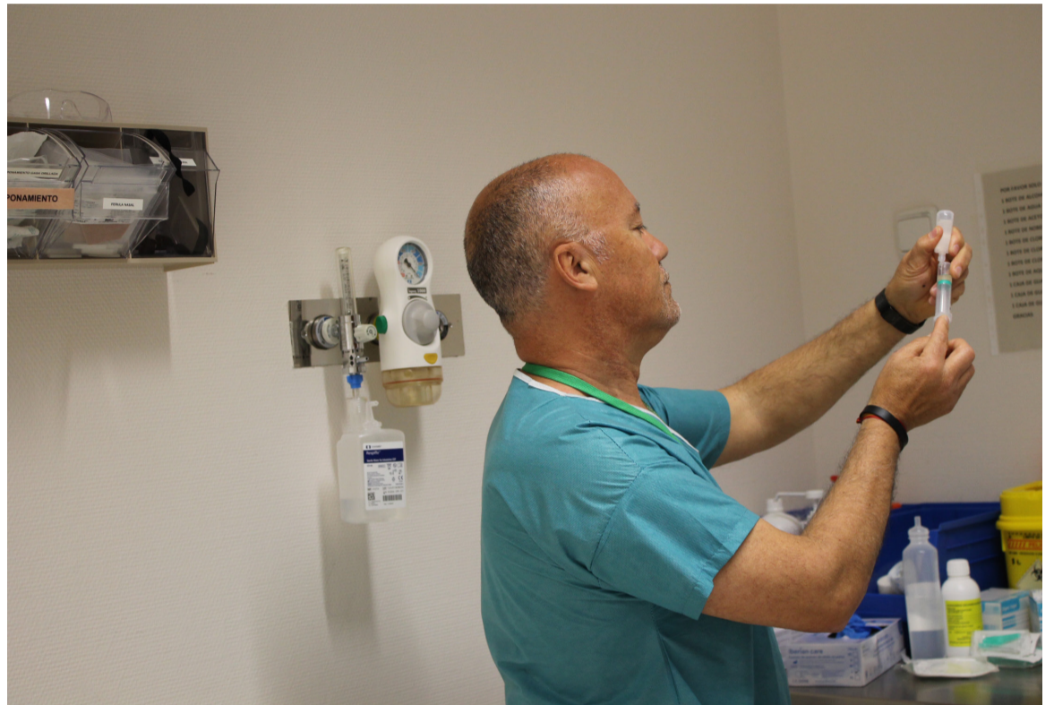
La mejora de la realidad laboral y profesional de las enfermeras y fisioterapeutas, prioridad de SATSE Canarias

En relación al Manual de Permisos y Licencias (PLV), se discutió la necesidad de negociar