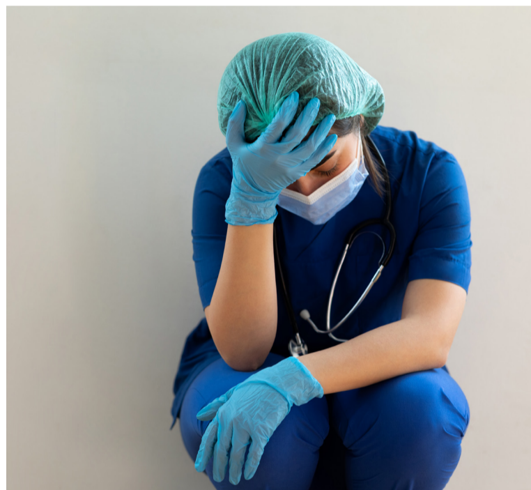
Los problemas de salud mental de los profesionales, prioridad para SATSE

Dentro del ámbito sanitario, la profesión enfermera es uno de los colectivos donde hay que prestar una mayor atención a este problema, ya que sus condiciones laborales influyen en su estado, no solo físico, sino psicológico y emocional también.