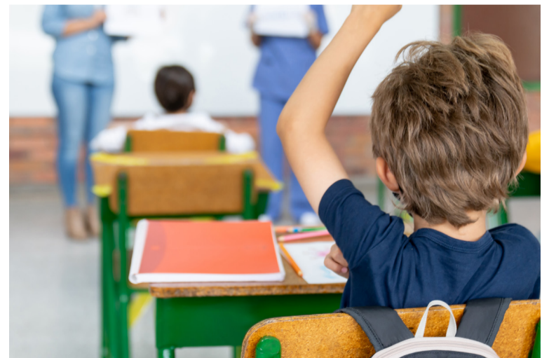
SATSE defiende la implantación generalizada de la enfermera escolar

Según un estudio de la Asociación de Pediatría, uno de cada cuatro alumnos tiene alguna enfermedad crónica. Diabetes, asma o alergia suelen ser las más