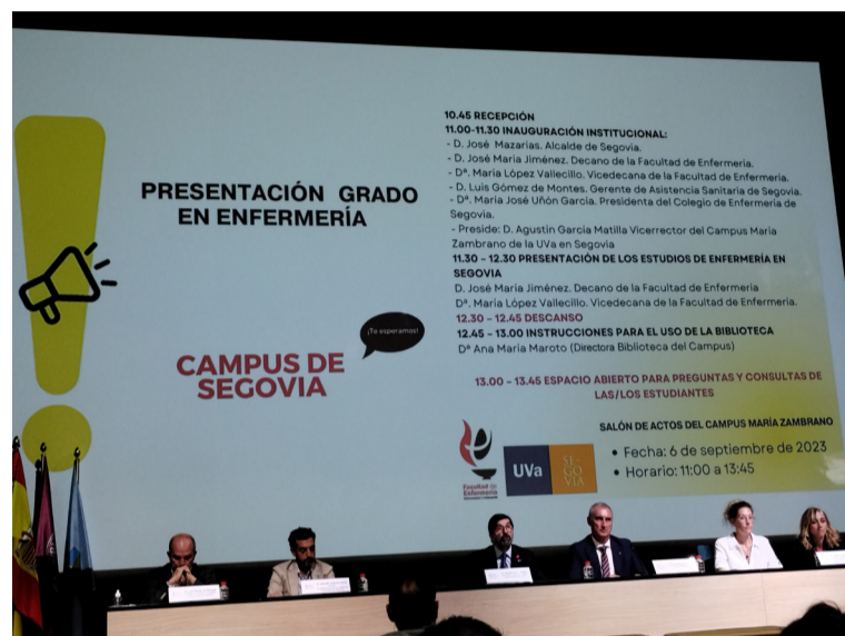
Acto de presentación del Grado de Enfermería en el Campus de Segovia

Ante la inauguración del curso de estos estudios en Segovia, SATSE Castilla y León agradeció a la Junta de Castilla y León, y a