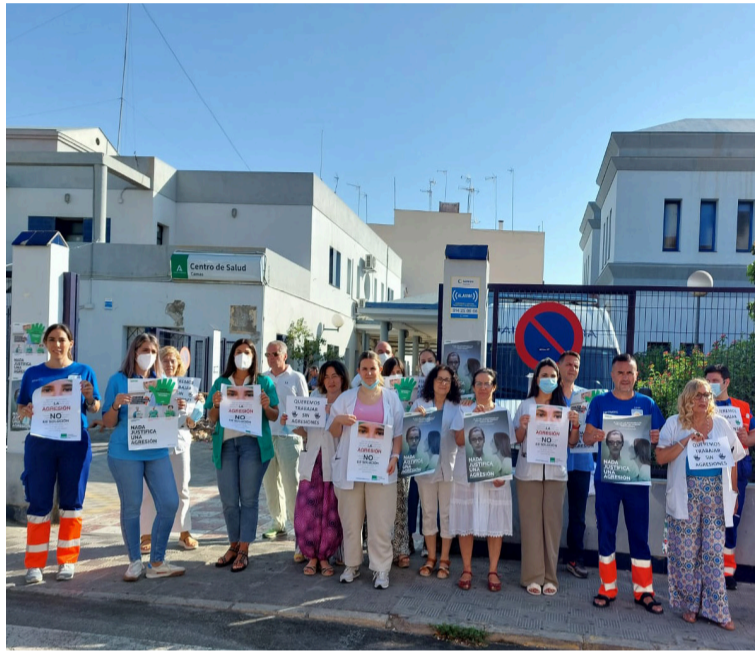
Protesta por una agresión en el centro de salud de Camas (Sevilla).

SATSE ha exigido, además, que se acelere la tramitación la denominada Ley de Autoridad de Profesionales del SSPA, que establecerá un régimen sancionador para los usuarios del SSPA con sanciones económicas propor-