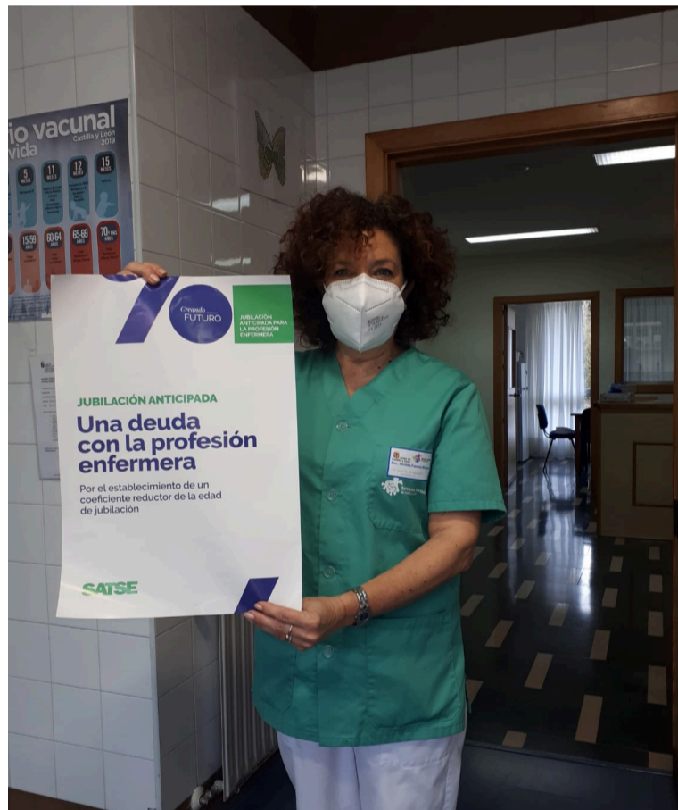
SATSE apoya a las enfermeras que desean poder jubilarse de manera anticipada

Esta reclamación fue presentada al Ministerio por el Sindicato de Enfermería en 2021, y se fundamentó en los estudios que demuestran cómo las difíciles