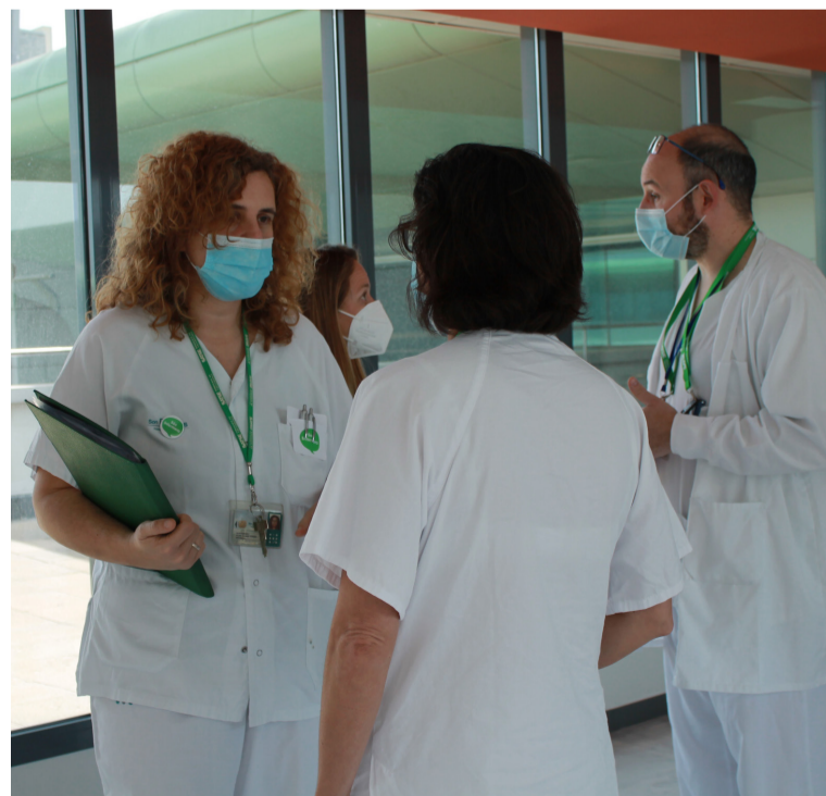
La mejora de las condiciones de la profesión, prioridad de SATSE.

Previamente a dichos nombramientos deben convocarse