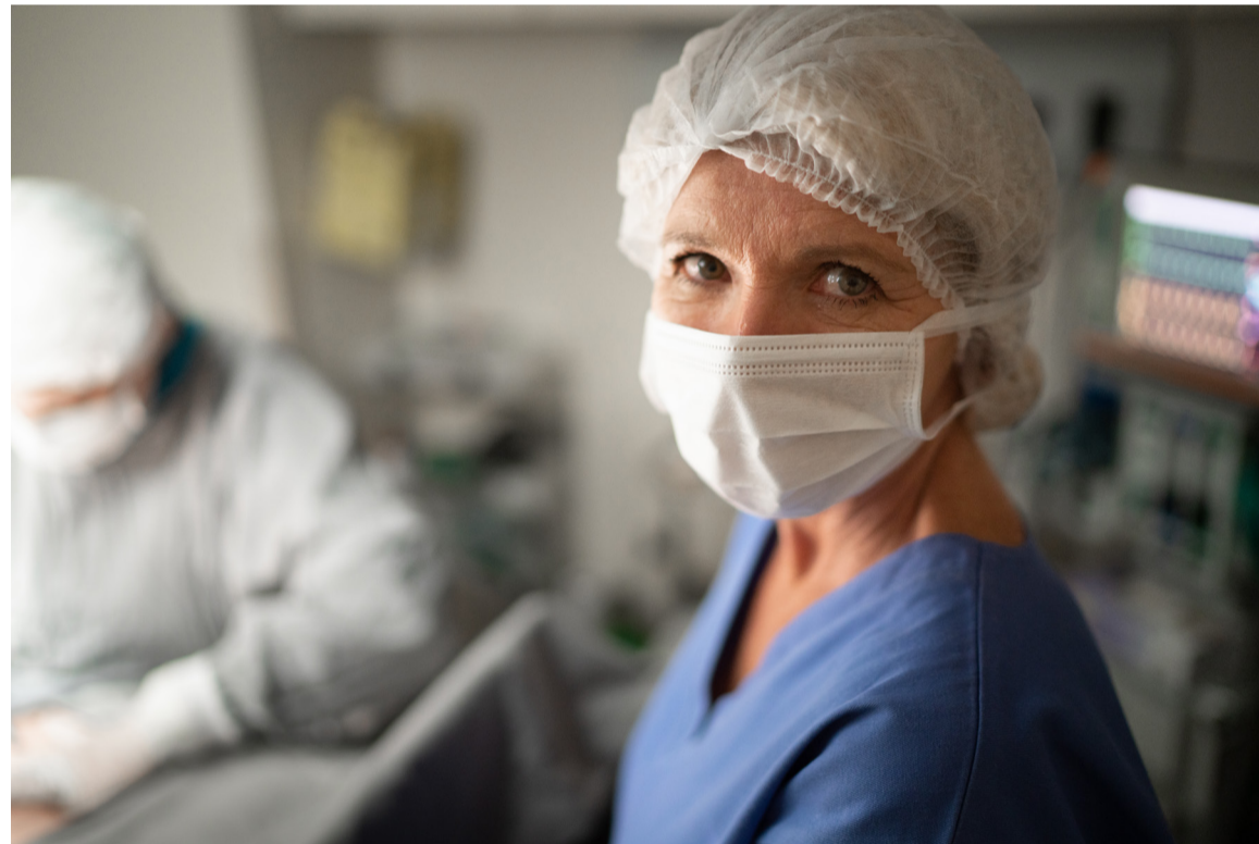
Las difíciles condiciones de trabajo de las enfermeras repercuten en su salud con el paso de los años

También insiste en que las exigencias propias del trabajo enfermero, ampliamente fundamentadas en la petición presentada al Ministerio de Seguridad Social, son de por sí motivo suficiente para tenerla en cuenta.