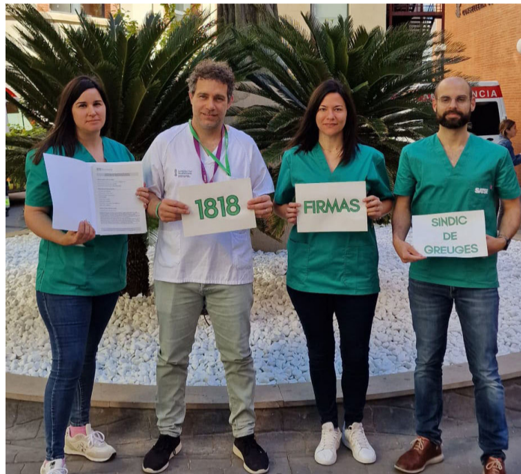
SATSE ha recogido firmas de la ciudadanía para dirigidas al Síndic de Greuges

Según los estudios realizados por SATSE, basados en la ratio que recomienda el Ministerio de Sanidad, sería necesario que en