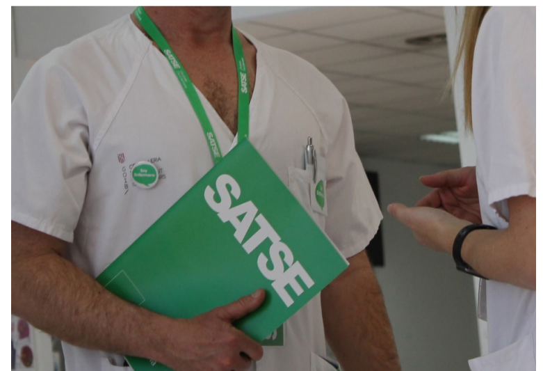
SATSE trabaja en la defensa de las condiciones de los profesionales

En cuanto a la incertidumbre en torno a la formación del Gobierno estatal, del cual depende la sanidad pública de Ceuta, a través del Ministerio de Sanidad, la organización sindical es tajante con que, si no se respetan los acuerdos, sería un "gravísimo paso atrás" que atentaría contra los derechos de los trabajadores afectados.