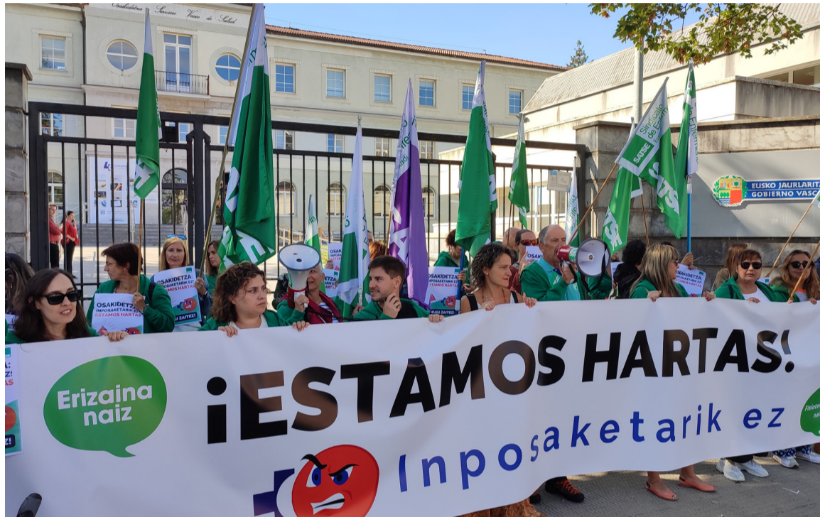
Acto de protesta de SATSE para denunciar la gestión de Osakidetza

Según SATSE, es injusto que hayan tenido que realizar este