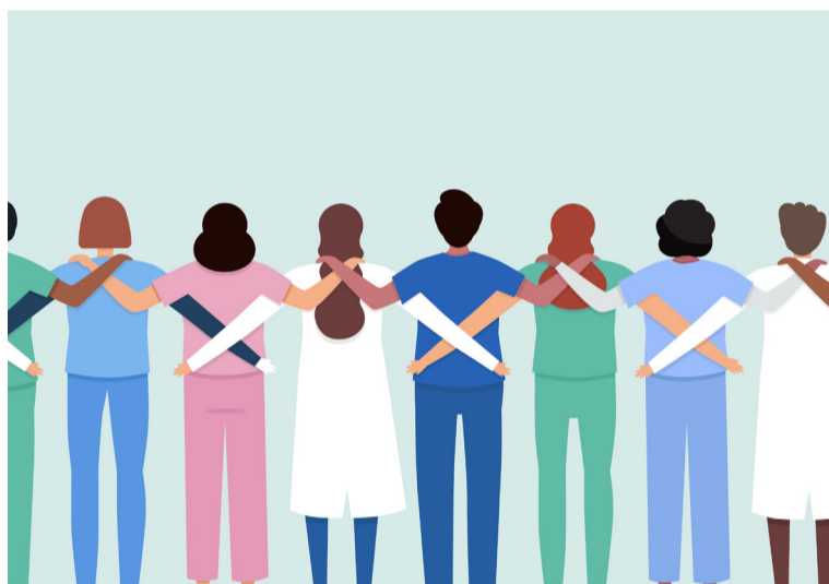
La Organización Mundial de la Salud apuesta por el trabajo de las enfermeras

También busca compartir conocimientos, colaborar y aprender de líderes en estos ámbitos. Esta comunidad ofrece foros de debate, clases magistrales o seminarios con expertos sobre temas de interés para estas profesiones.