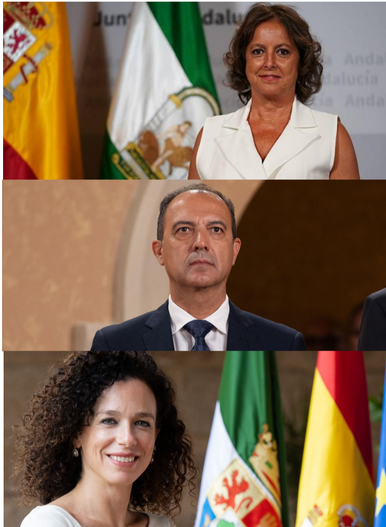
Los consejeros de Andalucía, Aragón y Extremadura (De arriba a abajo)

Es el caso de las direcciones, subdirecciones generales o gerencias. También se ha experimentado un incremento en los últimos años, el cual SATSE valora positivamente y confía en que vaya a más. ■