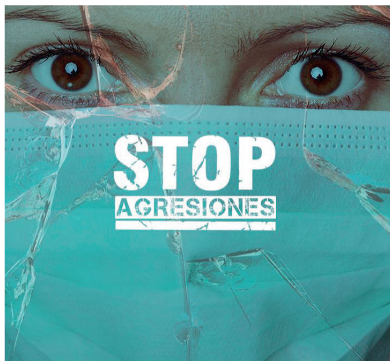
Imagen de la campaña permanente de SATSE contra las agresiones a profesionales

Otros resultados de esta encuesta son que la pandemia del Covid-19, a pesar de la positiva valoración pública general del esfuerzo y dedicación de las enfermeras y enfermeros, no ha supuesto un mayor respeto hacia estos profesionales, como así lo demuestra que casi 7 de cada diez hayan sido agredidos en los dos últimos años.