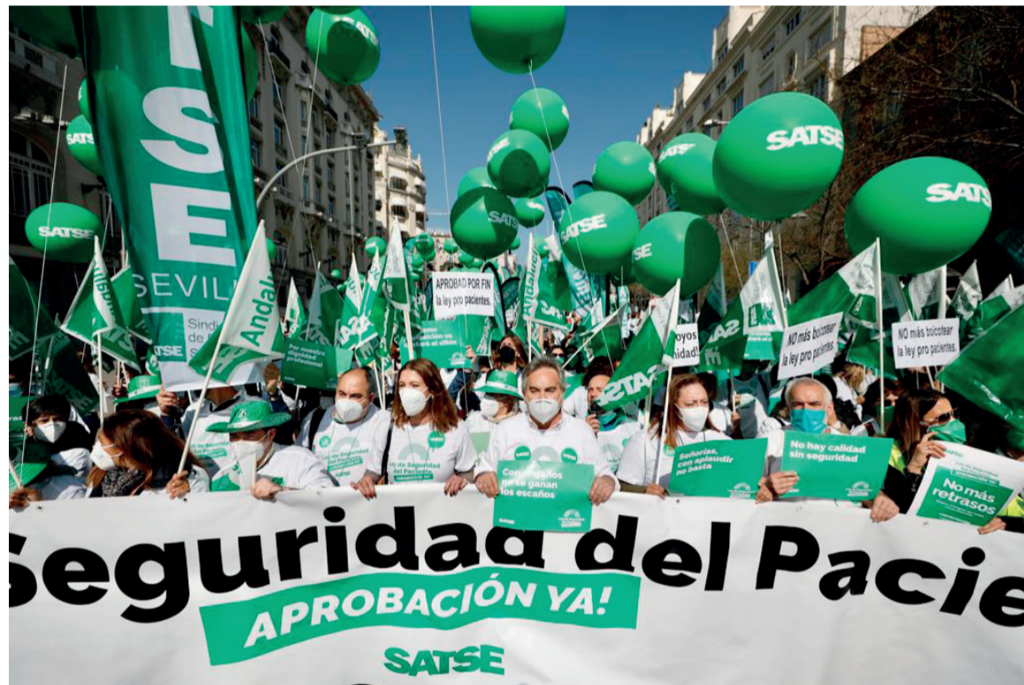
El malestar e indignación de las enfermeras y enfermeros, protagonistas de la concentración impulsada por SATSE

En la actualidad, ya han transcurrido dos años y cinco meses desde que la Ley de Seguridad del Paciente entró en el Congreso de los Diputados y 16 meses desde que fue tomada en consideración con el respaldo casi unánime de todos los partidos (312 votos a favor y solo 10 en contra).