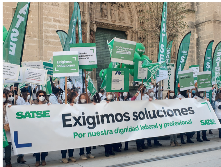
Protesta reciente de SATSE frente al SAS para lograr mejoras laborales y retributivas

En concreto, el Sindicato de Enfermería explica que el acuerdo incluye un incremento en las retribuciones de 150 euros brutos al mes, en catorce pagas anuales, en concepto de Complemento Específico para enfermeras/os, enfermeros/as especialistas y fisioterapeutas de Atención Hospitalaria, tanto de los puestos