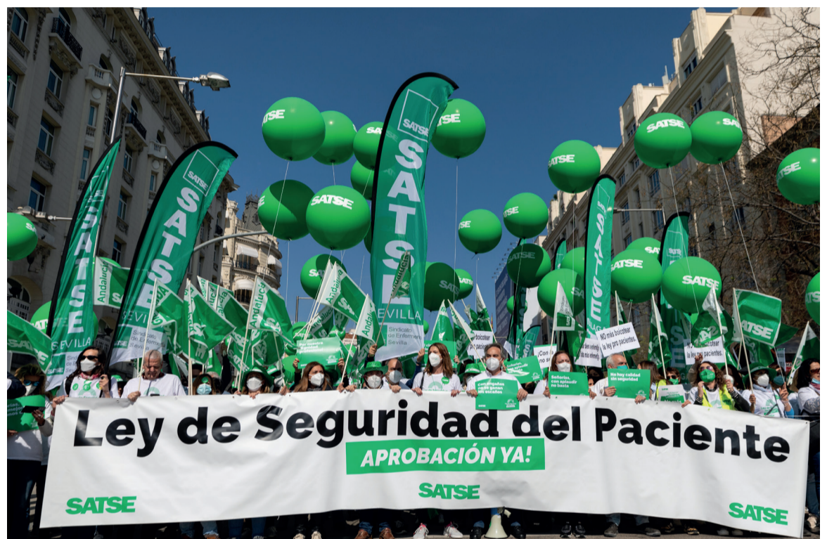
Cabecera de la concentración impulsada por SATSE, con la pancarta "Ley de Seguridad del Paciente, aprobación ya"

"Algunos representantes políticos son como los globos, que se insuflan de promesas y compromisos y finalmente se desinflan sin haber cumplido ni una sola palabra", criticaron los manifestantes, los cuales aseguraron que no cejarán en su empeño de que el Congreso de los Diputados cumpla con la voluntad de las cerca de 700.000 personas que apoyaron esta Ley y llegue a ser