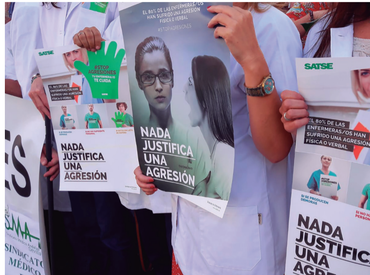
Las agresiones siguen afectando especialmente a las enfermeras y enfermeros

Ha sido finalmente el PP el que ha decidido presentar una Proposición de Ley al respecto en la