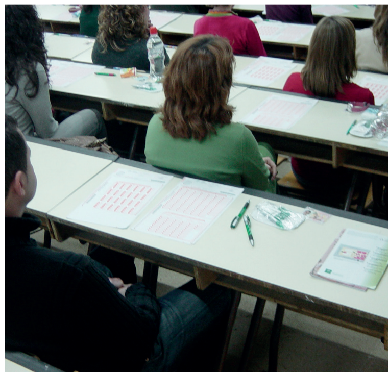
Imagen de archivo de un examen de una OPE de Enfermería

Además de incorporar algún ajuste en el baremo respecto a procesos anteriores, en esta convocatoria se reducirá la nota de corte para superar el examen específico de la fase de oposición