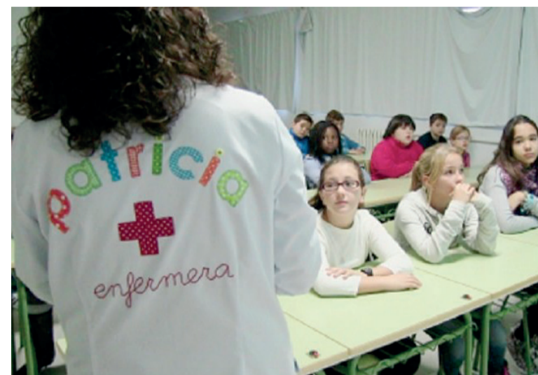
SATSE denuncia la precariedad de las enfermeras escolares ceutíes

El sindicato advierte que ha ganado varias sentencias que reconocen el recargo de prestaciones de las enfermeras contagiadas por covid porque no le