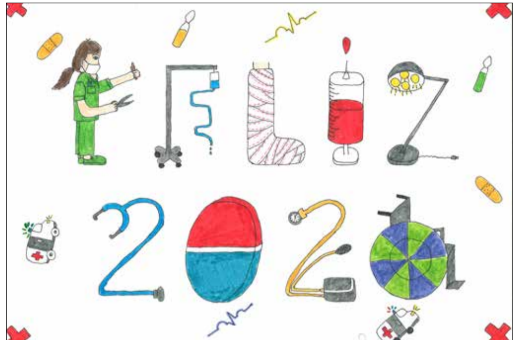
Elsa Mulet Giner (Alcañiz-Teruel) 10 años

Por ello, desde SATSE queremos agradecer a todos los participantes su dibujo y esperamos seguir contando con ellos en próximas ediciones. ¡Feliz Navidad!