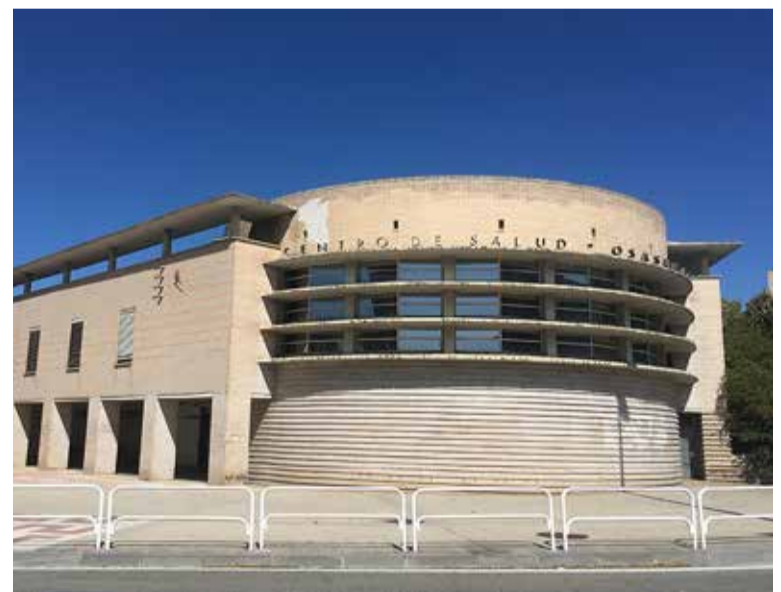
Imagen del Centro de Salud de Ermitagaña en Pamplona

Para ellos, explican desde SATSE Navarra, deben deman-