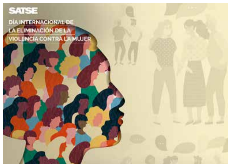
SATSE ha mostrado sus compromisos con la lucha contra la violencia de género

El Sindicato de Enfermería considera que, pese a los avances experimentados para acabar con las situaciones de discriminación por razón de género, aún resulta muy necesario ir "a la raíz del problema" e impulsar la educación y formación en igualdad, tanto en la población en general