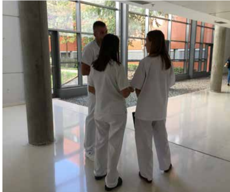
SATSE ha abordado con la Consejería las principales reivindicaciones

SATSE ha exigido la creación de un itinerario laboral para las enfermeras, que "se hace necesario tanto por el tipo de trabajo de