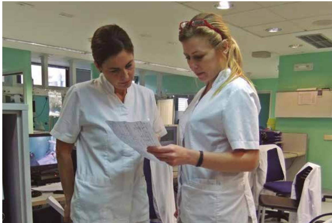
SATSE reclama al Gobierno que acabe con la discriminación entre unos profesionales y otros

De igual manera, le ha solicitado que esta posible nueva clasificación profesional dentro de la función pública no sea costeada con el dinero procedente del recorte salarial que estos profesionales llevan sufriendo desde 2010, como ha propuesto ya alguna otra organización.