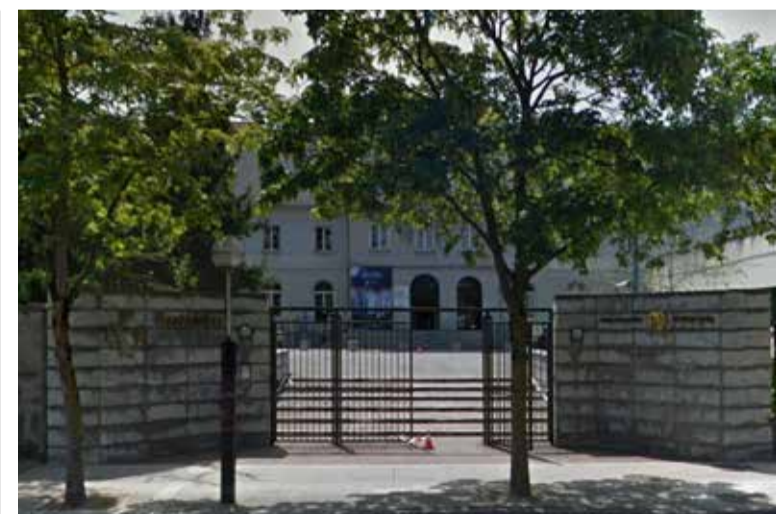
La movilidad de la plantilla de Osakidetza es un tema prioritario para SATSE

"La movilidad es un tema prioritario para el Sindicato de Enfermería". Por eso, el sindicato se opuso abiertamente a que Osakidetza estableciera requisitos específicos desconocidos en este tipo de procesos, por considerar que generan opacidad y falta de