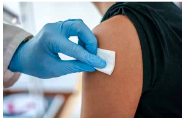
SATSE ha denunciado la precariedad de las plantillas enfermeras

"No es normal, indican, que durante los meses de la Campaña de la Gripe se dedique menos tiempo a programas de tratamiento y prevención de enfermedades, por el simple hecho de que tengan que dedicar una buena parte de su jornada a la vacunación. Los grandes perjudicados, añaden, son los usuarios que tendrán menos accesibilidad a estos programas de salud