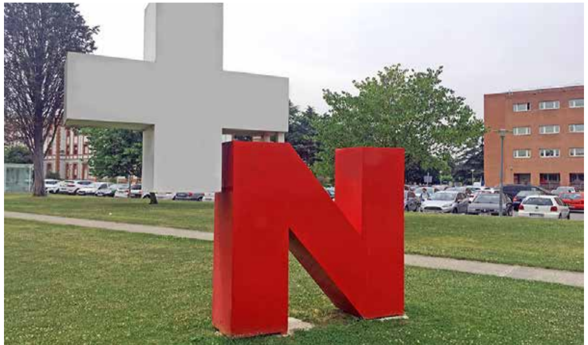
Los datos incluidos en el estudio no reflejan la realidad retributiva de los profesionales de Enfermería de Navarra

Para SATSE Navarra este informe muestra también erróneos, y se basa en ellos para determinar que los profesionales de Enfermería de Navarra ocupan el primer puesto retributivo a nivel es-