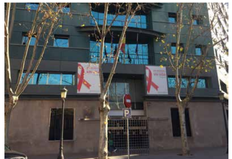
Fachada de la Conselleria de Sanidad

Por último, el Sindicato de Enfermería de la Comunidad Valenciana quiere que se retome, cuanto antes, la negociación del nuevo baremo que afectará a estos concurso-oposición,