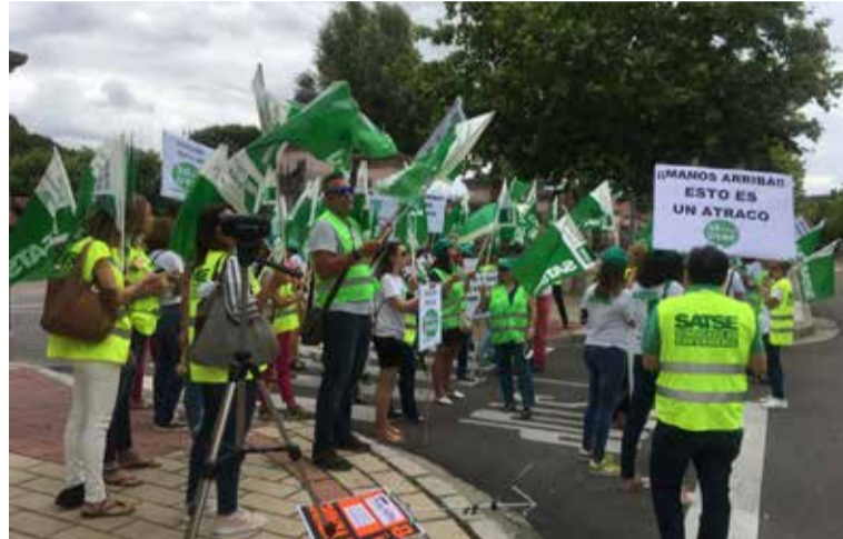
Concentración de SATSE exigiendo la implantación de las 35 horas semanales

SATSE respondió así al acuerdo entre la Junta y otras organizaciones sindicales puntualizando