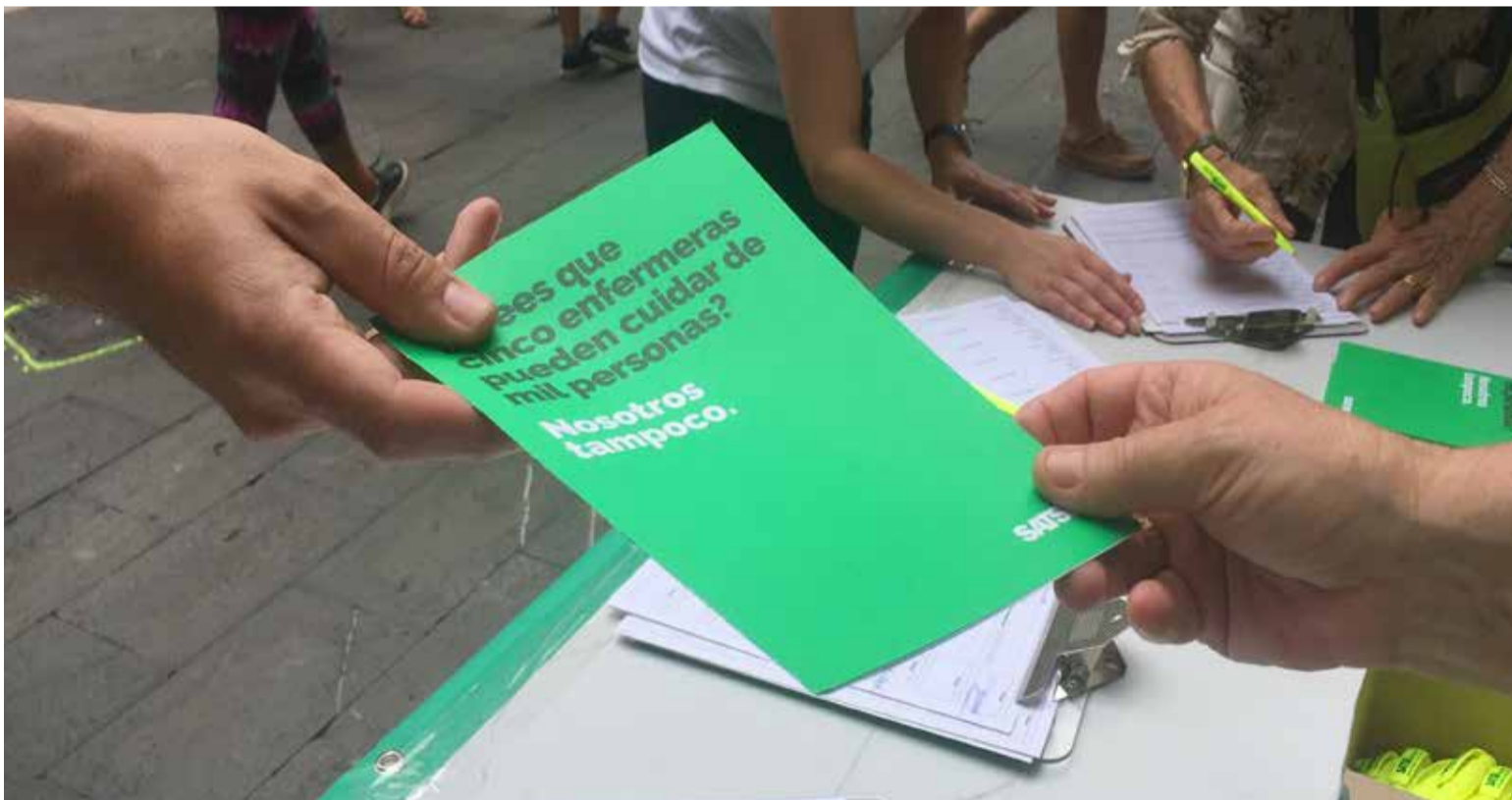
Miles de ciudadanos han apoyado a SATSE en su intención de que se garantice por Ley en España la seguridad del paciente

La recogida de firmas se incluye dentro de las acciones previstas en la campaña 'La Sanidad que merecemos. Ley de ratio enfermeras', que el Sindicato está desarrollando en los últimos meses para informar y sensibilizar sobre la necesidad de contar con una ratio adecuada de enfermeras y enfermeros en España. ■