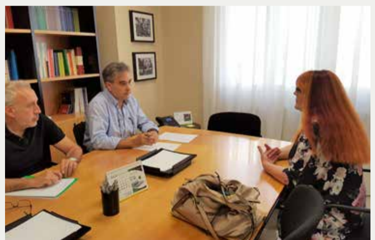
Reunión con la Asociación Nacional de Personas con Epilepsia-ANPE

a todos los servicios de salud y que conlleva que no haya tampoco igualdad de condiciones a la hora de recibir la atención sanitaria y cuidados que se merece cualquier persona.