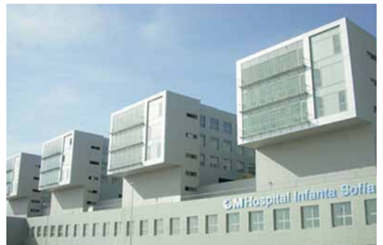
Los sindicatos del Hospital Infanta Sofía han reclamado el cese de la gerente

La actitud de la directora de Enfermería no sólo no mejoró sino que empeoró los años siguientes, ante la inacción de la gerente del centro que no hizo nada por