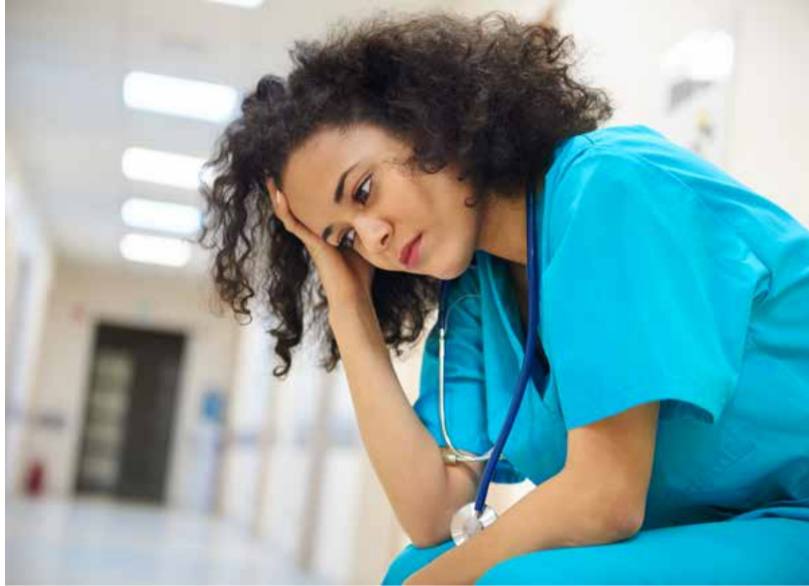
El síndrome del profesional quemado afecta especialmente a las enfermeras y enfermeros

Según SATSE, la decisión adoptada por la OMS es un importante paso adelante en el reconocimiento a nivel mundial de una enfermedad que afecta a la salud y calidad de vida de los profesionales afectados, así como a las