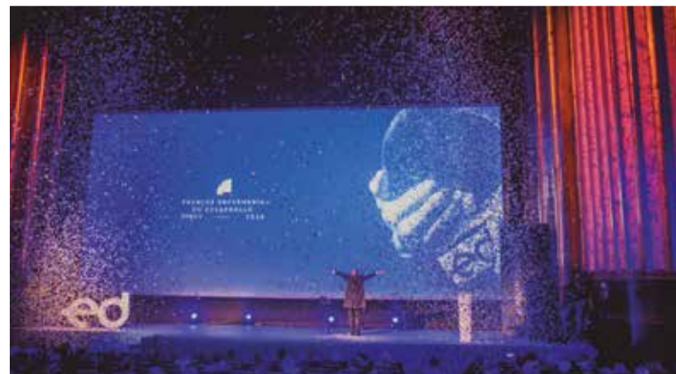
El mago Valmont fue uno de los protagonistas de la entrega de los Premios ED18

Los premios están dirigidos a todos los profesionales, colectivos e instituciones vinculados con la Enfermería: enfermeras, enfermeras especialistas, fisio-