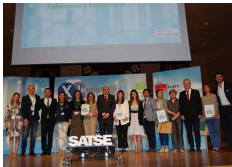
Foto de familia de los premiados en esta undécima edición de los premios

Además, se celebraron cuatro mesas redondas en las que se expusieron los 20 trabajos de investigación seleccionados por el Comité Científico, lo que permitió conocer las investigaciones que