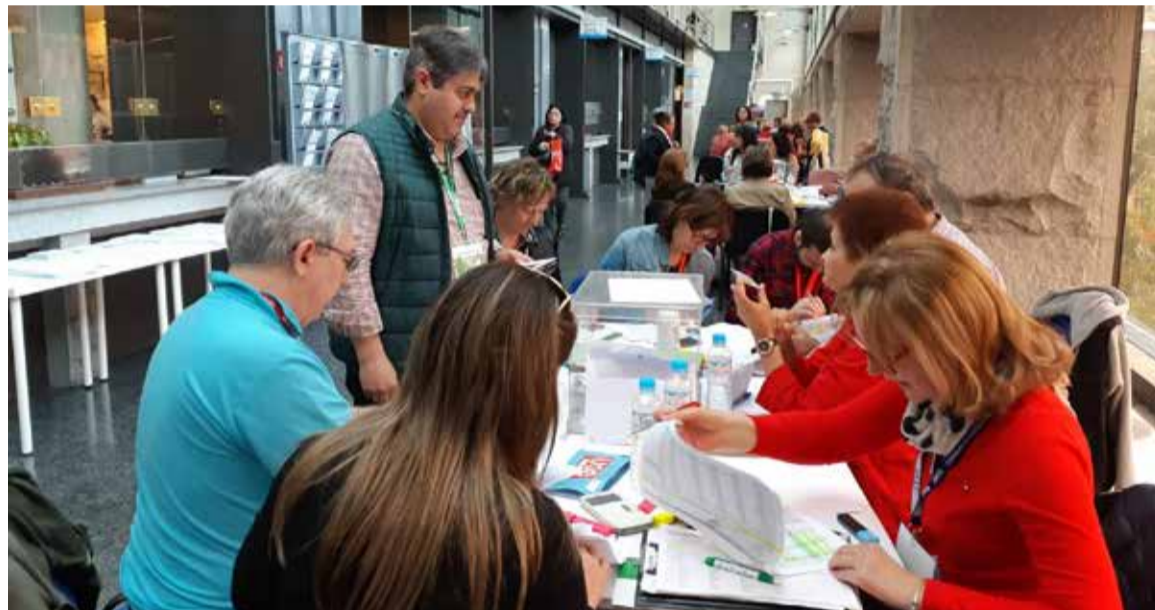
El apoyo de los profesionales en las elecciones se ha traducido en una mayor representación en las mesas de negociación

Según SATSE, este incremento en el apoyo de los profesionales en las elecciones se traduce en una mayor representatividad de SATSE en los órganos y mesas de negociación para defender con más legitimidad y fuerza las demandas de los enfermeros, enfermeras y fisioterapeutas.