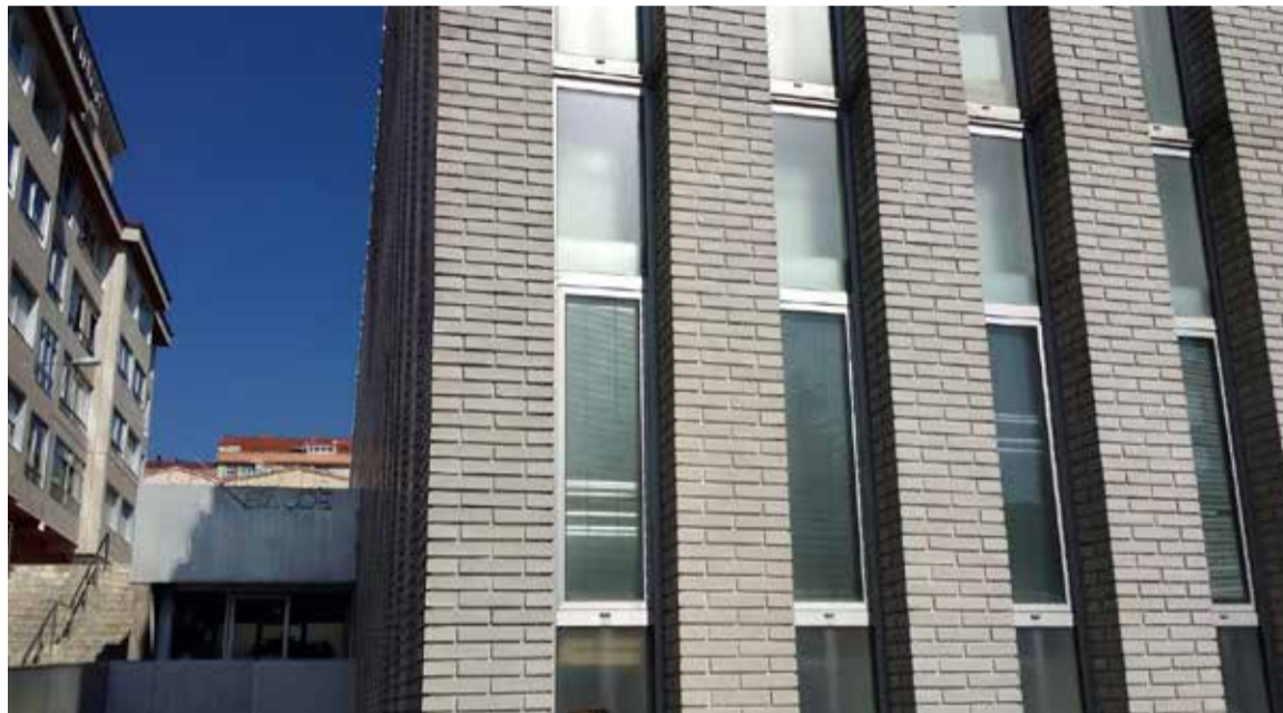
Fachada del Centro de Salud de Coia en el Área de Vigo

Otra cuestión importante es que, esta medida carece de apoyo normativo pues se está implantando en los centros de Atención Primaria del área mediante reuniones informativas, pero sin estar avalada por una resolución al efecto por parte del Sergas, Consellería de Sanidade o Gerencia. De igual forma, denuncian las profesionales de Enfermería y el Sindicato que no se dispone de un protocolo a seguir, tal y como