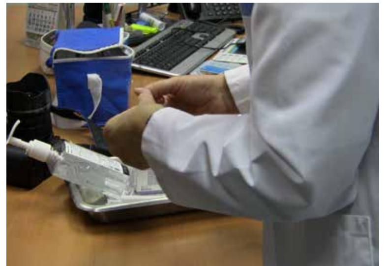
SATSE se opone a la amortización por los perjuicios que podrían derivarse

Cinco años después de ese Decreto, y al cierre de esta edición, el concurso de traslados seguía sin convocarse, y ya no es sólo que se esté limitando la posibilidad de movilidad de los enfermeros funcionarios -el último concurso de traslados se hizo en 2008-, sino que ahora, Sacyl pretende amortizar las plazas de enfermeros/as funcionarios vacantes en los últimos meses, y que no estaban incluidas en el Plan de reestructuración. ■