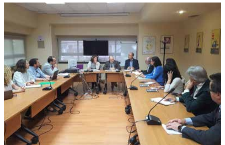
Momento de la reunión con el director general del INSST

La reunión con el responsable del INSST, organismo depen-