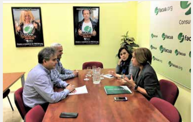
Reunión con FACUA- Consumidores en Acción

SATSE quiere agradecer el apoyo manifestado por estas asociaciones y destaca su sensibilidad hacia un problema que, en la actualidad, está afectando