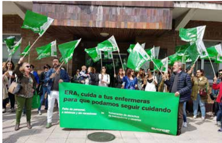
A la concentración acudieron cientos de profesionales de Enfermería del ERA

Cerca de un centenar de trabajadores, respaldados por representantes de los colectivos de familiares de residentes, participaron en la protesta, que contó con otras concentraciones de