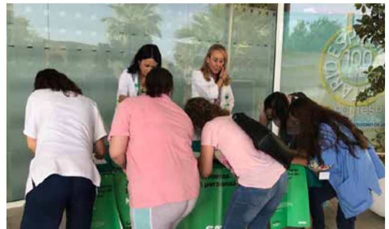
Miles de personas se han sumado ya a la campaña "La Sanidad que merecemos. Ley de ratios enfermeras" impulsada por SATSE

a través de esta Ley, y cerca de nueve de cada diez cree que el hecho de que solo haya cinco enfermeras y enfermeros por 1.000 habitantes en España afecta negativamente a la calidad de la asistencia que reciben y conlleva más riesgos de sufrir complicaciones, errores involuntarios de los profesionales o demoras en la asistencia, entre otras consecuencias.