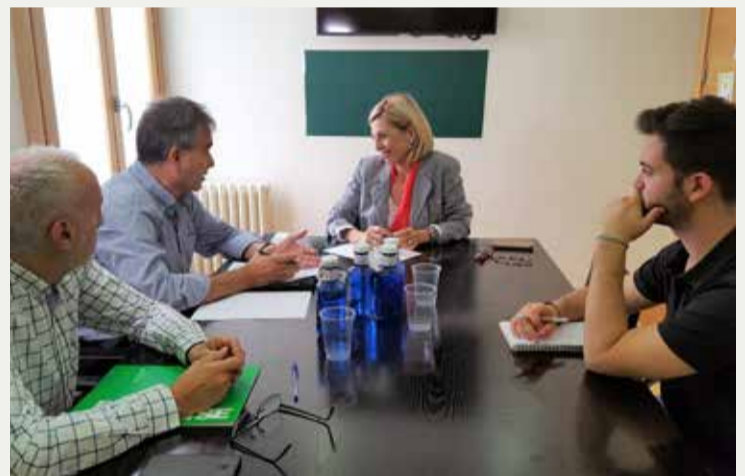
Reunión con la Federación Nacional de Enfermos y Trasplantados hepáticos