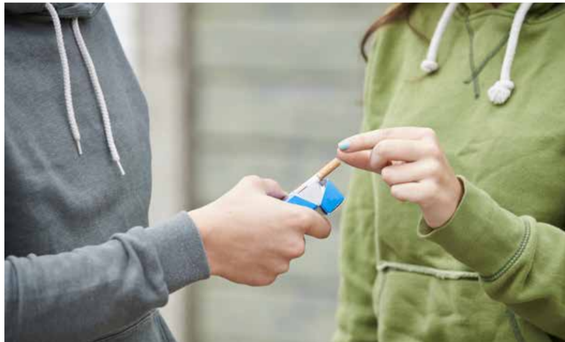
La presencia de una enfermera escolar supondría un gran avance para sensibilizar sobre los efectos negativos del tabaco

Por ello, desde la Plataforma se recalca que la implantación generalizada de la figura de la