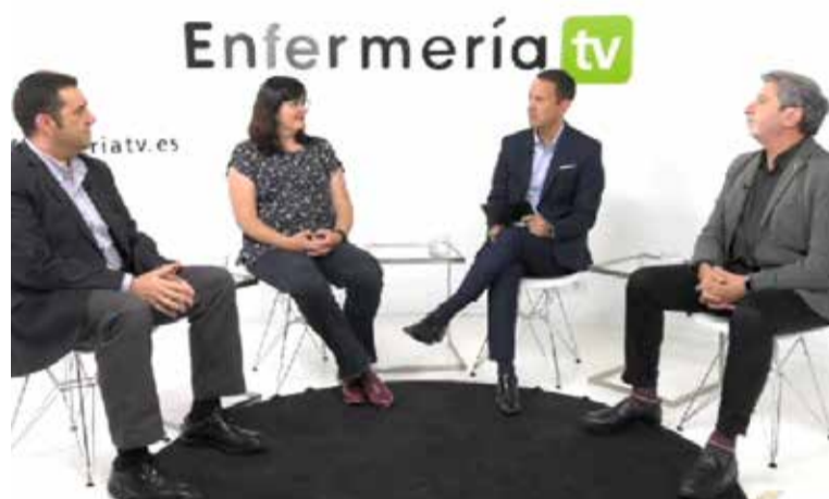
Un momento del debate en 'Actualidad Enfermera'

'Actualidad Enfermera', el programa de debate de Enfermería tv ha abordado las consecuencias de la atención sanitaria en la seguridad del paciente, centrándose en las debilidades y fortalezas de nuestro sistema sanitario al respecto.