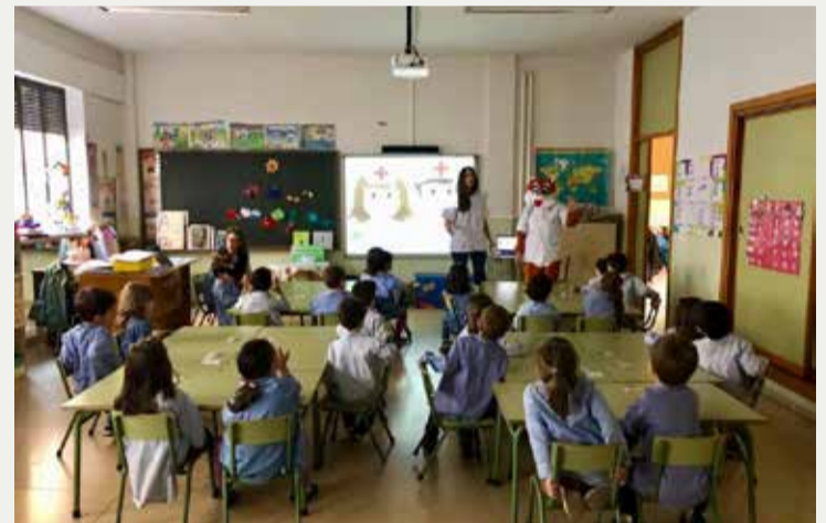
Talleres en CyL enseñaron a los más pequeños la importancia de la Enfermería