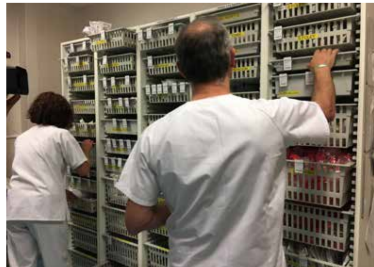
SATSE critica la tardanza en publicar el decreto que regula las guardias localizadas

Además, estas guardias estaban reguladas por una orden ministerial que establecía que solo podían realizarse en determinados servicios hospitalarios. A partir de ahora, los hospitales pueden solicitarlas a la Gerencia Regional de Sacyl cuando exista una necesidad justificada. ■