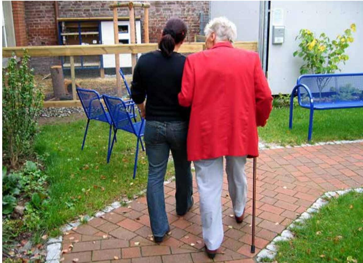
Las condiciones laborales de las enfermeras y enfermeros que trabajan en residencias de mayores son especialmente difíciles

Esta cifra se supera en muchas autonomías, resultando las peor paradas Madrid, con un máximo de 261 pacientes por enfermera/o; Castilla y León, con 225, y Extremadura, con un máximo de 204 pacientes por profesio-