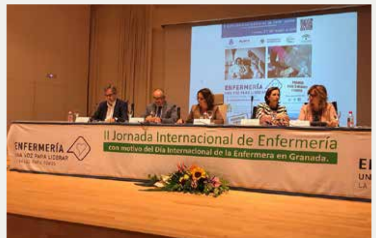
Jornadas profesionales centraron la conmemoración del DIE en Granada

un 61 por ciento finalizar las actividades que deben realizar en su turno de trabajo y más de un 55 por ciento asegura que prolonga su jornada laboral para poder finalizarlas.