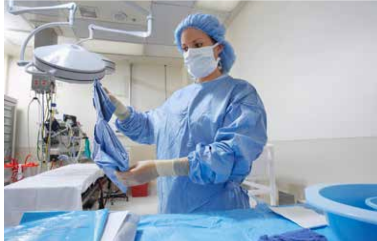
SATSE se ha sumado, un año más, al Día Internacional de los Trabajadores

"Llevamos ya varios años escuchando a nuestros responsables públicos que hemos salido del túnel y que nuestra economía crece por encima de la de otros muchos países, pero nuestros trabajadores continúan pagando por una crisis que no provocaron y que les supuso numerosas