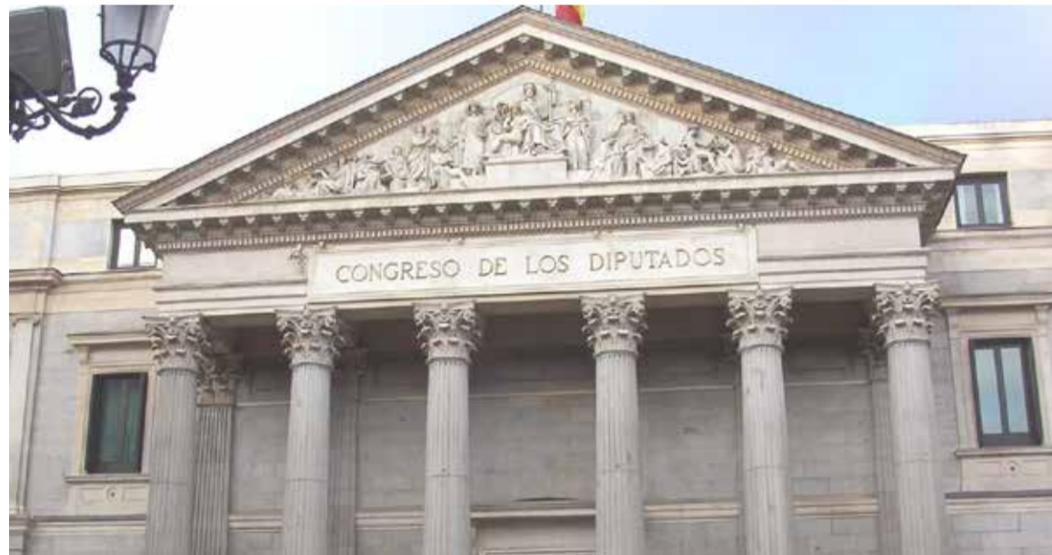
SATSE pide a los grupos políticos en el Congreso y Senado que trabajen por la mejora de la sanidad y sus profesionales

Tres normas que considera fundamentales para mejorar la atención sanitaria a los ciudadanos y las condiciones laborales y pro-