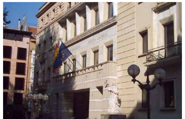
Fachada del Tribunal Superior de Justicia del País Vasco

SATSE Euskadi ganó, en enero de 2019, una Sentencia en reclamación del derecho de esta enfermera a ver reconocido el riesgo para el embarazo. La mutua