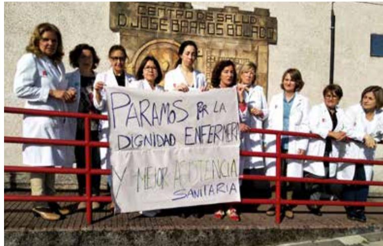
Enfermeras cántabras, en paro, reclaman una mayor dignidad para la profesión

Con esta jornada de paro convocada por SATSE se buscaba denunciar las diferencias de condiciones laborales y condiciones retributivas entre las distintas categorías de profesionales dentro del Servicio Cántabro de Salud. "Las enfermeras, matronas y fisioterapeutas son tan profesio-