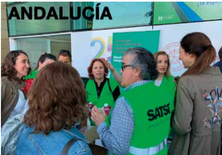
Todas las provincias pusieron en marcha dispositivos de asesoramiento y apoyo