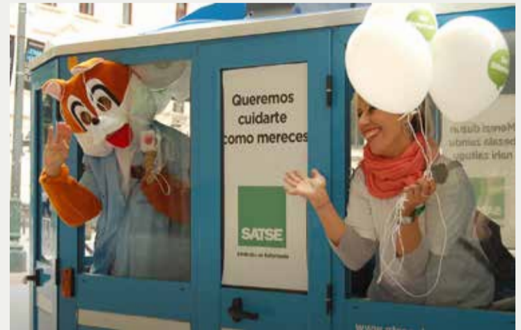
El tren turístico de Bilbao visibilizó la labor de las enfermeras y enfermeros

De igual manera, la actual sobrecarga asistencial a la que se ven sometidos impide a más de