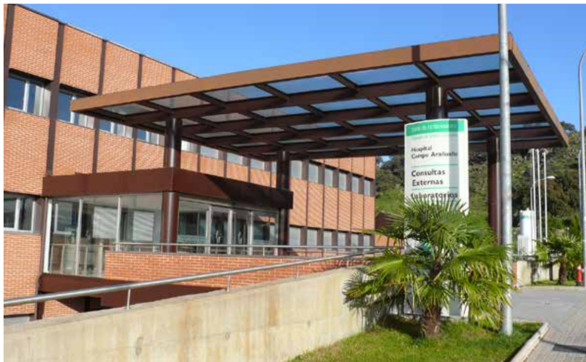
Imagen exterior del Hospital Campo Arañuelo, en Navalmoral de la Mata

Al igual que la Inspección de Trabajo, SATSE considera que el SES, y en concreto, el director de Recursos Humanos del Área de Salud de Navalmoral de la Mata, ha mostrado una actitud "totalmente discriminatoria" ha-