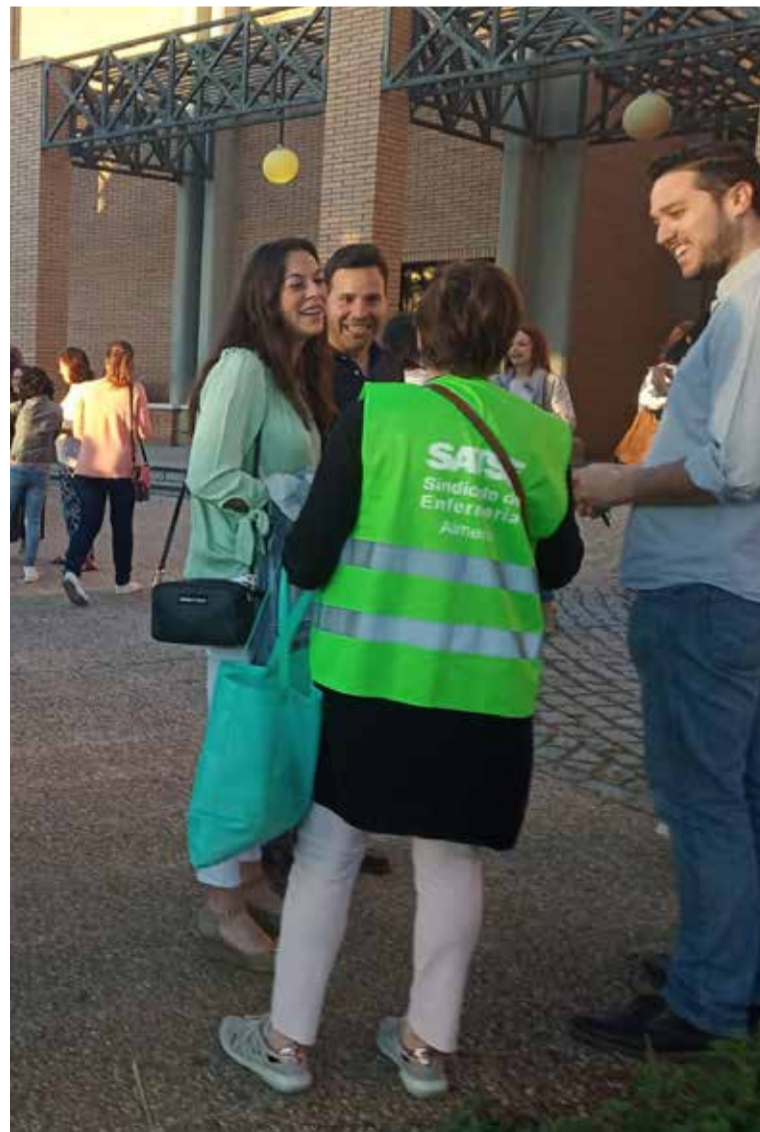
Los delegados de SATSE acompañaron a los miles de aspirantes para solventar sus dudas y ayudarles en todo lo que requiriesen a la hora de hacer la prueba

Por ello, la organización sindical ha pedido la modificación del Estatuto Marco del Personal Estatutario para que se establezca una convocatoria cada dos años, al menos, de un concurso-oposición y que se regule que los concursos de traslados se realicen mediante concurso abierto y permanente. ■