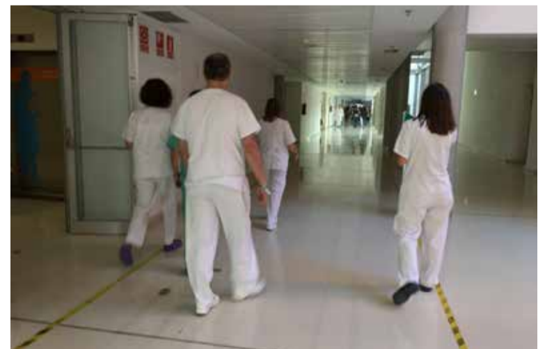
SATSE ha denunciado numerosas irregularidades en la bolsa de empleo

Sacyl se vio obligado a abrir un listado supletorio de candidatos por orden de inscripción, sin baremar, en el que no se tienen en cuenta ni la experiencia ni la formación de los integrantes del listado. SATSE denunció "irregularidades" en las contrataciones, como que no se solicite el título original a los aspirantes y sirva con una fotocopia, así como que los servicios de contratación "se saltan la normativa de funcionamiento en cuestiones como el orden de llamamiento, al aplicar