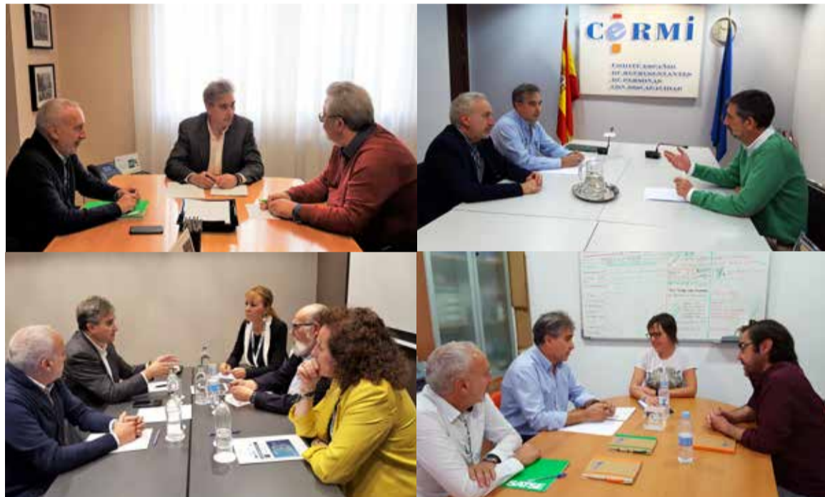
De izquierda a derecha, SATSE con representantes de UESCE, Cermi, Fenaer y la Federación Española de Fibrosis Quística.

Tras lograr el respaldo del Comité Español de Representantes de Personas con Discapacidad, CERMI, la Federación Española de Asociaciones de Pacientes Alérgicos y con Enfermedades Respiratorias, FENAER, la Federación Española de Fibrosis Quística y la Unión Española de Sociedades Científicas de Enfermería (UESCE), también se han mostrado partidarios de regular el número necesario de enfermeras y enfermeros en cada hospital, centro de salud y otros centros sanitarios y sociosanitarios de nuestro país.