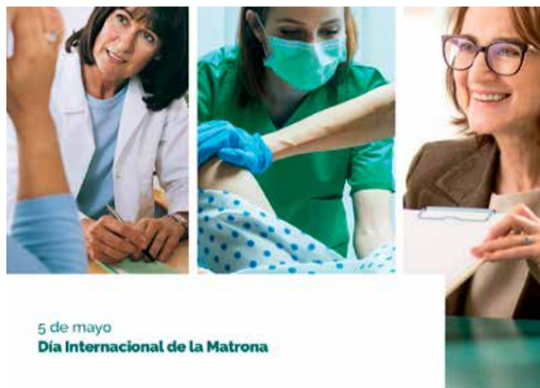
Cartel de SATSE con motivo del Día Internacional de la Matrona 2019

En la actualidad, España cuenta con un número claramente insuficiente de especialistas en Enfermería Obstétrico-Ginecológica. Según el estudio