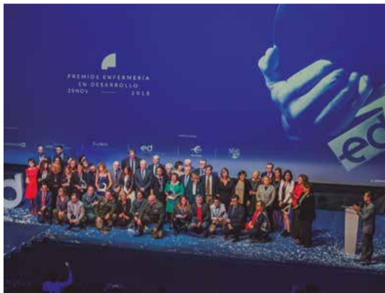
Foto de familia de los últimos premios Enfermería en Desarrollo

Los premios están dirigidos a todos los profesionales, colectivos e instituciones que tienen algún tipo de vinculación con la Enfermería o la Fisioterapia: enfermeras, enfermeras especialistas, fisioterapeutas, estudiantes de cualquiera de las disciplinas anteriores, asociaciones de pacientes o profesionales, colegios profesionales, asociaciones científicas, facultades, centros de Atención Primaria, sociosanitaria y Atención Hospitalaria, direcciones de Enfermería, colectivos sociales y otras instituciones