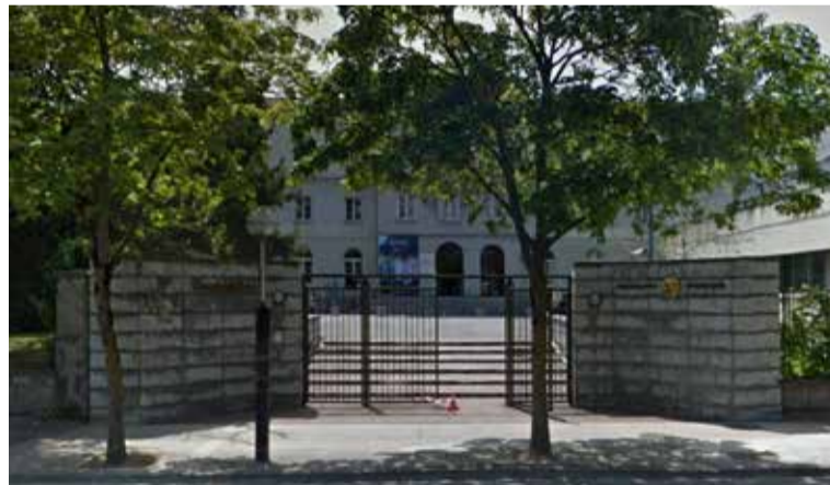
SATSE ha pedido a Osakidetza que respete los compromisos adquiridos

En la reunión mantenida por SATSE con la directiva del Servicio Vasco de Salud, donde también ha estado presente el