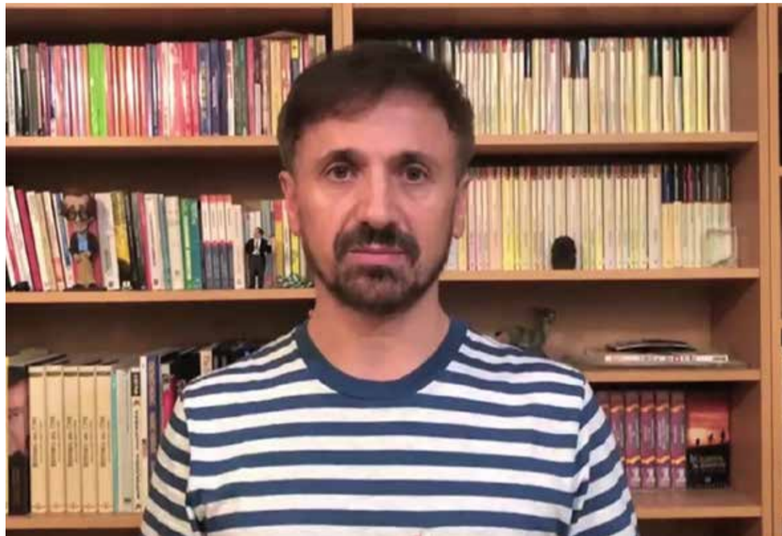
El conocido actor y humorista, José Mota, es una de las personalidades que ya se ha sumado a la campaña de SATSE

El actor y humorista José Mota, el deportista paralímpico, David Casinos, el mago e ilusionista Jorge Blass o el ganador de dos premios de la Academia de Cine española, Emilio Gutiérrez Caba, han hecho ya público su apoyo a la campaña "La Sanidad