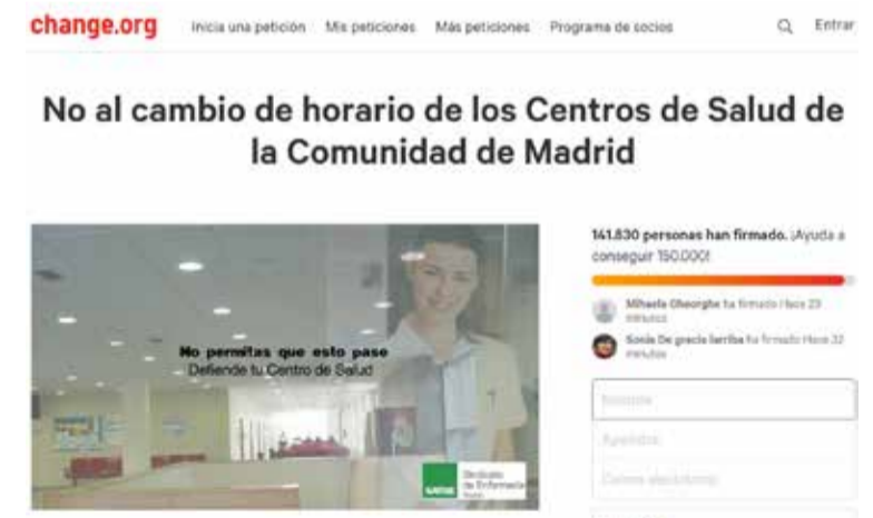
La petición en change.org ha sumado hasta la fecha más de 141.000 apoyos