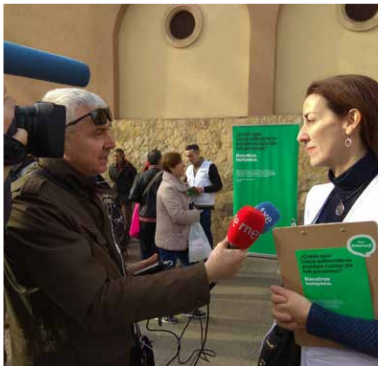
Los medios de comunicación se están haciendo notable eco de la campaña