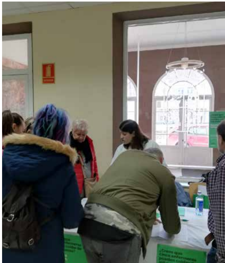
Las mesas informativas de SATSE siguen recabando firmas en todo el Estado

Desde el pasado mes de octubre, cientos de delegados de SATSE están informando y recabando firmas en los centros sanitarios y en las calles de numerosas ciudades españolas.