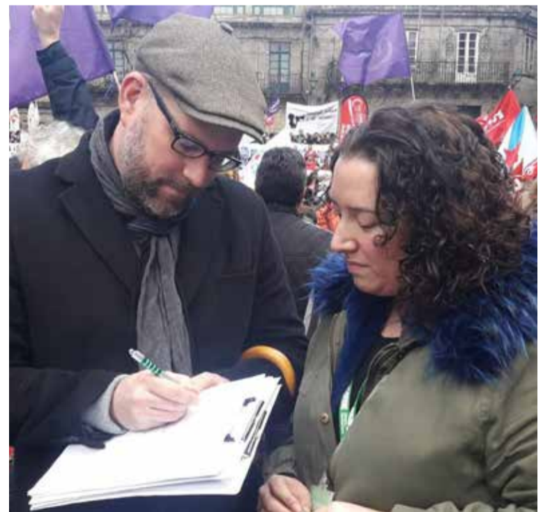
El alcalde de Santiago es una de las autoridades que ha firmado la ILP de ratios

Todo ello con el objetivo de sensibilizar al mayor número posible de profesionales y ciudadanos sobre el problema de déficit de plantillas existente y lograr las 500.000 firmas necesarias para que la Iniciativa Legislativa Popular puede debatirse en unos meses en el Congreso de los Diputados.