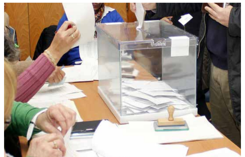
La distribución de las mesas no ofrecerá cobertura a todos los profesionales

Ambas organizaciones sindicales presentarán, conjuntamente, una propuesta alternativa de