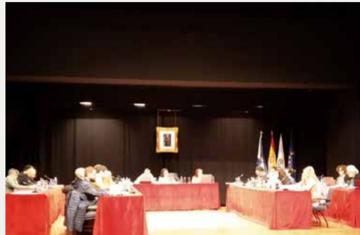
Momento del debate de la moción propuesta por el Sindicato de Enfermería en el Pleno del Ayuntamiento de Pontevedra

En las mociones se insiste en la necesidad de que cualquier ciudadano reciba la misma atención y cuidados, independientemente del lugar en el que resida, ya que, en la actualidad, cada servicio de salud establece el número de enfermeras en función de crite-