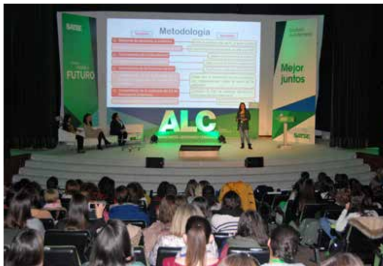
Un momento del Congreso de Investigación organizado por SATSE Toledo

Durante la inauguración, a cargo del director general de