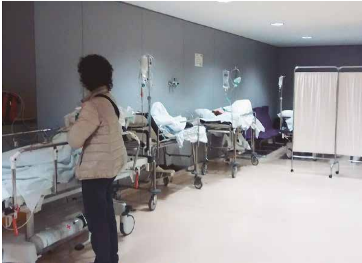
Los pacientes y las enfermeras y enfermeros han vuelto a sufrir la mala planificación de los servicios de salud ante la gripe

La organización sindical reitera que los servicios de salud saben perfectamente que la llegada de la gripe conllevará un importante aumento de personas que acudirán a los servicios de Urgencias para ser atendidos y, salvo contadas excepciones, hasta que éstas