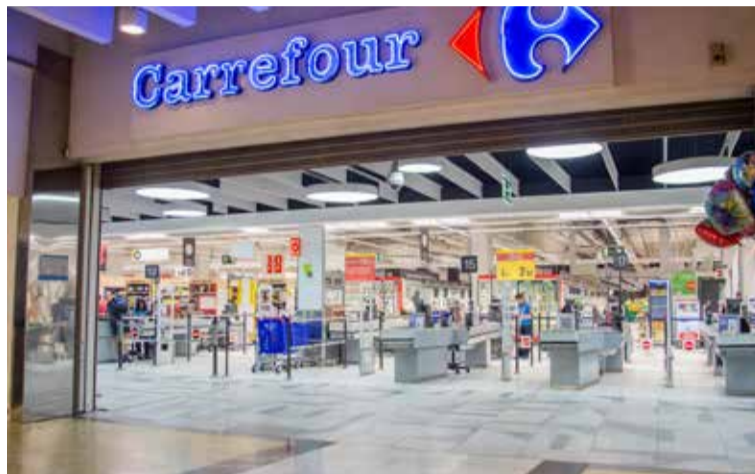
SATSE logra que Carrefour se comprometa a no vender disfraces de enfermera sexy

nuncia de los reiterados casos de difusión de imágenes y mensajes que atentan contra la dignidad de las mujeres enfermeras, SATSE propuso hace más de un año al Ministerio de Sanidad la creación de un Observatorio de la Mujer en el ámbito sanitario que trabaje para acabar con la utilización de estos estereotipos sexistas y denigrantes e, incluso, llegó a recabar más de 10.000 firmas con este objetivo.