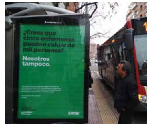
Un viandante contempla el cartel de la campaña de la ILP de ratios enfermeras, en Logroño

De igual manera, se han elaborado más de 200.000 carteles con el mismo mensaje de la campaña y se han pegado en numerosos hospitales y centros de salud.