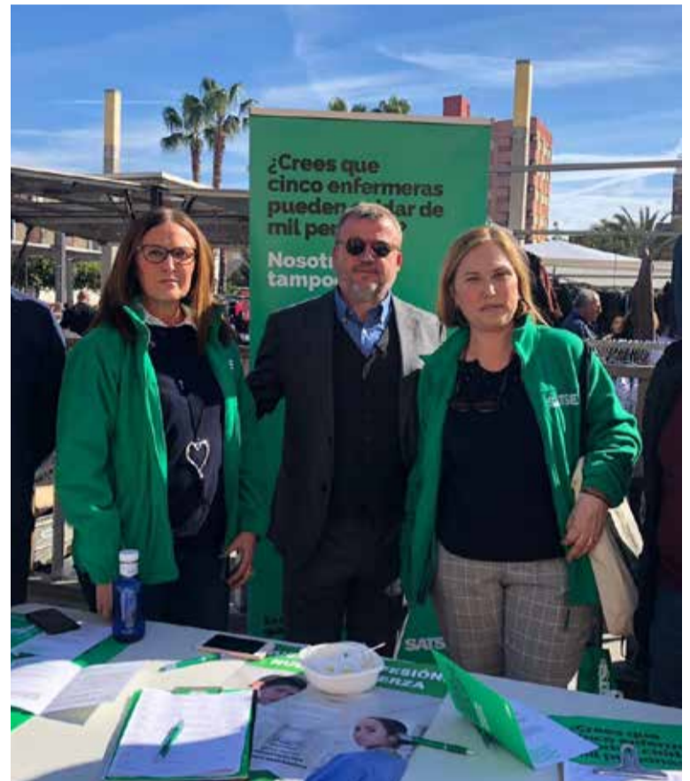
El primer edil de Sagunto (Valencia) ha respaldado la Iniciativa Legislativa Popular