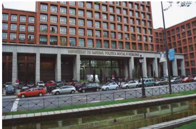
Imagen de la fachada del Ministerio de Sanidad

A juicio de SATSE, es absolutamente insuficiente que, del total de 20 vocales en la sección de Sanidad, solo se haya designado a una enfermera y, por ello, ha reclamado a la ministra que se