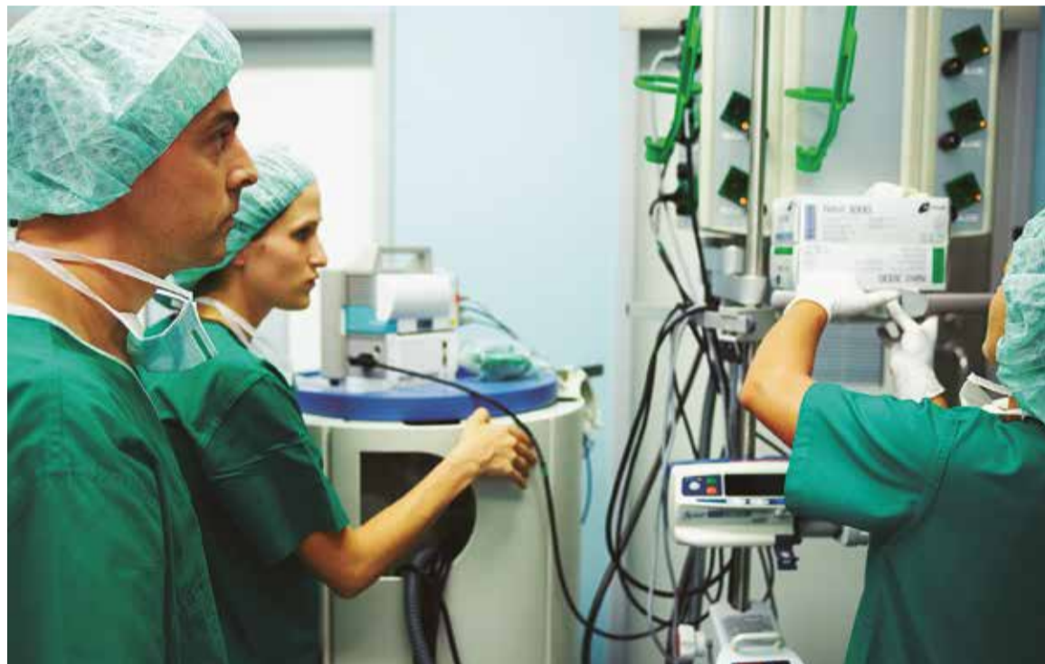
SATSE ha denunciado la falta de profesionales de Enfermería tanto en Atención Primaria como Especializada.

Por su parte, las enfermeras y enfermeros que trabajan en los centros de salud tienen una población asignada que llega hasta las 1.900 personas, lo que supone una excesiva sobrecarga de trabajo.