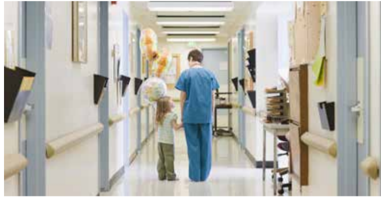
Las enfermeras y enfermeros sufren condiciones laborales especialmente penosas

SATSE recalca que, después de agravarse las condiciones laborales de las enfermeras y enfermeros que trabajan en los centros hospitalarios durante los años de crisis, los distintos servicios de salud "no han movido ni solo un dedo" para compensar de manera justa las penosas condiciones laborales de un colectivo profesional cuyo salario base es de unos 1.000 euros al mes.