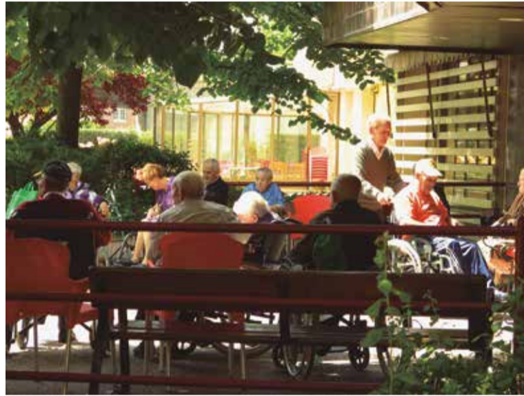
SATSE ha denunciado la situación de las enfermeras de Servicios Sociales

La sentencia del TSJCYL argumenta lo establecido en varias sentencias del mismo Tribunal