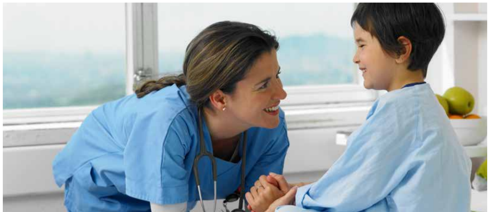
SATSE denuncia la falta de un enfoque de género en las actuales políticas sanitarias en España

Pese a que la esperanza de vida es superior en las mujeres, éstas presentan peor salud a lo largo de la misma. La fibromialgia, las anemias, el dolor crónico, las enfermedades autoinmunes o endocrinológicas, la osteoporosis... son dolencias crónicas