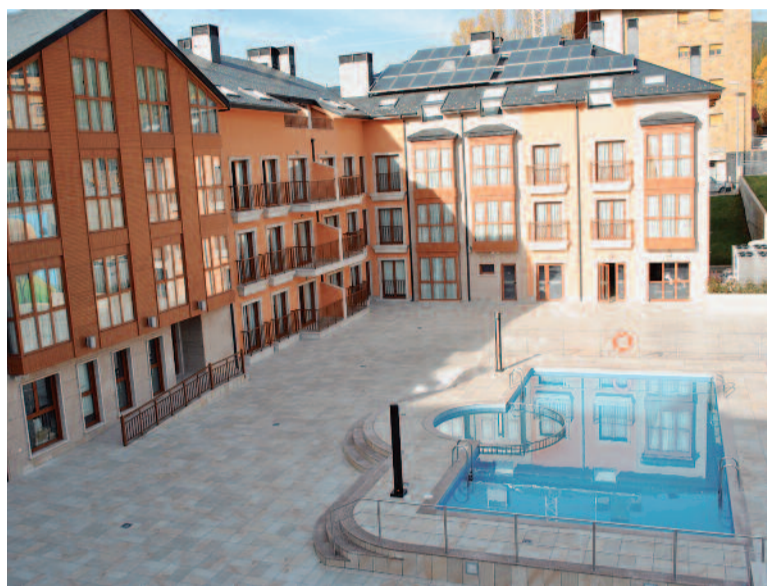
Panorámica del complejo turístico situado en la localidad oscense de Jaca

A lo largo de estos dos días también se debatirá sobre el liderazgo, la innovación o el emprendimiento de la profesión en tiempos difíciles. El Congreso incluye