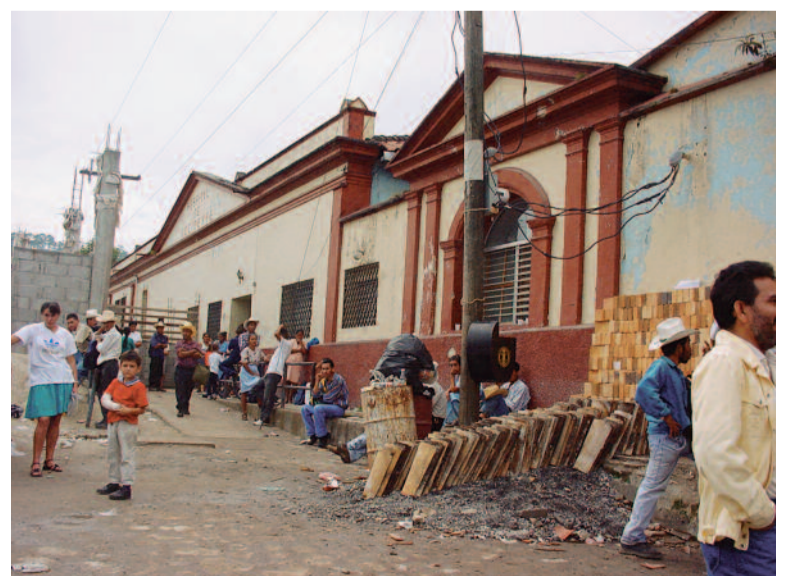
La escasez de profesionales puede provocar graves problemas asistenciales

Además, en un mercado laboral globalizado, el aumento de la demanda está impulsando la migración y la movilidad entre el personal sanitario. De hecho, la contratación de trabajadores de la salud en el extranjero puede parecer una forma de satisfacer la demanda interna, pero, según los expertos, a largo plazo “empeora la escasez de personal cualificado”. ●