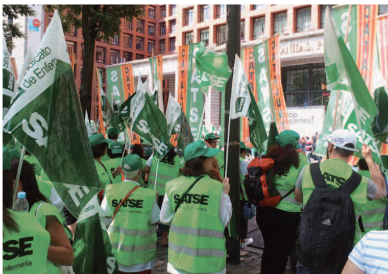
Las protestas en el sector sanitario han aumentado considerablemente

Por Comunidades, es Euskadi la que mayor número de huelgas acumuló a lo largo de 2012, con 247, seguida de Madrid (109) y Cataluña. La autonomía con menos conflictividad fueron las Ci-