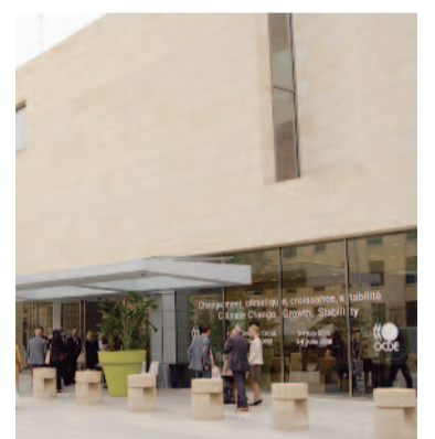
Sede de la OCDE

Hasta diciembre de 2012, un total de 50.201 españoles emigraron durante 2012 a Alemania en busca de trabajo, según concretó la Agencia Federal de Empleo alemana. Otros 9.271 españoles aparecían registrados como de-