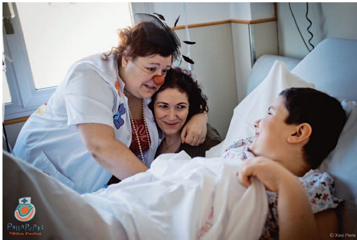
Payasos y familiares colaboran en la salud de los ingresados

Los payasos de esta ONG no visitan de forma aleatoria los centros hospitalarios, lo hacen a demanda y antes de “ponerse la