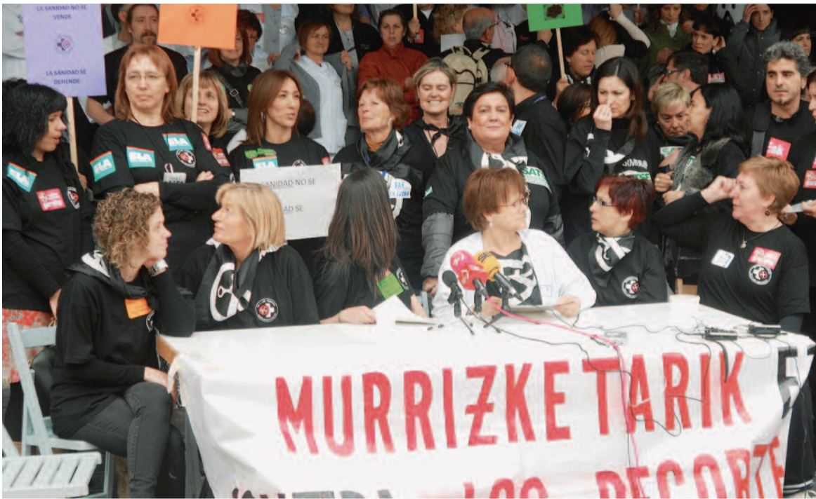
Profesionales del Hospital de Txagorritxu, en Álava

► Hay 120.000 empleados públicos y de ellos sólo 15.000, la mayor parte enfermería, que se van a ver afectados por estas medidas ► SATSE propugna buscar fórmulas lo menos lesivas posible para los intereses de la profesión