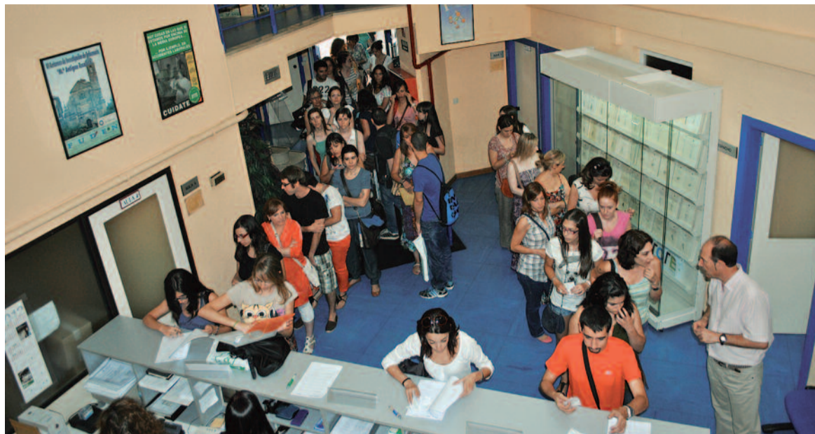
Han sido numerosos los profesionales inscritos en este programa

Fisioterapeutas y especialistas en Obstetricia-Ginecología y