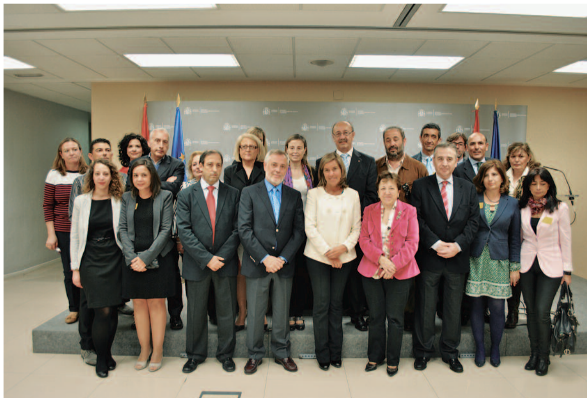
Foto de familia con la ministra de Sanidad y el presidente de SATSE en el centro

En su intervención, el presidente de SATSE rechazó el creciente paro en enfermería, que llega ya a casi 20.000 personas, e indicó que la organización sindical cen-