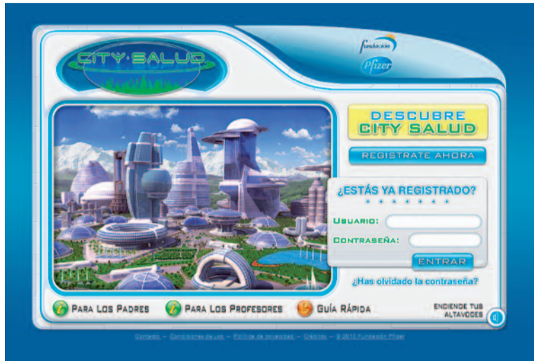
Una forma interactiva de aprender hábitos saludables

De forma interactiva, los participantes crean un personaje, cuya apariencia puede modificarse, que debe recorrer 58 escenarios de una ciudad futura recopi-