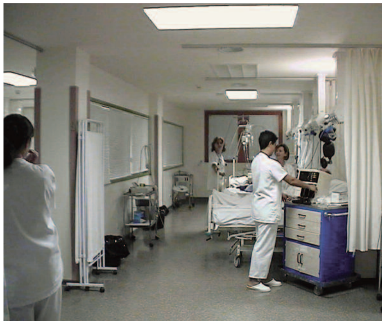
La planificación de recursos humanos es esencial

A pesar de esto desde el Sindicato se han remitido nuevas