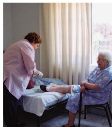
[PÁG. 6] Enfermera atendiendo a una paciente

crónicos, el papel esencial que deben ocupar los profesionales de enfermería y la necesidad de hacer más atractivo el sector, mediante la mejora de sus condiciones.