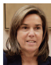
Ana Mato Ministra de Sanidad

Vamos a profundizar en tres áreas que ambas partes entendemos como trascendentes: Un Pacto por la Sanidad, que tiene por objeto contribuir a la definición de elementos y posibles bases para la sostenibilidad del SNS desde la perspectiva de la enfermería. Igualmente, un grupo de Recursos Humanos, orientado a la definición de criterios que se consideran adecuados para avanzar en el desarrollo profesional enfermero y, por último, el área de Gestión Clínica, fundamental para participar y compartir tareas en los procesos asistenciales.