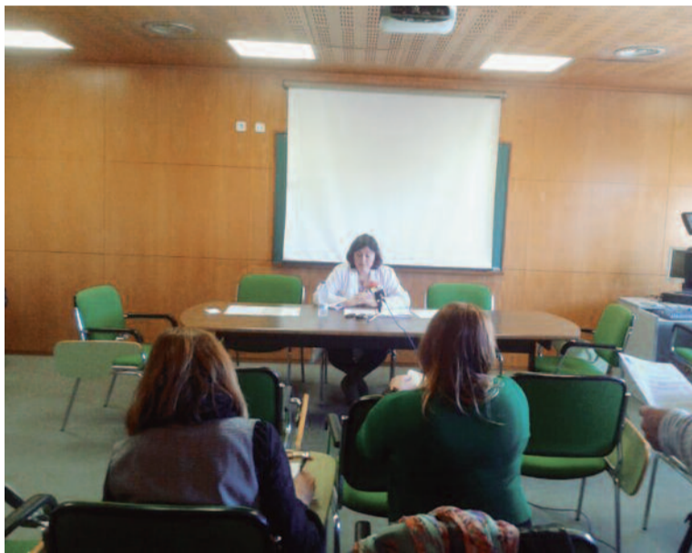
Imagen de la rueda de prensa donde se denunció la actitud de la administración

El Sindicato de Enfermería denuncia el calvario por el que están pasando estas dos matronas para mantener la asistencia sanitaria de calidad en la isla: