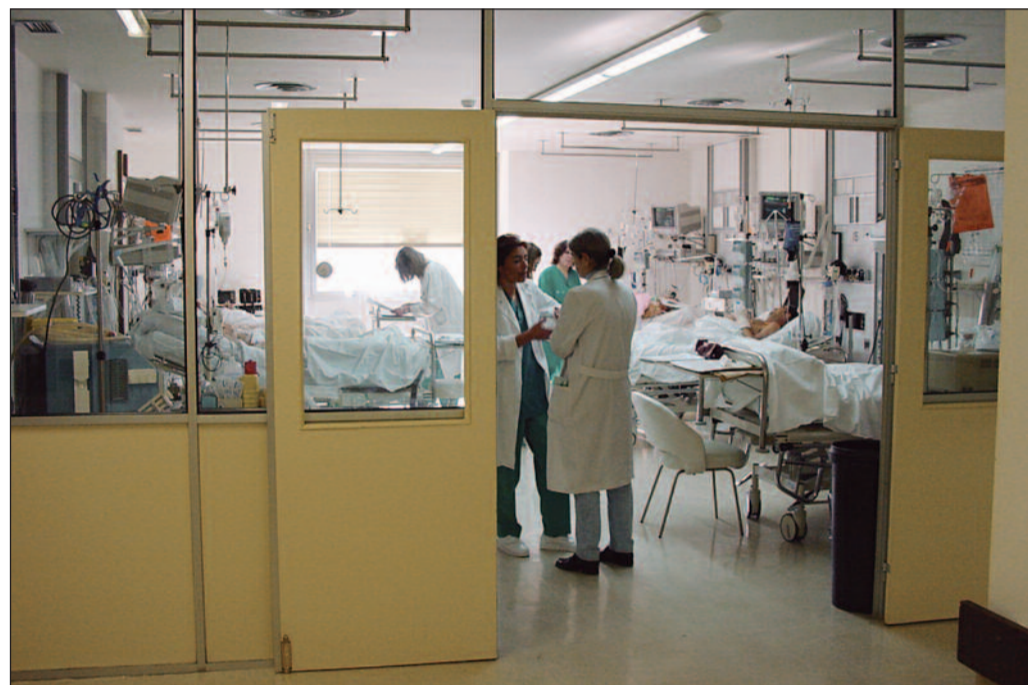
El tamaño de la UCI y la experiencia incide en el conocimiento de las técnicas

Para ello se diseñó un cuestionario que contemplaba cuestiones como la vía recomendada para la intubación, la frecuencia de cambio de los circuitos del respirador, los tipos de humidificadores y su frecuencia de cambio, los sistemas de aspiración y su