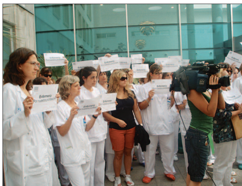
La falta de enfermería está incidiendo, negativamente, en la capacidad de conciliar

Estas situaciones se ven agravadas en los últimos tiempos por los recortes de personal que se están llevando a cabo desde la práctica totalidad de las administraciones públicas y privadas "que están produciendo desprogramaciones -cambios de horarios sin previo aviso- lo que está provocan-