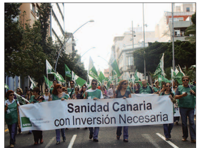
SATSE seguirá luchando por los derechos de la enfermería

cretario Autonómico del Sindicato de Enfermería que opina que lo que deben hacer tanto Lopera como Querol es "ponerse en la piel de los que tienen que sufrir las esperas, que padecen el resto de ciudadanos ceutíes cuando necesitan ir al hospital o al centro de salud y de los trabajadores que con su sobre esfuerzo hacen que las carencias de nuestra sanidad no se noten tanto".