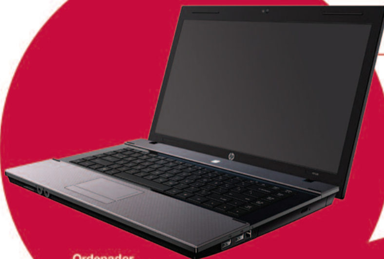
Ordenador portátil HP 620