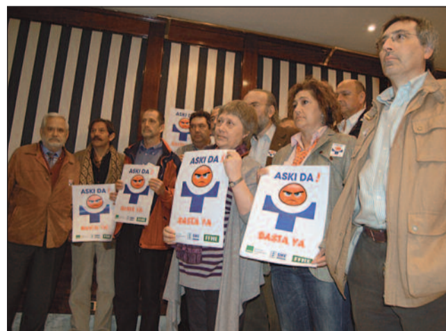
El Sindicato denunció en rueda de prensa la situación de Osakidetza

El Sindicato de Enfermería ha denunciado la situación interna de Osakidetza como de auténtica desorganización. Para SATSE, el Servicio Vasco de Salud, SVS, no cuenta con la opinión de sus profesionales ni de sus representantes legales, que se en-