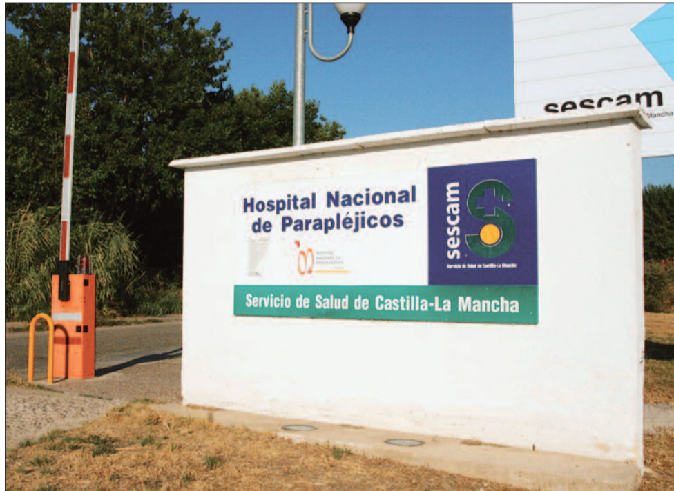
Acceso al Hospital Nacional de Parapléjicos, en Toledo

Entre esas propuestas, el Sindicato de Enfermería de Toledo incluye realizar un estudio cualitativo sobre el turno rotatorio para conocer en profundidad cómo afecta a los profesionales de enfermería, dimensionar las plantillas adecuadamente lo que conseguiría reducir el estrés, mejorar la satisfacción de los profesionales y, a la vez, mejorar la calidad, la satisfacción y la seguridad del paciente. Aumentar la formación continuada de los profesionales o introducir mecanismos para que la enfermería participe en la toma de decisiones que vayan dirigidas a mejorar la calidad de la asistencia y la seguridad del paciente son