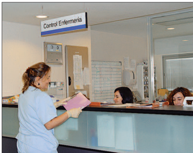
El Sindicato de Enfermería pide que los profesionales puedan compaginar su vida laboral y familiar