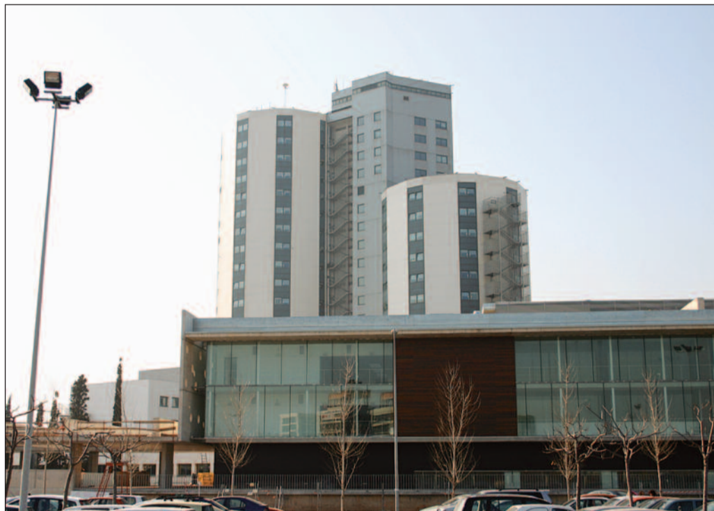
El Hospital de Bellvitge, en Barcelona, ha sido denunciado por el Sindicato de Enfermería

El fallo también da la razón al Sindicato de Enfermería, ya que afirma que en la visita efectuada al archivo, la inspección de Trabajo comprobó que "hay material que dificulta el acceso a los estantes de almacenamiento de las historias clínicas" y que "hay una falta clara de espacio para el almacenaje". Por esta