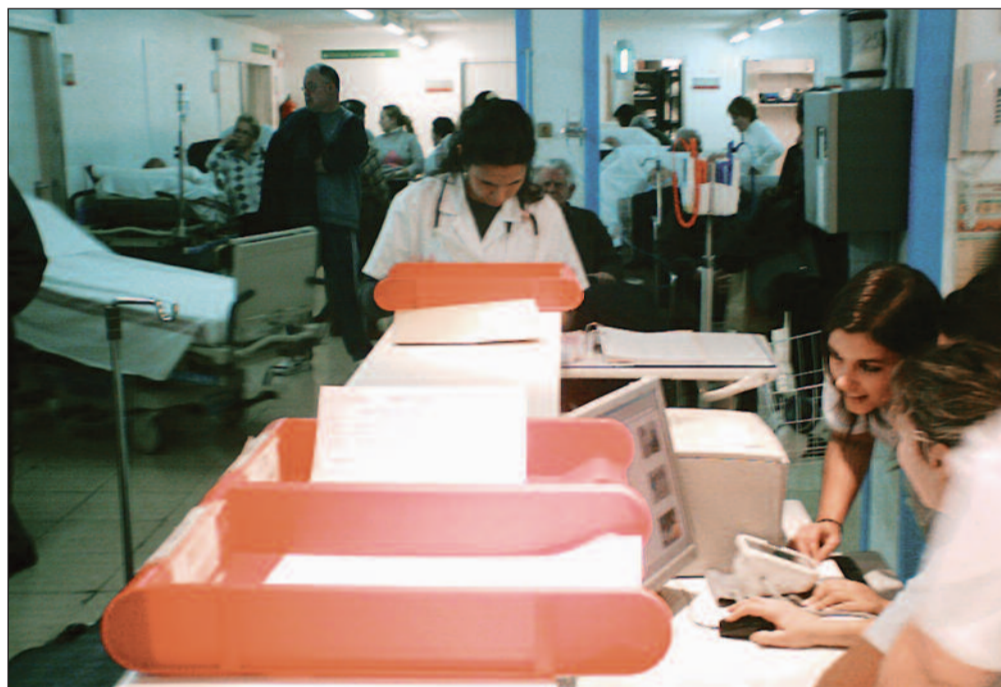
Trabajar con sobrecarga es habitual: Urgencias del Hospital de Bellvitge durante la época de gripe

sencia en las mesas de negociación. SATSE, se presenta a estas elecciones "con ánimo de representar al colectivo y conseguir que no se empeore más todavía su situación".