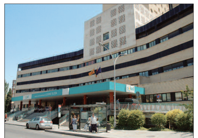
CEMSATSE es la única opción para los profesionales de enfermería

CEMSATSE cuenta con el apoyo de los profesionales,