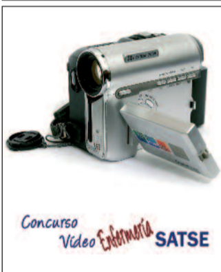
SATSE ha abierto el plazo de sus concursos

el 17 de octubre, está abierto a afiliados, afiliados-jubilados y estudiantes adheridos a SATSE. La temática deberá girar en torno a la videoformación, educación para la salud, cooperación enferme-