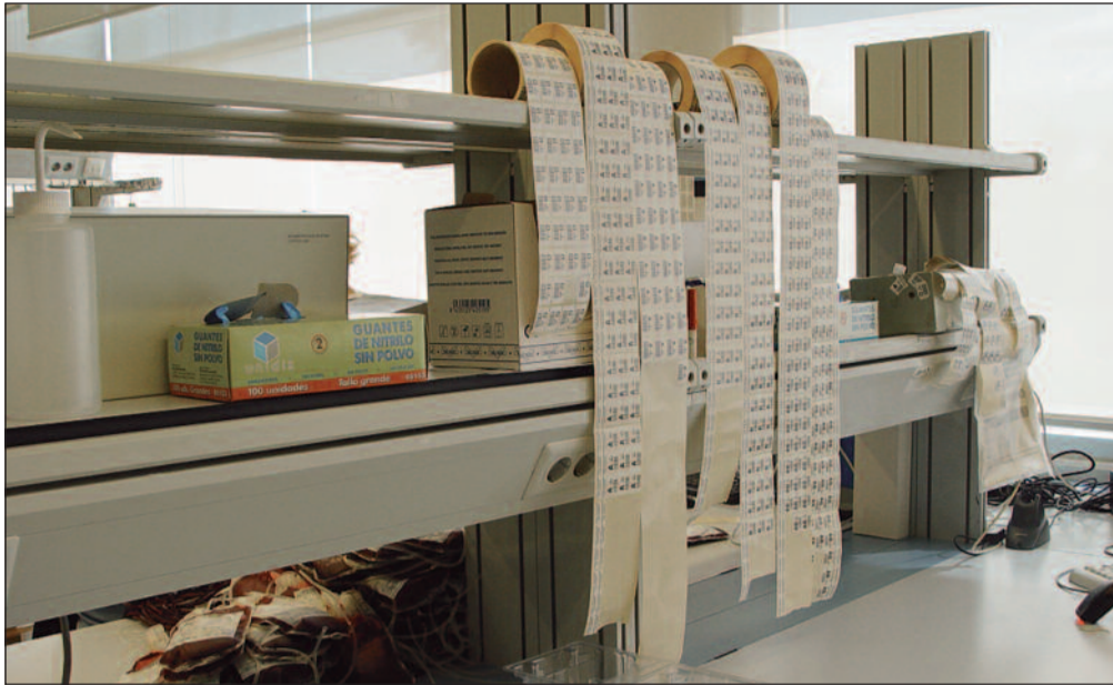
El Sindicato advierte de la pérdida de donaciones de sangre