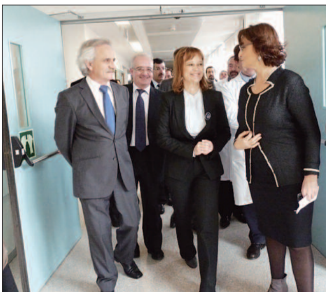
La ministra Pajín durante la visita al Hospital