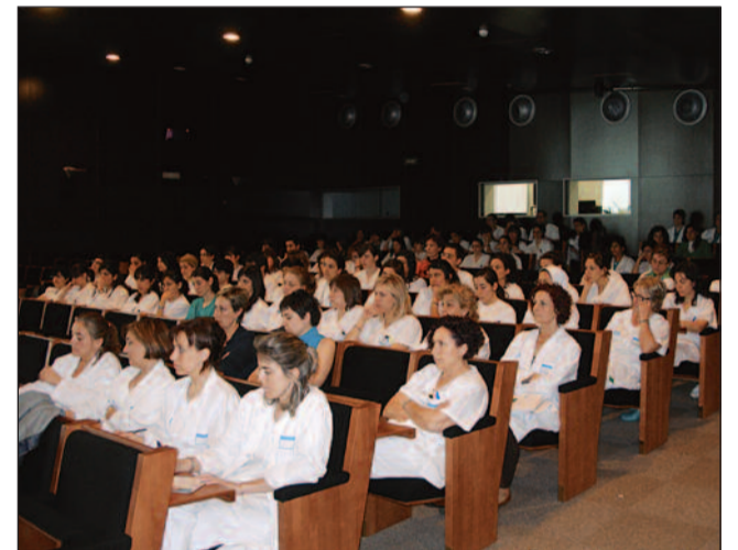
SATSE ha hecho de la investigación su gran apuesta de futuro

Cursos que han dado sus frutos en aquellas Comunidades donde antes se aplicó ya que, además de formar numerosos equipos de investigación, premiados muchos ellos en sus Comunidades de origen, se generó la necesidad de dotarse de una estructura estable: los De-