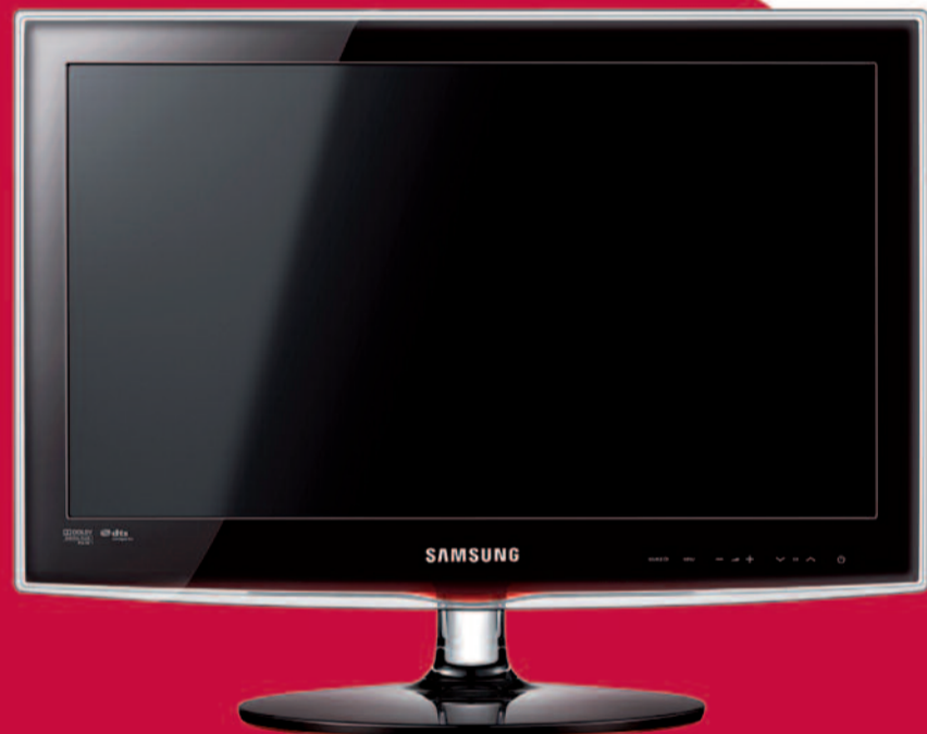
TV LED 22" Samsung UE22C4000

Promoción válida para nuevas nóminas o pensiones domiciliadas del 01/02/2011 al 31/03/2011 o hasta agotar existencias (4.500 uds. TV LED 22" y 3.000 uds. ordenador portátil HP), siendo al menos el importe en ambos casos de: 900€ para el TV LED 22"; o de 1.500€ para el ordenador portátil. Asimismo, el cliente deberá tener contratadas las tarjetas de débito y crédito, y domiciliar 2 recibos principales de entre gas, luz, telefonía, Internet o comunidad de propietarios. La concesión de las tarjetas queda sujeta a los criterios de riesgos del Banco.