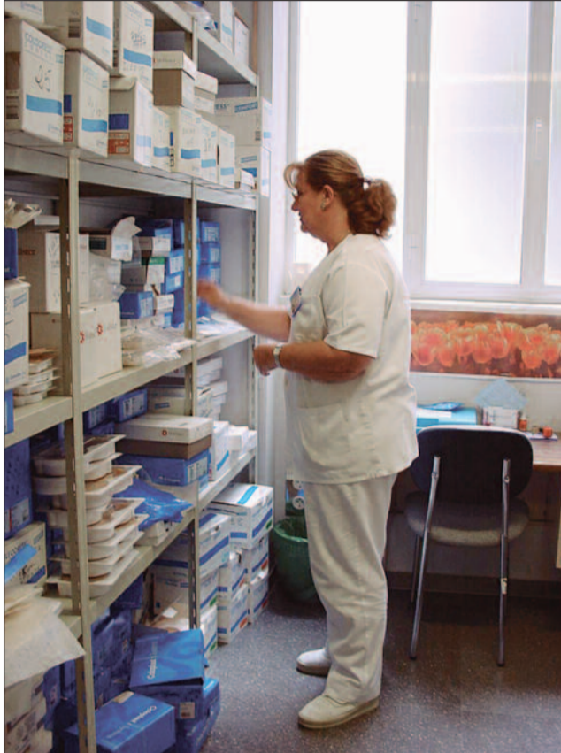
SATSE exige transparencia en la gestión de la Bolsa Única

El Sindicato de Enfermería ha detectado que se escoge a candidatos en función de su experiencia en determinadas áreas como pueden ser urgencias, unidades de cuidados intensivos, neonatología, hemodiálisis y quirófanos para contratos superiores a un mes. El incumplimiento se produce porque se tiene en cuenta dicha experiencia por encima de la puntuación. Por ello, desde SATSE denuncian que se trata de un "despropósito" y exigen "transparencia" en la gestión de la Bolsa Única.