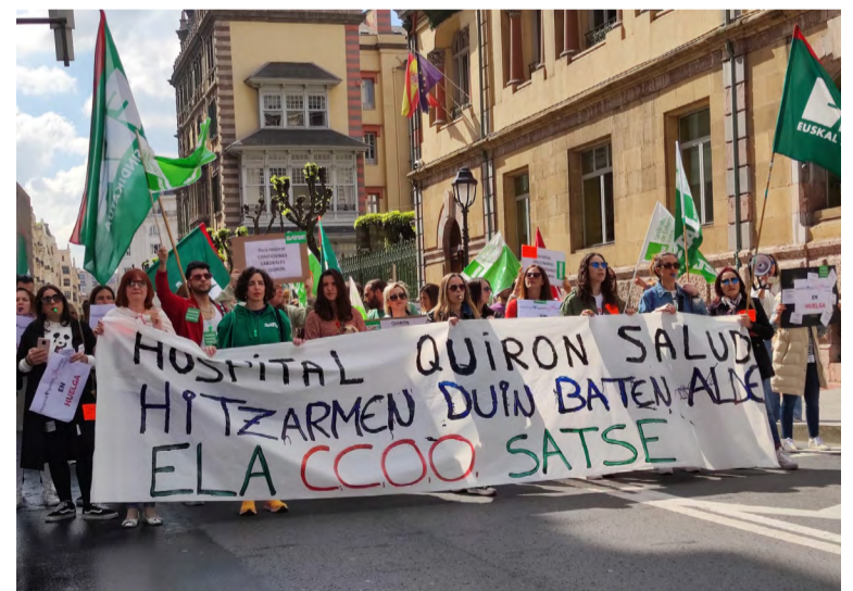
Los profesionales denuncian la precariedad que llevan viviendo durante años

La plantilla del hospital critica que el Grupo Quirón ya tiene convenios laborales en otros centros que mejoran ampliamente sus condiciones. “Sólo le pedimos a Quirón, que no nos trate como a trabajadores/as de segunda. Exigimos un convenio