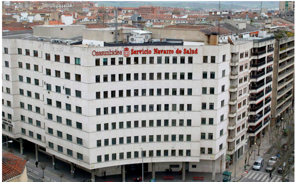
Imagen de la sede de Osasunbidea, Servicio Navarro de Salud

SATSE ha conseguido también el pago del complemento por trabajar en cualquier turno los llamados "días festivos especiales", así como el incremento de un 20% en el complemento de formación por tutorización de las EIR, y un 10% en el precio hora por guardia física o localizada.