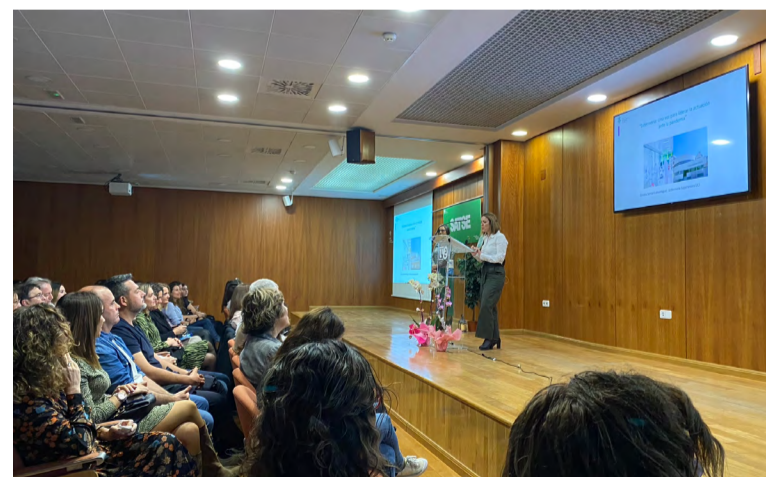
Un momento de la presentación de la Gala

como hospital de referencia de la ciudad, contando a finales del siglo XVI con 279 camas. A lo largo de los siguientes siglos el hospital se fue adaptando a cada tiempo vivido hasta que, en la década de 1940 se realizaron las obras que conformarían lo que llegó a ser el conocido como Hospital Provincial. En la historia más reciente de este hospital, cabe destacar que, en 2002, el centro pasa a ser un Consorcio entre la Conselleria de Sanidad y la Diputación de Valencia. En la actualidad, el centro cuenta con 503 camas, 27 quirófanos, y una media anual de más de 142.000 urgencias atendidas y 22.000 pacientes ingresados, atendiendo más de 400.000 tarjetas sanitarias.