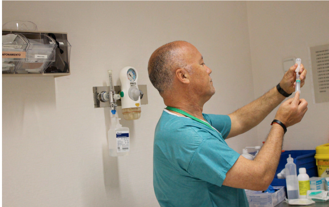
Lograr unos entornos laborales seguros y saludables es la prioridad para SATSE

Entre las distintas líneas y estrategias de actuación que desarrolla la organización sindical para lograr entornos de trabajo seguros y saludables, SATSE ha realizado distintas propuestas