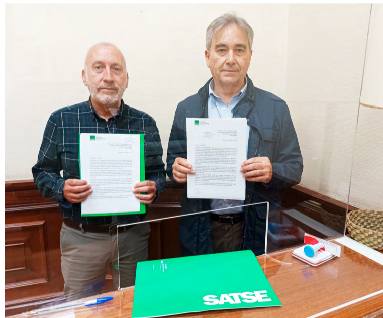
SATSE entrega en el Registro del Congreso la PNL sobre las pagas extraordinarias

SATSE se ha dirigido por carta a todos los partidos políticos para trasladarles la injusta y discriminatoria realidad laboral que sufren los trabajadores públicos y les ha trasladado una propuesta de PNL para que la hagan suya y la presenten en el Congreso de los Diputados al objeto de que todos estos profesionales vuelvan a ser reconocidos retributivamente con el abono completo de sus pagas extraordinarias.