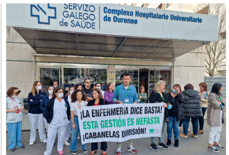
SATSE se ha concentrado para solicitar la destitución de la directora de Enfermería

La situación es muy penosa para los alrededor de 3.000 profesionales que están a su cargo, sufriendo numerosos y constantes agravios en el ejercicio profesional: jornadas superiores a la exigida, carteleras de trabajo con riesgo declarado para las enfermeras, cambios constantes de turnos y lugar de trabajo sin previo aviso, denegación sistemática de días de libre disposición, en los que subyace una falta de previsión que provoca la proliferación de contratos cortos