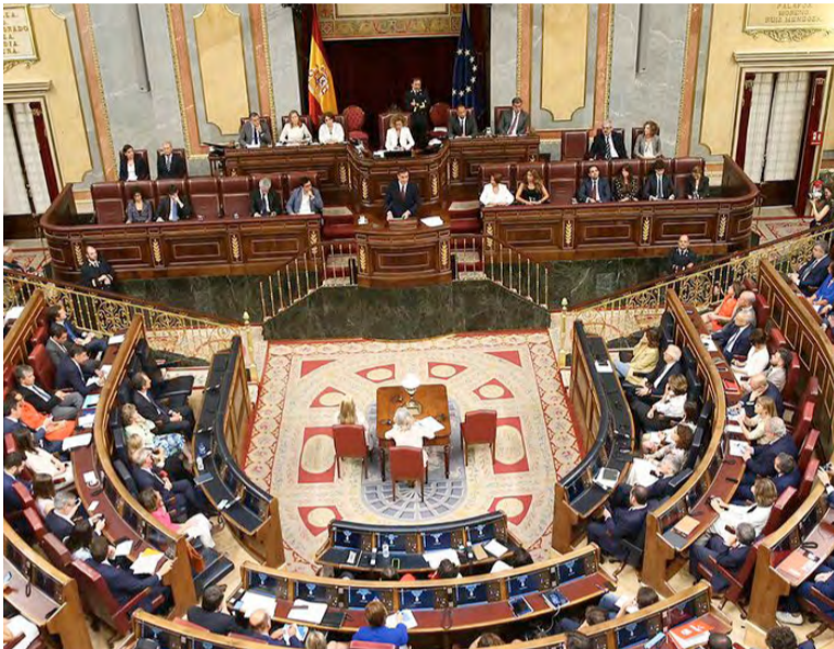
Imagen de los distintos partidos políticos en el Congreso de los Diputados