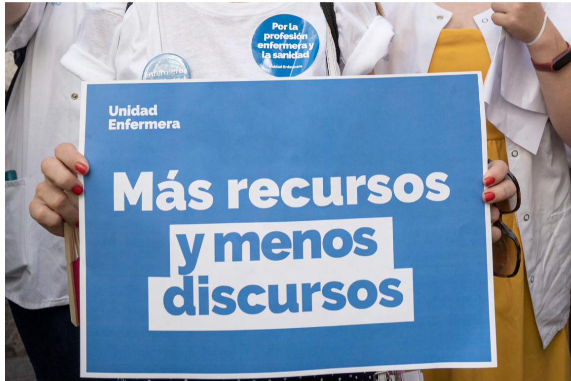
Unidad Enfermera se ha manifestado en las calles en defensa de los intereses de los profesionales de nuestro país

Unidad Enfermera, constituida por el Sindicato de Enfermería, SATSE, el Consejo General