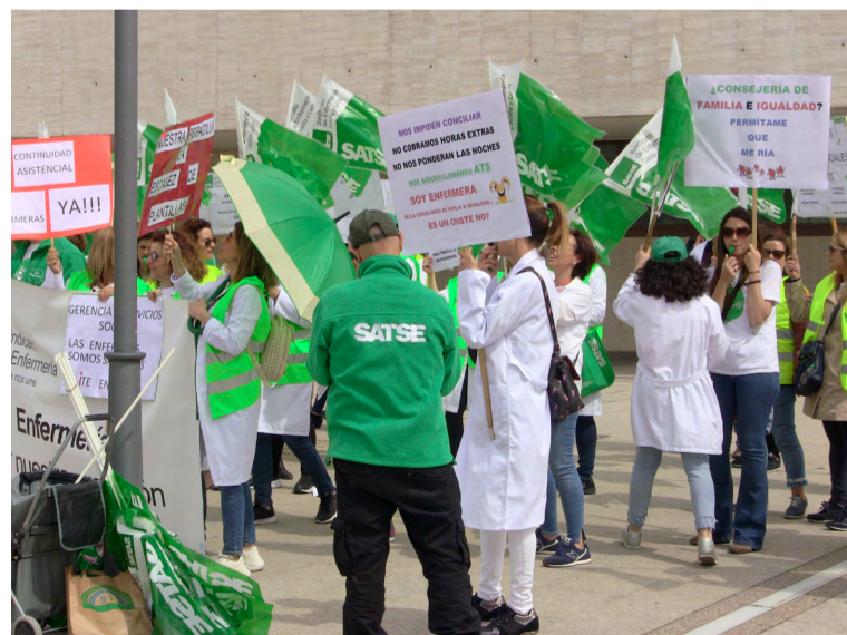
Un momento de la concentración convocada por SATSE

La jornada de 35 horas hace necesario que aumente el número de enfermeras en las residencias de mayores de la Comunidad castellano-leonesa, según SATSE, que entiende que "es imprescindible por la elevada carga de trabajo que ahora existe en los centros de Servicios Sociales", así como por la situación de dependencia de gran parte de los