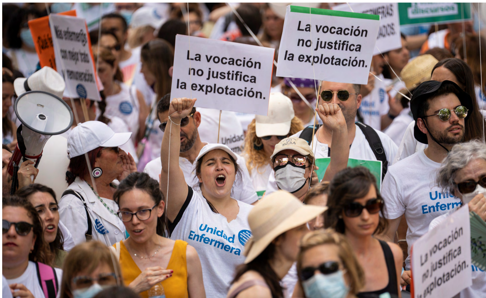
Última manifestación convocada por Unidad Enfermera en defensa de la profesión y la sanidad de nuestro país

Unidad Enfermera, constituida por el Sindicato de Enfermería, SATSE, el Consejo General de Enfermería (CGE), la Asociación Nacional de Directivos de Enfermería (ANDE), la Conferencia Nacional de Decanos de Enfermería (CNDE), Sociedades Científicas Enfermeras y la Asociación Estatal de Estudiantes de Enfermería (AEEE), considera esencial la aprobación de esta norma lo más pronto posible,