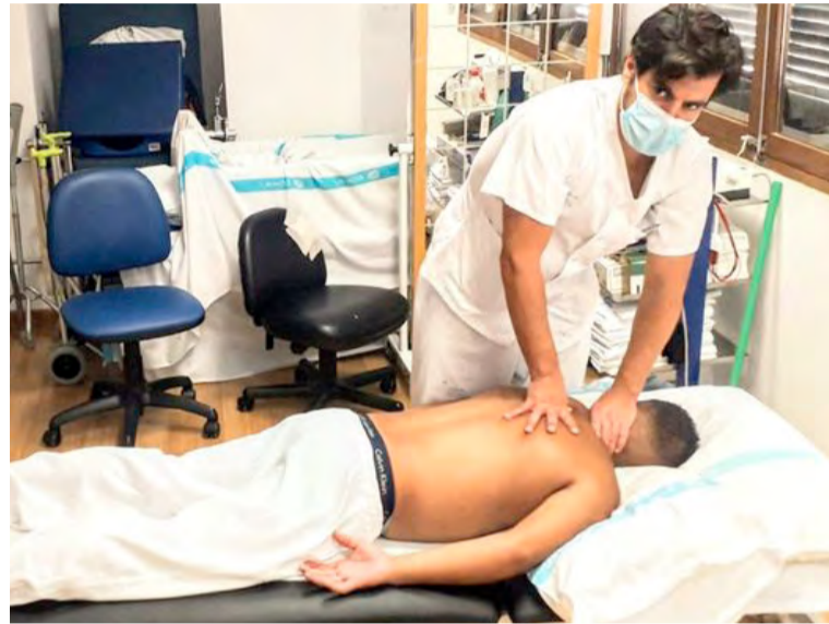
Los profesionales de Fisioterapia requieren mejoras urgentes

"Se está incentivando la privatización de un servicio asistencial sanitario esencial que para la mayoría de la población ya es previo pago", alertan.