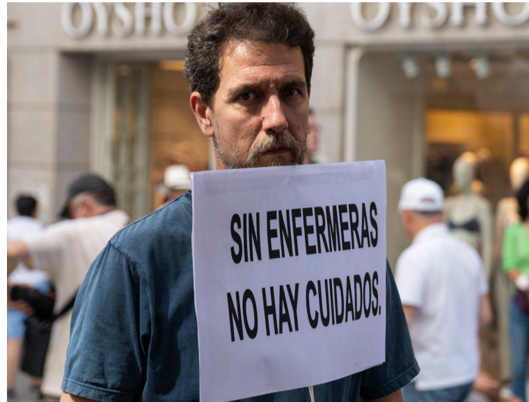
Ciudadano reclamando que haya una ratio adecuada de enfermeras en los centros

El Sindicato de Enfermería quiere tranquilizar a la patronal