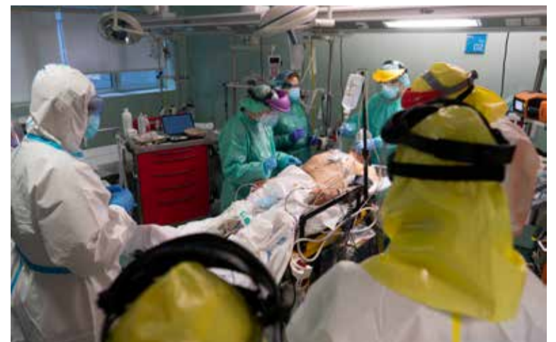
Las enfermeras y enfermeros sufren unas penosas condiciones laborales

Trabajo a turnos, rotaciones, guardias, trabajo nocturno, en fines de semana y festivos o la permanencia en centros y servicios especialmente difíciles y penosos, son algunas de las condiciones laborales de las enfermeras y enfermeros que conllevan un innegable desgaste y deterioro físico, psíquico y emocional que