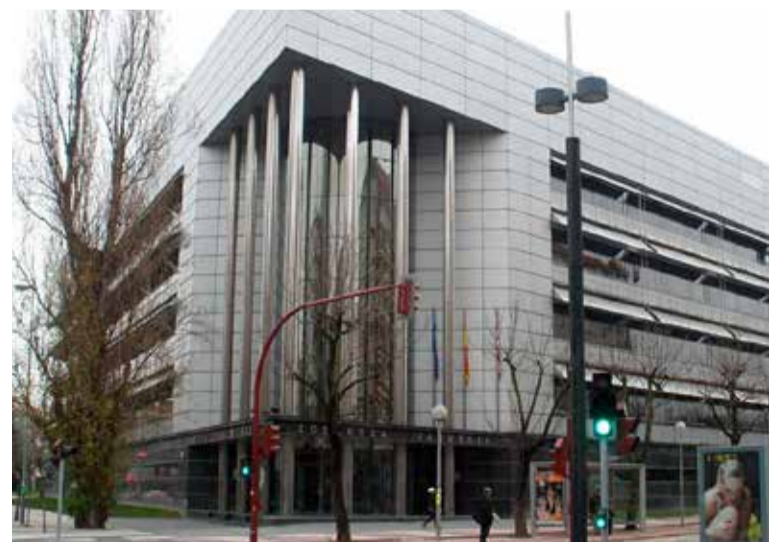
Imagen exterior de los juzgados de Vitoria-Gasteiz

El Instituto Foral puede recurrir la sentencia, ahora ante el Tribunal Supremo o cumplir con lo ordenado por la Justicia. “Desde SATSE Álava confiamos en que, en un ejercicio de respeto a la profesión, el IFBS convoque a la Comisión de Valoración y realice un revisión justa de las funciones que realizamos las enfermeras”, señala.