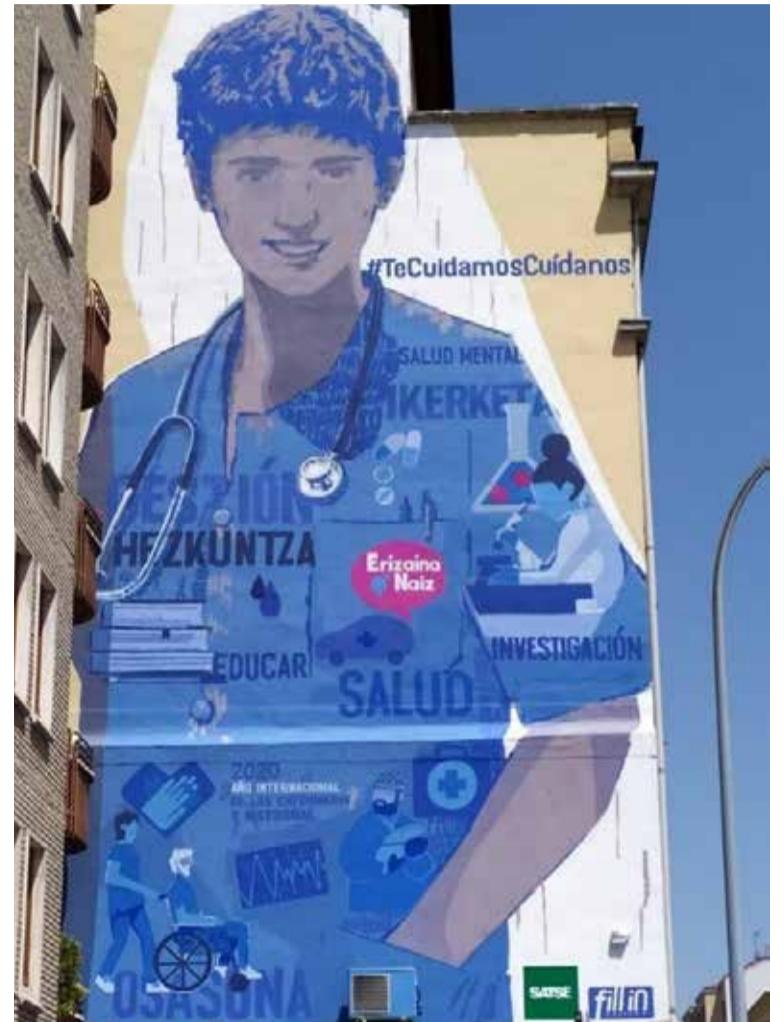
Homenaje de SATSE al papel que tienen las enfermeras y matronas en el SNS