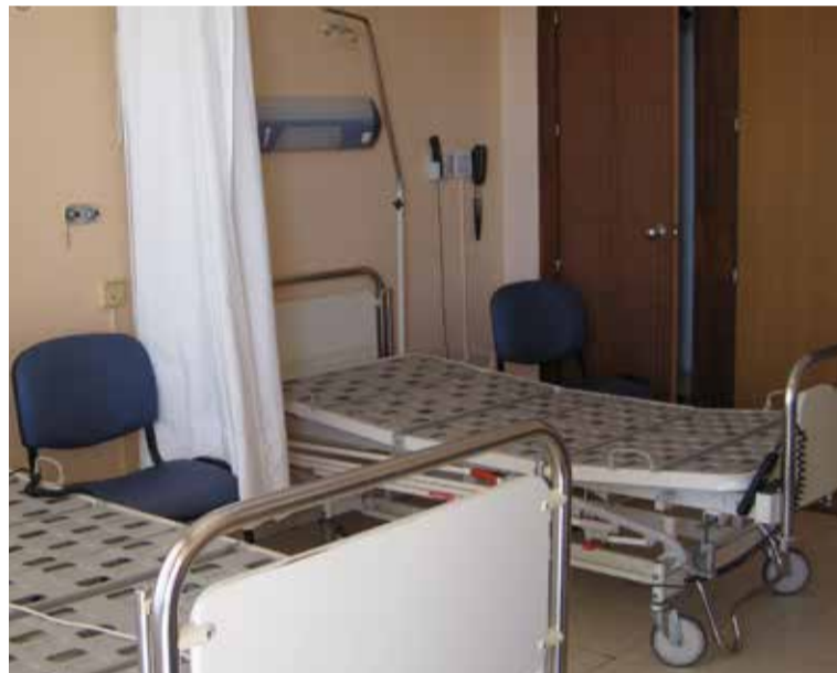
SATSE denuncia un año más la falta de contrataciones y el cierre de camas

SATSE reclamó durante la crisis de la Covid-19 que, dadas las especiales circunstancias de este año, los servicios de salud implementasen un "Plan de Choque" para mejorar la asistencia a pacientes con coronavirus y al resto de personas con cualquier otro problema de salud y reducir las listas de espera, y lamentablemente ha constatado que han