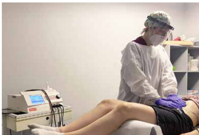
Pulp Físio te enseña cómo son ahora las consultas de fisioterapia

Los protocolos son estrictos pero sencillos. Cuando un paciente acude a consulta tiene que lavarse siempre las manos nada más entrar y llevar la mascarilla durante todo el tiempo que permanece en las instalacio-