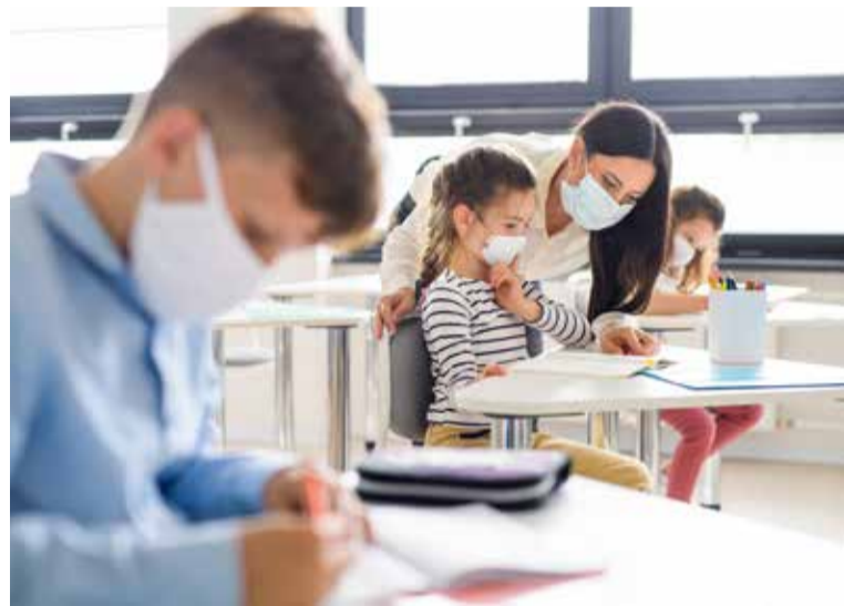
La protección de la salud de los niños, niñas y jóvenes, prioridad para SATSE

La Plataforma recuerda que organismos, como la OMS, instituciones, como el Congreso de los Diputados, o expertos y sociedades científicas han considera-