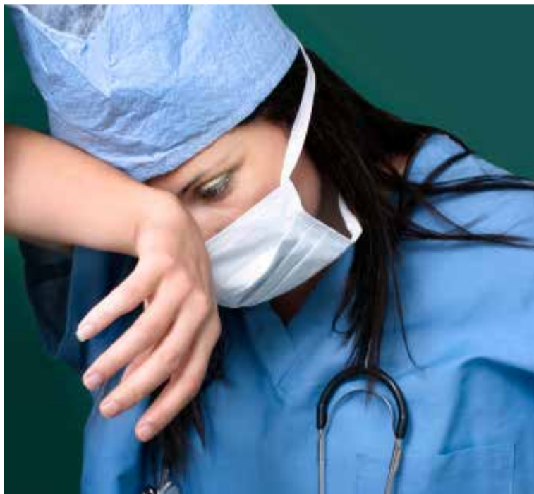
La actividad de las enfermeras debe ser considerada enfermedad profesional

“No era lógico ni justo que se cambiase la cobertura existente para el personal que presta sus servicios en los centros sanita-