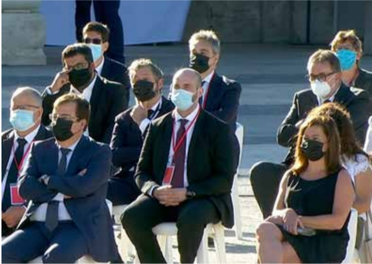
El presidente de SATSE, junto al resto de invitados al acto de homenaje