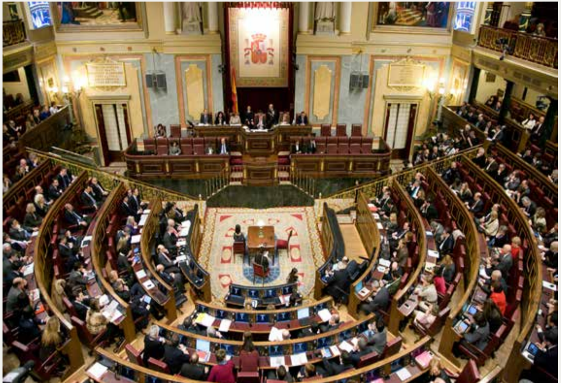
Imagen del Pleno del Congreso de los Diputados

Aprobado con acuerdo el dictamen sobre Sanidad