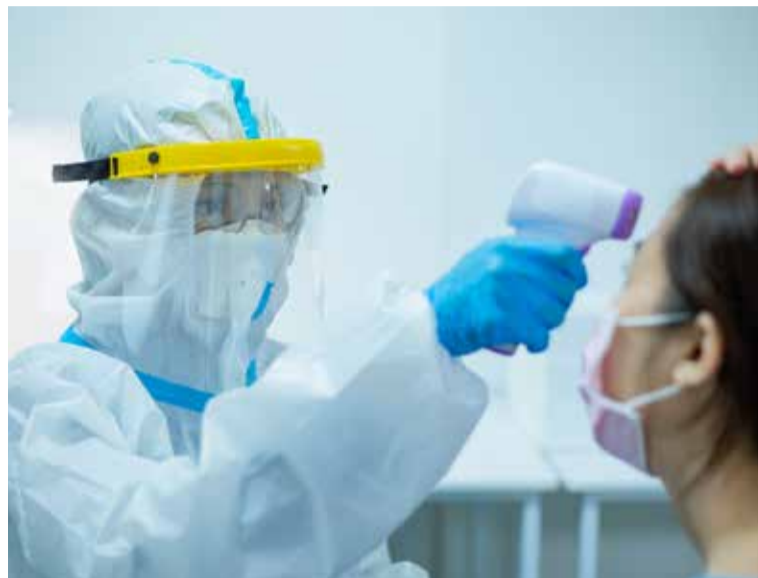
Un profesional de Enfermería toma la temperatura a una paciente

de emergencia sanitaria, SATSE reclama, con más fuerza si cabe que el Gobierno sea sensible a la gran dureza física, psicológica y emocional de la actividad desarrollada por las enfermeras y enfermeros y que apruebe un sistema de jubilación por coeficientes reductores que, además, no implicaría una sobrecarga adicional del sistema público de pensiones ni tampoco de la Seguridad Social, ya que prevé una cotización incrementada que se abona durante toda la vida laboral.