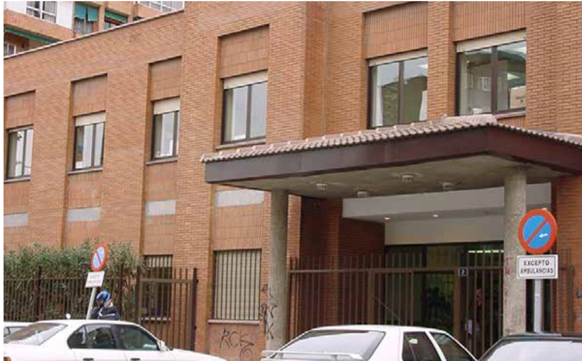
La crisis de la Covid-19 ha traído un cambio en la atención que se presta a los pacientes en los centros de salud

Asimismo, el Sindicato señala que, si desde el punto de vista de la atención a los pacientes se quiere instaurar y potenciar la