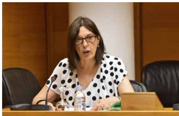
La secretaria general de SATSE durante su intervención en las Cortes Valencianas

Por ello, la representante de SATSE ha abogado en las Cortes Valencianas por un itinerario para la vida laboral de las enfermeras basado en la flexibili-