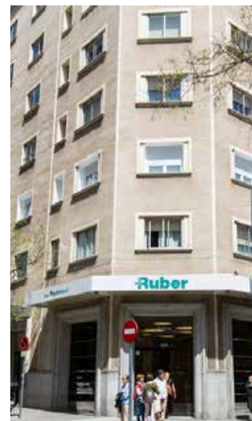
SATSE consigue mayoría absoluta

De igual forma, añaden que "exigiremos un mayor control y cumplimiento de la normativa en materia de salud laboral" con el objetivo de que los profesionales del centro puedan desempeñar, con total garantía y seguridad, su labor diaria en la atención sanitaria que prestan a los usuarios.■