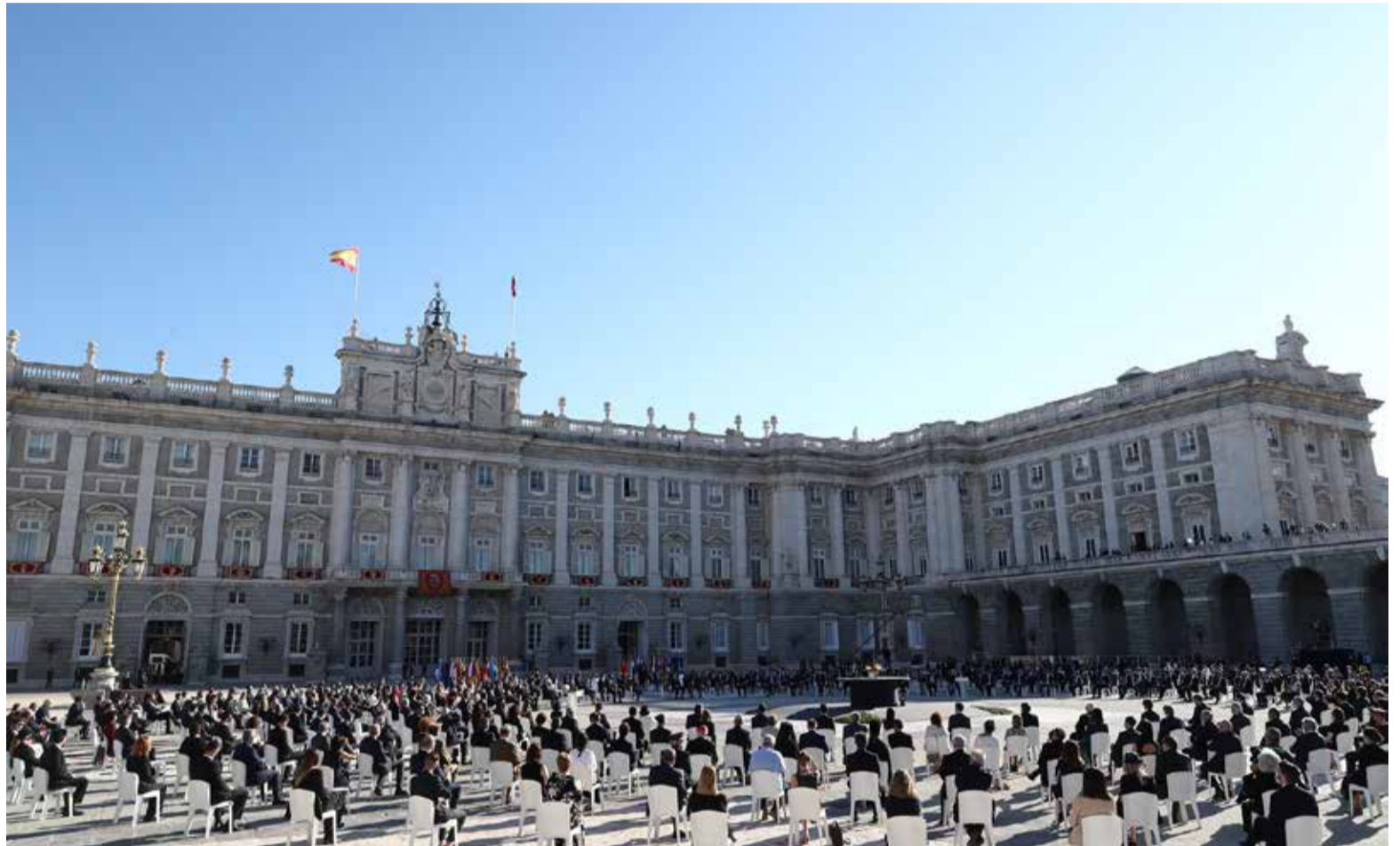
El acto de homenaje de Estado congregó a autoridades políticas de España y Europa, así como a representantes de organizaciones profesionales, como SATSE

“Ha sido difícil, muy difícil. Y, sin embargo, nuestra sociedad ha dado una lección de inmenso valor. España ha demostrado su mejor espíritu. Cuando pasen los años, recordaremos que nos hemos dado un ejemplo de civismo, de madurez, de resistencia, de compromiso con los demás”, manifestó.