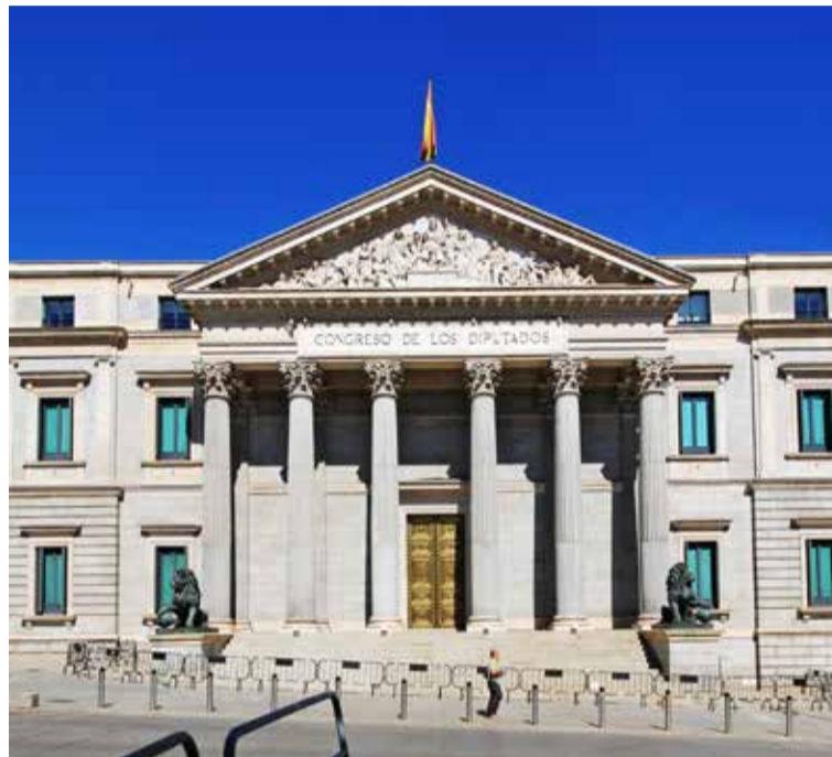
El nuevo periodo de sesiones en el Congreso debe traer nuevas leyes

Por ello, y de cara al nuevo curso parlamentario tras el verano, el Sindicato de Enfermería reclama que se debata en la Cámara Baja la Proposición de Ley de Seguridad del Paciente que llegó al Congreso en octubre del pasado año gracias a que la organización sindical recabó más de 660.000 firmas de ciudadanos y