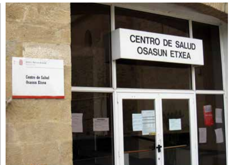
Fachada de un centro de salud del SNS-Osasunbidea

A pesar del acuerdo alcanzado en el Gobierno de Navarra, no