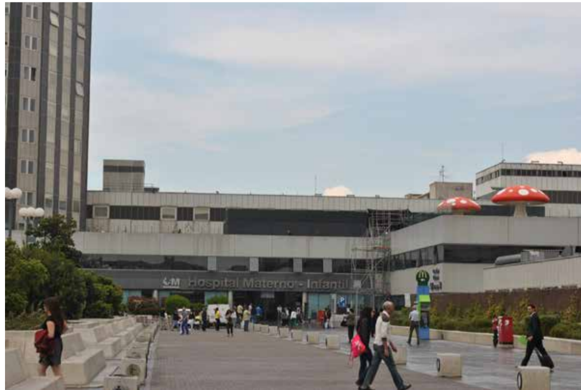
El cierre de camas, servicios, consultas y centros ha vuelto a ser la tónica general este verano

SATSE reclamó durante la emergencia sanitaria de la Covid-19 que, dadas las especiales circunstancias de este año, los servicios de salud implementasen un "Plan de Choque" en verano para mejorar la asistencia a pacientes con coronavirus y al resto de personas con cualquier otro problema de salud y reducir las listas de espera, y lamentablemente ha constatado que se han