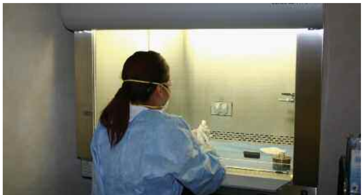
SATSE ha reclamado un mayor control a la hora de la manipulación de los medicamentos peligrosos

SATSE, que ocupa una Vicepresidencia en CESI, lleva años demandando, tanto a la Unión Europea como a las administraciones españolas, que se aborde con seriedad la problemática de los riesgos derivados del uso de fármacos peligrosos por parte de los profesionales sanitarios, especialmente por los de Enfermería, ya que son los que con más fre-