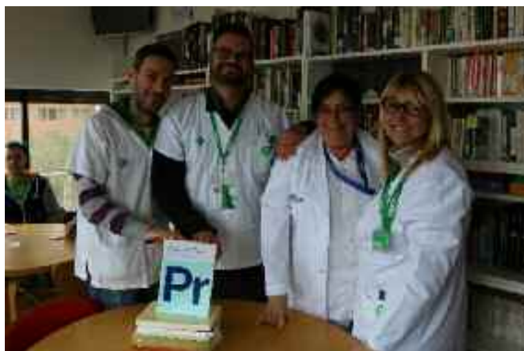
Los delegados de SATSE con algunos ejemplares donados a la biblioteca del centro