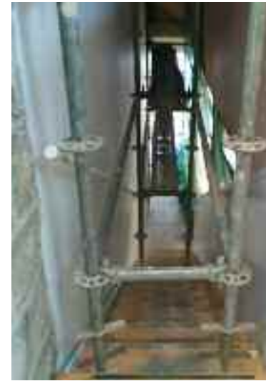
Arreglos en el Centro de Salud de La Cabrera

En Soto del Real, los ladrones entraron en el Centro de Salud cuando los trabajadores del Servicio de Atención Rural (SAR) estaban trabajando, aprovechando que estos últimos sólo ocupan parte del edificio, llevándose recetas y la mochila de Avisos de