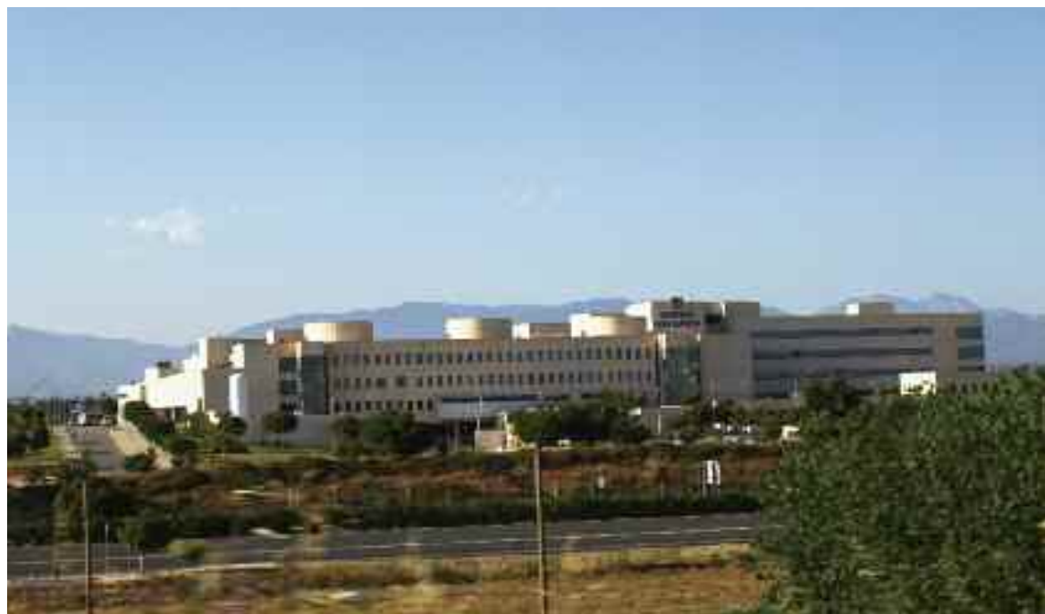
SATSE Baleares ha apoyado el Decreto de Catalán debido a que modula los efectos de la Ley 4/2016