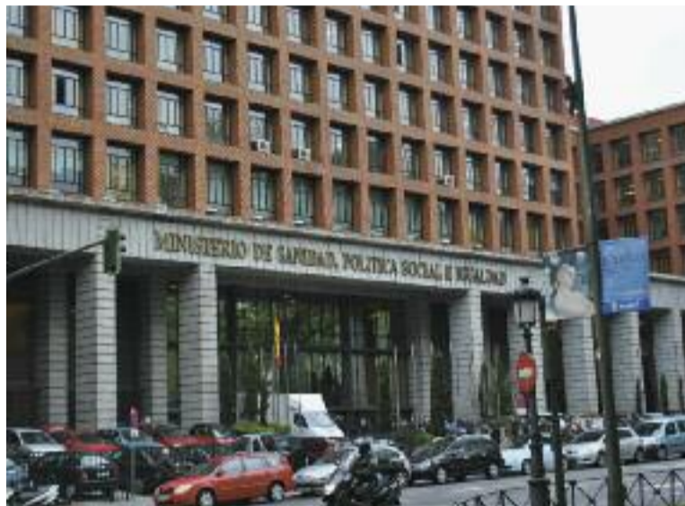
SATSE aboga por la transferencia para mejorar las condiciones de los profesionales de enfermería

Además de en distintos escritos a los responsables del Ministerio de Interior y Sanidad, así