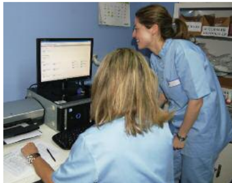
Osakidetza se ha comprometido a crear un servicio de igualdad en el ente público

Invertir en igualdad proporciona numerosos beneficios que repercuten en un sistema sanitario más igualitario y justo. “Desarrollar políticas de igualdad visibiliza la profesión enfermera y ayuda a romper la jerarquía existente en los centros de trabajo. Ciertamente, fomentar el trabajo en igual-