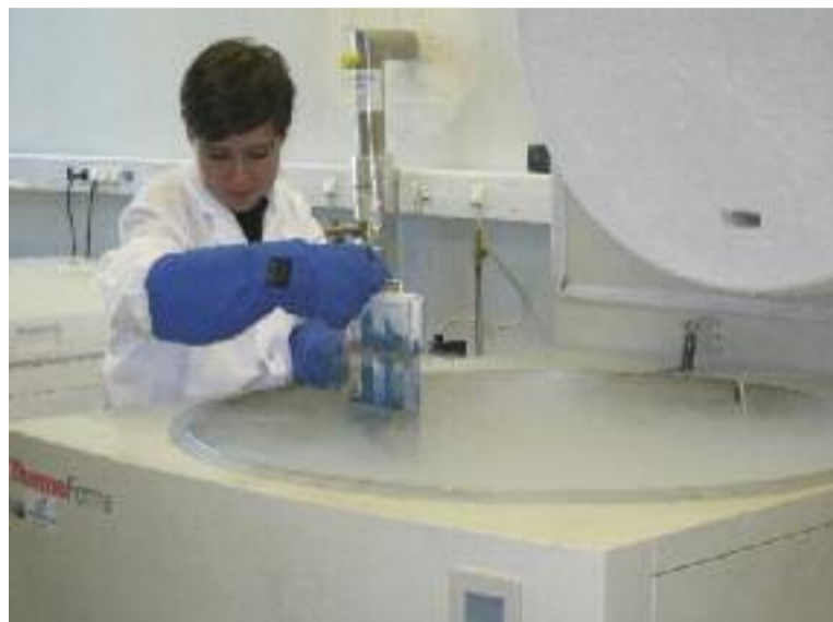
SATSE se ha adherido al acuerdo para poder seguir defendiendo a la enfermería de este ámbito

No obstante, el Sindicato de Enfermería pudo corroborar en la Mesa Sectorial que desde la firma del acuerdo por los sindicatos de clase el pasado mes de julio no se han producido avances en su desarrollo, motivo por el que exigió la convocatoria de manera urgente de las reuniones de las mesas