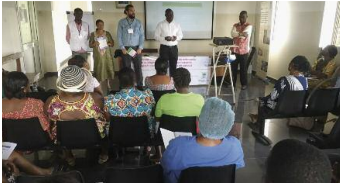
Acto de presentación del plan de formación permanente en enfermería

► El programa pretende mejorar el nivel científico y técnico de las profesionales de Enfermería ► Cerca de 200 enfermeras han participado en las primeras formaciones