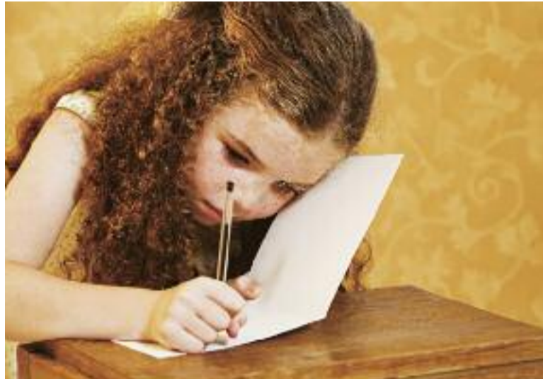
Una vez fallados los concursos literarios ya es hora de comenzar a escribir los de 2018

Sospechas que se ciernen sobre un grupo de amigos, las relaciones que entablan, el fallecimiento de uno de ellos y un mis-