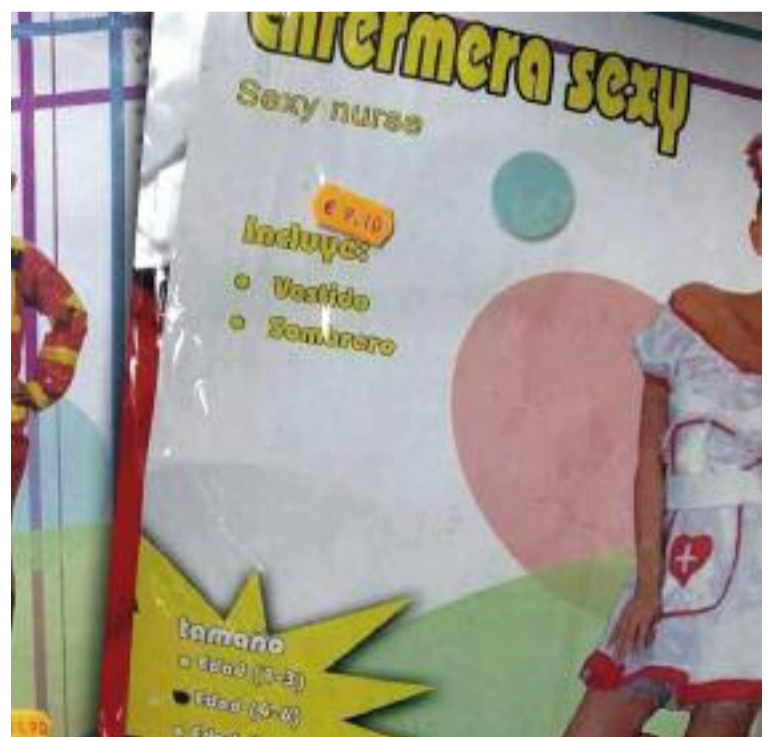
La distribución de disfraces de ‘enfermeras sexis’ es uno de los casos denunciados por SATSE

De igual manera, SATSE seguirá insistiendo a las diferentes administraciones públicas para que no permitan que este tipo de “ataques” a la Enfermería y, también, al Sistema Sanitario en su conjunto, se sigan produciendo, reclamando que pongan en marcha todas las acciones disuasorias necesarias. *