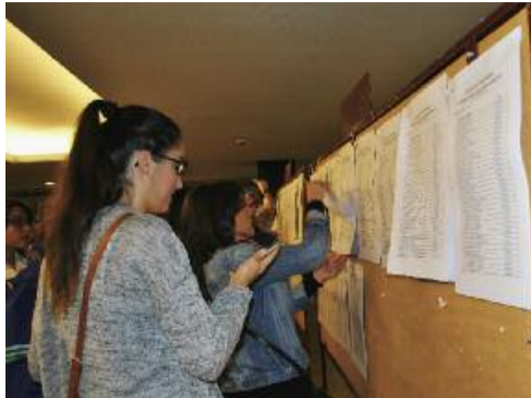
SATSE Madrid ha detectado múltiples errores en los listados de Carrera

Los errores, imputables a la Administración sanitaria, han sido numerosos y continuos, los lista-